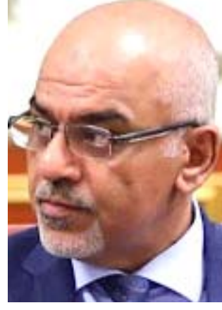
نبيل كاظم عبد الصاحب