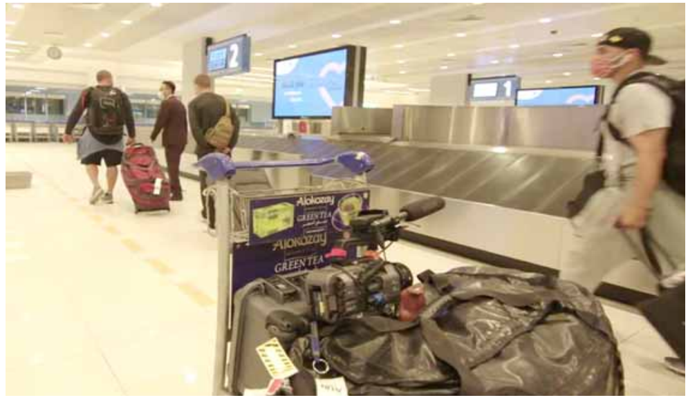
جزيرة: تجمع أعظم مقاتلي العالم في جزيرة خاصة لسابقة فنون الدفاع عن النفس

والرياضيين والمقاتلين، ليتوجهوا إلى جزيرة القتال، بعد إجراء فحوص كشف فيروس كورونا عليهم جميعاً قبل سفرهم وتم يخضعون لعدة فحوص أخرى في أبو ظبي. وفي المجمل من المتوقع إجراء حوالي 3300 فحص لكل الواصلين إلى الجزيرة. وتعد المسافة من المطار لجزيرة ياس، وهي نحو خمسة أميال بالسيارة، «منطقة آمنة» لا يمكن للزوار مغادرتها، وتضم نقاط تفحيش بنع الجمهور من الدخول إليها. وتحتوي المنطقة على ملعب غولف وشاطئ وفنادق ومطاعم، بالإضافة إلى ثلاثة مراكز طبية يعمل فيها 17 شخصاً وسبقوا أكثر من 2500 من موظفي الاتحاد والموظفين العاملين في جزيرة ياس داخل هذه المنطقة، وقد خضع جميع الموظفين المحليين إلى حجر صحي لمدة 14 يوماً، فضلاً عن اشتراط إجراء كل واحد منهم لثلاثة فحوص لتفحص عن الفيروس تكون نتائجها سلبية. وفي الحجر الصحي قبل السفر من لندن، كان على مآكان إقامة بمفردها في غرفتها في الفندق ولكن في جزيرة القتال التي تبلغ مساحتها 9.6 أمتار مربعة، يسبح بقاء المربين من المقاتلين في جزيرة القتال بسلامة. كما استضافت الجزيرة حفلات موسيقية مثل تلك التي أقامتها فيونيسي ومادونا وفريق رولينغ ستونز، وتضم أيضا العديد من المنجزات الضمنية، ومن ضمنها عالم فيسراي، بالإضافة إلى مركز تسلق وملعب غولف ومرسى وشاطئ، كيف ستجرى الفعاليات في الجزيرة؟ سيسافر إلى الإمارات نحو 630 من أعضاء الاتحاد ومن العاملين