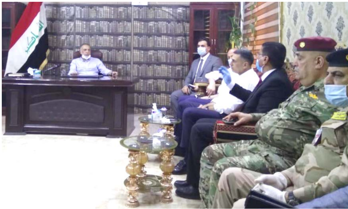
تفقد : رئيس الوزراء يتفقد شركة الموانئ العراقية بالبصرة ضمن برنامج زيارته الى المحافظة امس

بالتنسيق مع هيئة المنافذ بعد نسد مندلي والمنذرية بناءً على توجيهات القائد العام للقوات المسلحة بشأن السيطرة الكاملة على المنافذ الحدودية كافة وتأمين الحرم الكمركي وفرض الأمن وإنفاذ القانون فيها، مشيرة إلى ( تكليف عمليات الصنرة بالسيطرة التامة على منفذ الشلامجة مع الجمهورية الإسلامية الإيرانية ومنفذ صقوان مع دولة الكويت البحرية في ميناء أم قصر الشمالي والأوسط والجنوبي وتعزيز القيادتين بقوات من احتياطي القائد العام للقوات المسلحة وتحويلها بجمع الصلاحيات لفرض الأمن وإنفاذ القانون في هذه المنافذ والتعامل المباشر مع أي مخالفة للقانون أو حالة تجاوزهما كانت الجهات التي تفقد ورائها وفرض هيبة الدولة وحماية المال).