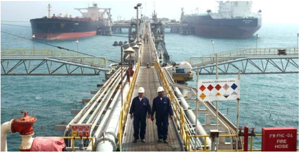
ميناء فاو راسية في ميناء البصرة

الزراعة وفق مبدأ البيع المباشر. وقال بيان تلقته الزمان اسم ان (الشركة العامة للتجهيزات الزراعية تسعيرة رقم 8لسنة 2020تقرر خلالها تحديد تسعيرة للمعدات الموردة ووفق مبدأ البيع المباشر وتشمل بيوت بلاستيكية متكاملة وانايبس خاصة بمنظومات الري بالتنقيط وانايبس الري الثابت)، وبحسب الضوابط فان سعر بيت بلاستيكي متكامل ويشمل هيكل حديدي 56,5 متر 24 قوس مع