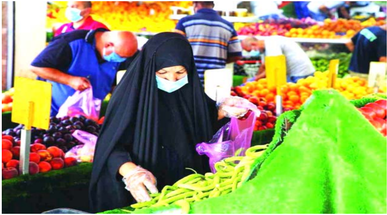
سوق في مذبوعون يشترون منتجات زراعية من السوق

مستحقاته المالية لأشهر وبعض الأحيان لسننات، ما يسبب لنا خسائر و .باع كبريز محصوله هذا العام مباشرة في اسواق الجملة للمرة الأولى. بسعر أقل، ولكن أسرع والدفع مياشتر.