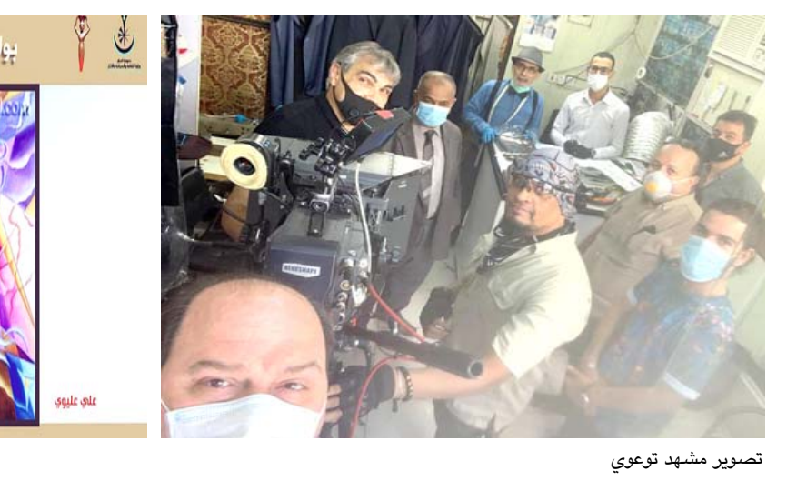
تصوير مشهد توعوي