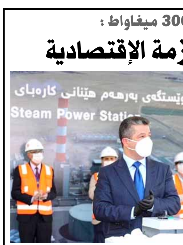
مسردر البارزاني في حفل افتتاح محطة خبات

(الغارات الجوية التركية التي استهدفت شمال العراق بدأت في اليوم الذي غادر فيه طريف في البلاد)، مقسألة (هل كانت هذه الهجمات قد تم تحالوها او التخطيط لها في هذا الاجتماع). و اشارت كارلين إلى أنه (في 18 حزيران، اسدعت بغداد سفيري تركيا وإيران لمناقشة العمليات العسكرية الجارية ضد الجماعات الكردية في البلاد، وطالبت السفير التركي بوقف الاعمال العسكرية الاستغفزازية على الأراضي العراقية على الفور، كما تم توبيخ السفير الإيراني ابرج مسجدية بسبب هجمات الحرس الثوري الإيراني التي اسدفت عن القوي في الممتلكات). واضردت وزارة