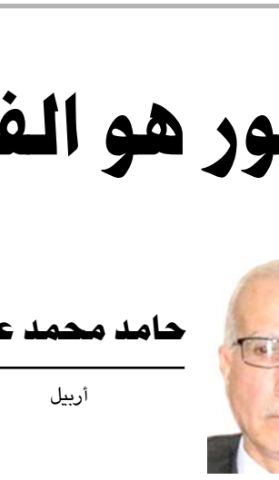
حامد محمد علي

بموجب بيان ١١ اذار 1970 توصلت القيادة الكردية مع النظام البائد الى حل القضية الكوردية وانهاء قضية مروثة من العهد العثماني وذلك بإنشاء الحكم الذاتي لكردستان على ان تكتلم مؤسساته والمسائل الرئيسية منها كركوك والمناطق المذكورة في المادة ١4٠من القوانين الفتحية خلال اربع سنوات وجرت احتفالات ومهرجانات بهذه المناسبة الا ان الخطة ماطل في تنفيذ البيان وراح يحيدك المؤامرات وشراء الذمم واعداء تنظيم قواته وفي خريف ١97٦ ارسل وقدا من رجال الدين للحوار مع البارزاني فوخت ريفسهم بعيوات ناسفة تحت جيبته واهوموه بانها جهاز لتسجيل الحوار وعندما تكلم البارزاني كان رجلا يقدم الشاي لهم وافق بينهما فضغط الرجل المعنى زر التسجيل فانفجرت العيون وقتل البارزاني والوفود الثلاثة الجالسين بجواره وسلم البارزاني مع مرافقه وفتحت هذه الحادثة فجوة عميقة بين الطرفين