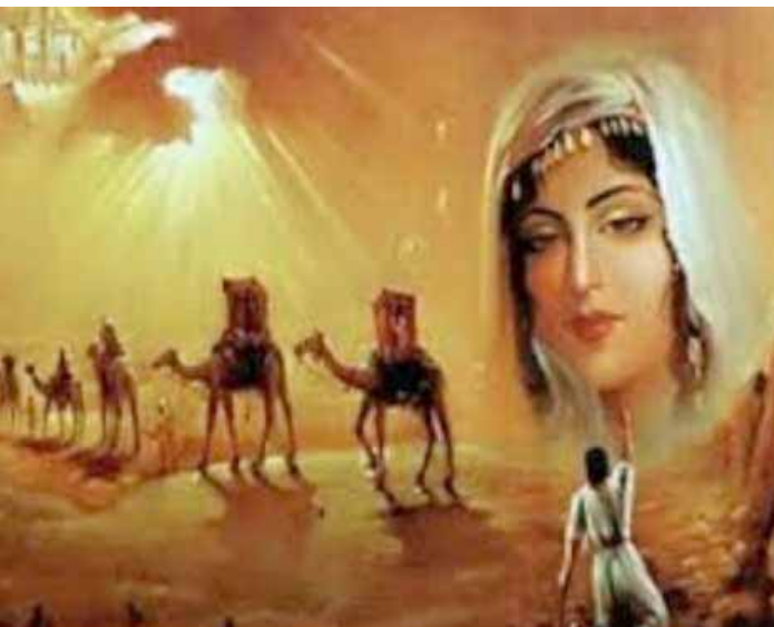
رسم تخيلي لقصة قيس وليلى

كانوا لديهم معتقد ان الزواج عن حب والمعاشرة الزوجية سوف تكون شهوانية الى حد فقدان العقل وهذا سوف ينتج حمل معاق لانه الرجل والامراه في ذلك الوقت فاقدن العقل ونشوة الحب التي تجمعهم ..بسبب هذا المعتقد عم عدم الزواج على حب والمودة .. ولو حكماً الاسلام نجد انه اوصى بزواج بالرضا قال رسولنا الكريم..حث النبي عليه الصلاة وهذه الحقيقة لاحد يمكن والاسلام على اختيار الزوج