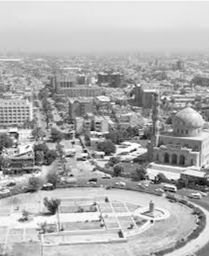
ساحة الفردوس من الجو

وامريكا والى هذا اليوم حروب طائفية هذه الحروب لم تغطي الفرصة الكافية لهؤلاء الناس لتفجير سمات الشخصية البدوية الى سمات المدينة المتحضرة بقيت تلك السمات منتشرة الى هذا اليوم في بغداد والدليل على ذلك لو نلاحظ ان منطقة