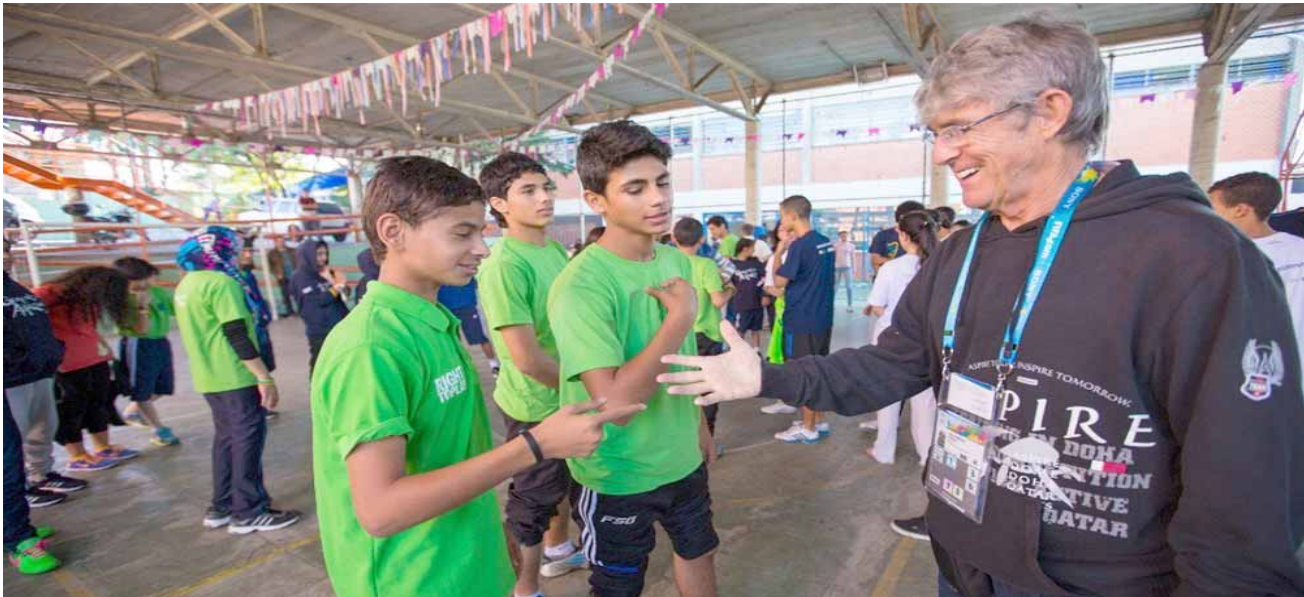
جانب من تكريم المواهب الكروية في مهرجان رياضي

حوارية عبر تقنية الاتصال المرئي، بمناسبة مرور 45 عاماً على بدء العلاقات الثنائية بين قطر والمكسيك . والقى الذوادي الكلمة الافتتاحية في الندوة التي شهدت مشاركة سعادة السيد محمد الكواري، سفير دولة قطر لدى المكسيك، وسعادة السيدة غراسيلا غوميز، سفيرة المكسيك في دولة قطر، والسيد يوان دي لويزا، رئيس