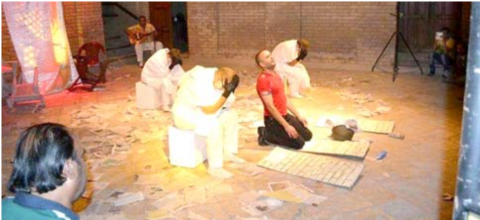
على اخراج الصورة الجصرية بشكل أكثر احترافية للمتفرج .

وشمل برنامج الحفلة عدداً من أغنيات بيتلز الشهيرة، منها كام توغيزر وأول بو نيد إن لاف ووين إيز ليتل هلب فروم ماي فرييندر. كذلك ضم البرنامج مقاطع فيديو من الأرشيف وتسجيلات منزلية وشهادات مسجلة من فنانين بينهم شيريل كرو وديفيد لينش. وحضر البث الحي للحفلة نحو 130 ألفاً من محبي بيتلز وريغو ستار.