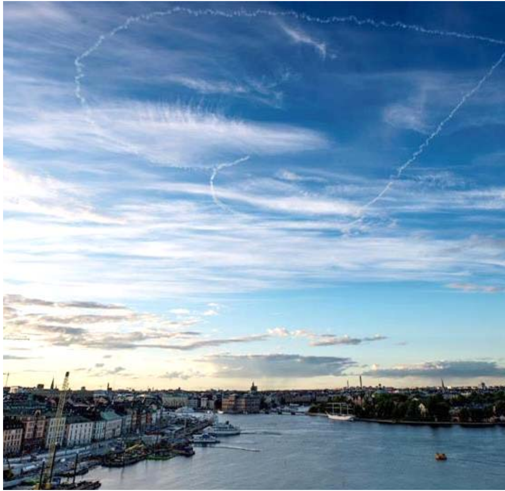
سماء : قلوب عملاقة تزين سماء ستوكهولم

مواقع متفرقة في أستراليا ( 19 ألاف إصابة و 106 وفيات)، تم فرض الحجر مجدداً على خمسة ملايين نسمة في مليونين لمدة ستة أسابيع وإغلاق حَسود وإبسية فيكتوريا. ويبدو الوضع في أوروبا تحت السيطرة على الرغم من ظهور بؤر جديدة، ولا القارة الأكثر تضرراً مع تسجيلها أكثر من 200 ألف وفاة، بينهم أكثر من المثلثين في المملكة المتحدة وإيطاليا وفرنسا وإسبانيا.