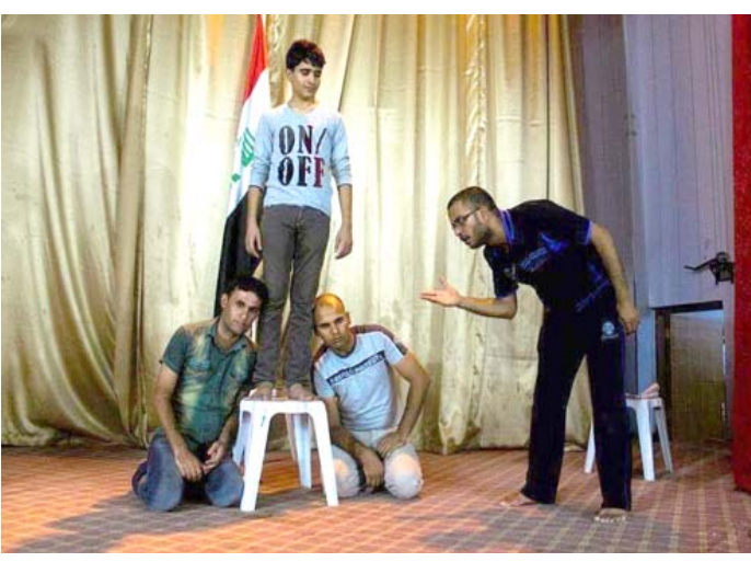
المخرج السوري يستعد لعرض مسرحيته (أدريثالين) حيث تجري التمارين على خشبة مسرح القباني بدمشق مع نخبة من النجوم الشباب.

العامة - الزمان اطلق محترف ميسان المسرحي وبالتعاون مع منصة المسرح استمارة المشاركة في النسخته الاولى من ملتقى يوسف العاني الدولي للقراءة المسرحية المعاصرة اونلاين 2020. وقال الكاتب والمخرج عدي المختار اشرف العام على محترف ميسان