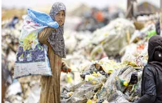
امرأة تبحث في مكب النفايات

كنا وما زلنا نطمح في ان يكون القادم افضل في العيش الكريم لنا ولعوائلنا التي عانت من الفقر لسياسات حكومات فاسدة وتدهور الجانب المعيشي والخدمي ايتام من عوائل الشهداء وفقراء وطن وبطالة الخريجين وزاد الطين بله كورونا وتداعيتها على الاقتصاد الوطني العراقي هناك من لايجد قوته البومي ممن لا يمتلك مصدر رزق غير المهن الحرة للعيش الكريم ويعمل يوميا من اجل توفير لقمة العيش لعائلته فكيف اذا توقف عن العمل لاكثر من شهر وهو لا يملك من يعينه في الحياة سوى هذا العمل .حياة مأساوية تعيشها اغلب عوائل البلد بسبب غياب تخطيط الحكومات للالتزام والتعامل معها الازمة الاقتصادية يجب ان لا تنعكس سلبا على المواطن وخاصة الفقراء واصحاب الدخل المحدود الحلول موجودة في تخطي هذه الازمة في تفعيل الجانب الصناعي والزراعي ودعم مشاريع الشباب واستثمار قطاع السياحة الدينية والمتنزهات