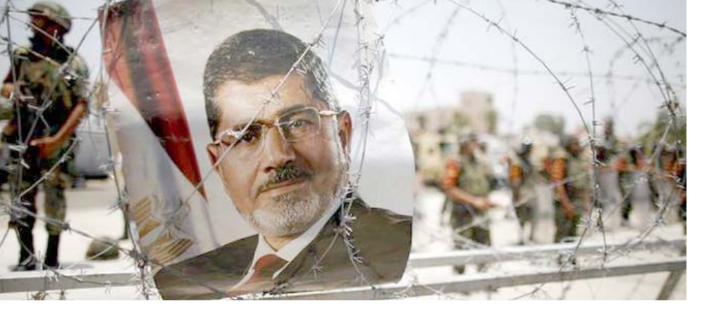
صورة محمد مرسي على جدار شانك

ثمة بالتأكيد أسباب وتفسيرات كثيرة أخرى يمكن أن تلقّ وراء عدم اكتمال نضوج هذا الانحسار والتماهي من بينها حجم التحديات وقلة الخبرة وعمليان الشارع والصراع الحزمو لاآقراء بالسلطة بين مدينة ولدية وعسكرية عديدة ومتناصلة. لكن ثمة سببا ربما لا يقل أهمية عما سبق ذكره ولم تسلط الأضواء عليه بشكل كاف وهو "تعلّق بطبيعة التكوين السيكولوجي للشخصية المتضوية تحت عباءة الأحزاب السرية بشكل عام. إن يكاد يغفل على تلك النقاط شعوب الصيغة الاعتزالية المتعلقة على نفسها بالإضافة إلى تخبيها صفة المعارضة الدائمة