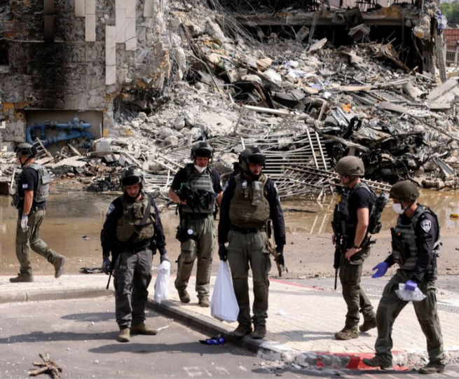
صدمه : إسرائيليون يتجمعون بالقرب من موقع شهد قتلاً مع حماس

جولة صحورية وأعلن وزير الخارجية الأمريكي أنتوني بلينكن ، أنه سيزور السعودية ومصر والإمارات العربية المتحدة، في إطار جولة صحورها الحرب بين إسرائيل وحركة حماس، وأعلن بلينكن عن المحطات الإضافية في جولته خلال مؤتمر صحافي في تل أبيب. وكانت الخارجية الأمريكية قد في وقت ، قالت وزارة الخارجية الإسرائيلية إن مؤلفا في سفارتها لدى بكن تعرض لهجوم الجمعة. وجاء في بيان الوزارة أن (موظفا إسرائيلياً في السفارة لدى بكن تعرض لهجوم ، مع توضيح أن الاعتداء لم يقع داخل ممتلكات السفارة). وأشار إلى (الموظف يتلقى العلاج في المستشفى وحالته مستقرة، وأنه يجري التحقيق في ووافع الهجوم). وأكد الجندي الإسرائيلي الجمعة، مقتل 258 جندياً على الأقل منذ العملية عبر المسيرة التي شنتها حركة حماس للانطلاق من قطاع غزة في نهاية الأسبوع.