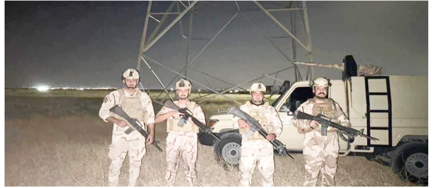
تأمين: قوات أمنية تؤمن أبراج الكهرباء.

ديالى - سلام الشمري كشف مصدر امني في محافظة ديالى ، عن استكمال المرحلة الأخيرة من خطة امن الكهرباء في المحافظة ، مشيرة الى ان البات تامين خطوط الكهرباء ستكون في وضع افضل.