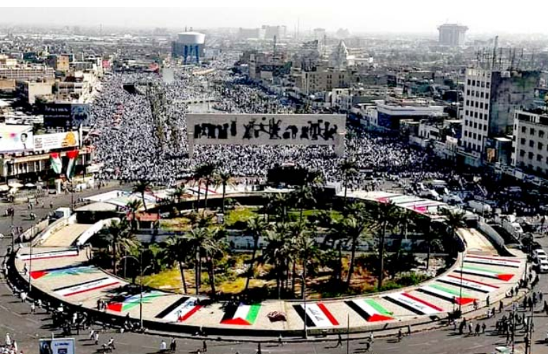
مليونية: تظاهرة مليونية عقب صلاة الجمعة الموحدة لنصرة فلسطين في ساحة التحرير