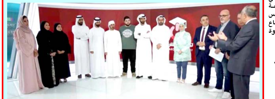
دورة لأكاديمية الشرقية للإعلام في دبي تقام دروس تطبيقية في صياغة عناوين الأخبار ومعايير الخبر الرصين

بغداد - إتهال العربي شكا مواطنون من إخفاق تحويل الدولار عبر نظام ويسترن يونيون إلى نوبهم في الخارج. بعدما قرر البنك المركزي إغتماده للتحويلات الخارجية بسقف مالي محدد، فيما أكدوا أن الخدمة تستنزف جيوب المواطنين نظراً لارتفاع عمولة دول. وفي بعض الأحيان يتسبب تحويل الدولار في إمتعاض المواطنين عند التحويل لنوبهم في الخارج حيث لايسمح برفع القيمة المحولة عن الف و500 دولار. وفي بعض الأحيان يتسبب تحويل الدولار في إمتعاض المواطنين، وبالتالي أن أغلب نوبهم الموجودين في الخارج لديهم نفقات أما للعلاج أو الدراسة أو لدفع قيمة إيجار المنزل، وبالتالي لايسمح برفع قيمة تحويل الدولار في العراق إلى الدولار، كون النظام لايسمح بتحويل أكثر من المبلغ