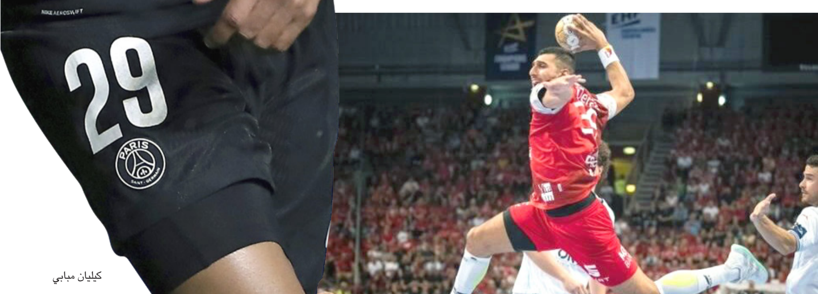
بطولة: الدرغ خلال إحدى بطولات كرة اليد

المحترفين للموسم الحالي 2023-2023. وتقدم المارد الأحمر مع نهاية أحداث الشوط الأول 5-1، قبل أن يعزز تفوقه خلال الشوط الثاني من المباراة التي أقيمت مساء أمس، على التي أقيمت مساء أمس، على صالة محمد حسن حلمي زامورا بمبعت عقبة، يتلك النتيجة، رفع الزمالك رصيده إلى 20 نقطة، ليواصل احتلاله للمركز الثالث بجداول ترتيب المرحلة الأولى، فيما تجدد رصيد الزهور عند 9 نقاط في المركز التاسع، ويلعب فريق اليد بالزمالك في المباراة المقبلة ضد العيور يوم الجمعة المقبل، في حين يواجه الزهور منافسه المعادي في اليوم نفسه، الجدير بالذكر أن الأهلي هو حامل لقب النسخة الأخيرة من دوري المحترفين لكرة اليد، بعد منافسه قوية مع غريمه التقليدي الزمالك.