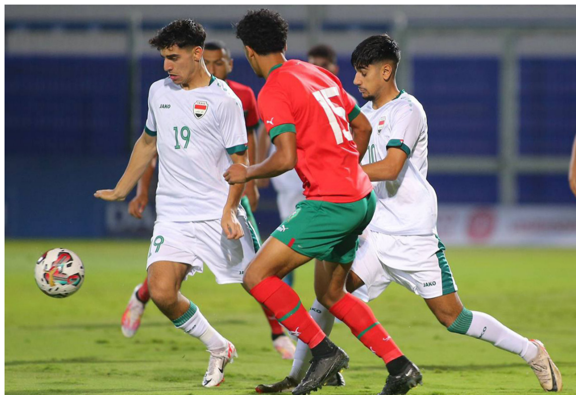
فوز المنتخب الأولمبي يحقق الفوز على نظيره المغربي

هدف واحد في المباراة الأخيرة ضمن تصفيات المجموعة السابعة لتصفيات كأس العالم لكرة القدم في قطر 2022، حيث تغلب المنتخب الأولمبي على نظيره المغربي بهدفين لهدف. وكان المنتخب الأولمبي قد حقق الفوز على نظيره المغربي بهدفين لهدف في المباراة الأولى من التصفيات.