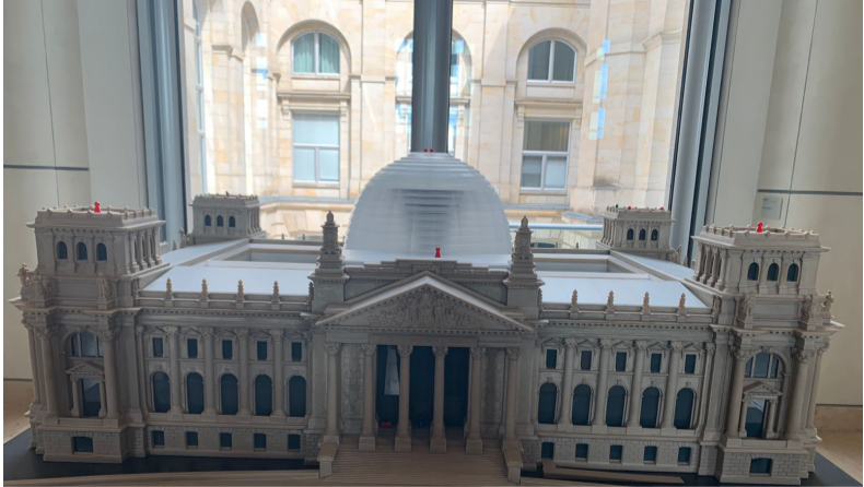
مجمع قبة البرلمان الألماني بارزة في مجسم

طلب ان يراه في ساعة احتضاره الا انه توفي قبل وصوله أصبحت فكره لسدى زوجة المتوفى « تانيا » ان يجتمع شمل الأصدقاء مجدداً لإحياء ذكرى زوجها و اعادة عائلته القديمة في اللقاء لأنها كانت زميلة معهم في الكلية ايضا ، وهكذا قسمت الرواية حسب احداثها و صفحاتها ال(555) إلى سبعة عشر فصل عنوانها الروائي بابام وجوده في لبنان بعد عودته من فرنسا (اليوم الأول ، اليوم الثاني ، وهكذا الى اليوم السادس عشر) ليتلق بنا معلوف طيلة هذه الأيام الروائية بين اصقاع العالم ومدن لبنان و بيروت و مختلف الأراء والحوارات و النقاشات حول موضوع العرب والدين والانزباب والفكر والحرب والاب والجنس إلى غير ذلك من الموضوعات ، انتهت