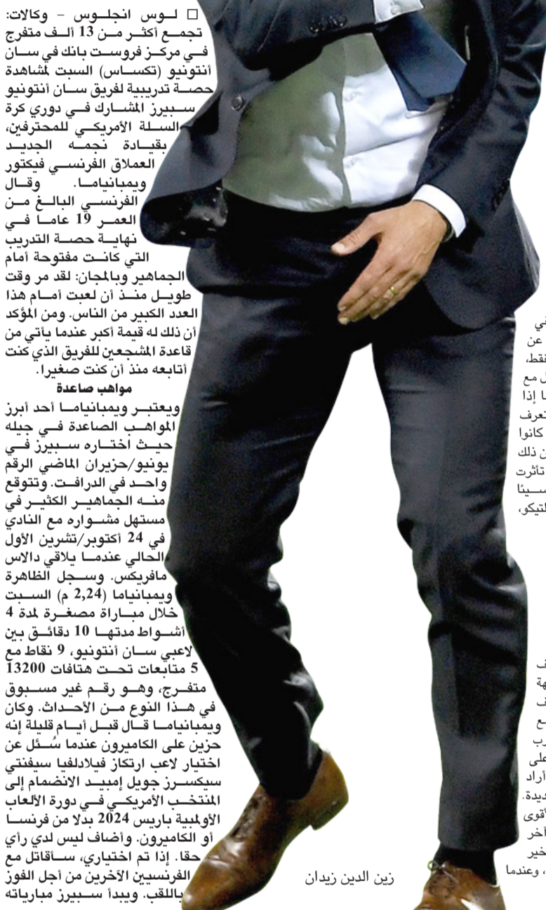
زين الدين زيدان

ويعتبر ويمبانيا ما أحد أبرز المواهب الصاعدة في جيله المحارب للألعاب في جيله حيث اختاره سبيرز في يونيو/حزيران الماضي الرقم واحد في الـرافت، وتتوقع منه الجماهير الكثير في مستهل مشواره مع النادي في 24 أكتوبر/تشرين الأول الحالي عندما يلقي بالاس مافريتا وسجل الظاهرة ويمبانيا ما (2,24 م) السبت خلال مسابقة مصغرة لمدة 4 أشواط مدتها 10 دقائق بين لاعبي سان أنتونيو، 9 نقاط مع 5 متابعات تحت هتافات 13200 متفرج، وهو رقم غير مسبوق في هذا النوع من الأحداث، وكان ويمبانيا ما قبل إسمه قبله إنه حزين على الكامريون عندما سُئل عن اختيار لاعب ارتكاز فيلارلينا سيفيتي سيكسز جويل إيميد الانضمام إلى المنتخب الأمريكي في دورة الألعاب الأولمبية باريس 2024 بدلاً من فرنسا أو الكاميرون. وأضاف ليس لدي رأي حقاً، إذا تم اختيار، ساقابل مع الفرنسيين الآخرين من أجل الفوز باللقب، ويبدأ سبيرز مبارياته