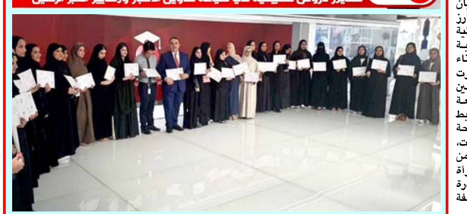
دورة لأكاديمية الشرقية للإعلام في دبي تقام دروس تطبيقية في صياغة عناوين الأخبار ومعايير الخبر الرصين

مصرع شخصين بسقوط مجسر فوق مركبتهما العمارة - علي قاسم الكبجي لقي شخصان مصرعاً في محافظة ميسان، بعد انهيار مجسر قيد الإنشاء فوق مركبتهما. وقال شهود عيان أن أعمدة مجسر قيد الإنشاء في فلكة ناحية المشرع بالمحافظة، سقطت، على مركبة نوع بيك اب، مما أدى إلى وفات شخصين بداخلها). فيما يأمل أهالي بغداد، عدم تكرار حادثة مماثلة في مجسرات فلكة الاختناقات، ويدعون الوزارة إلى ضبط الأعمال والتأكد من سلامة إجراءاتها. ونفذت مفازر الأمن الوطني في محافظة النجف، عملية نوعية أطاحت بعصابة