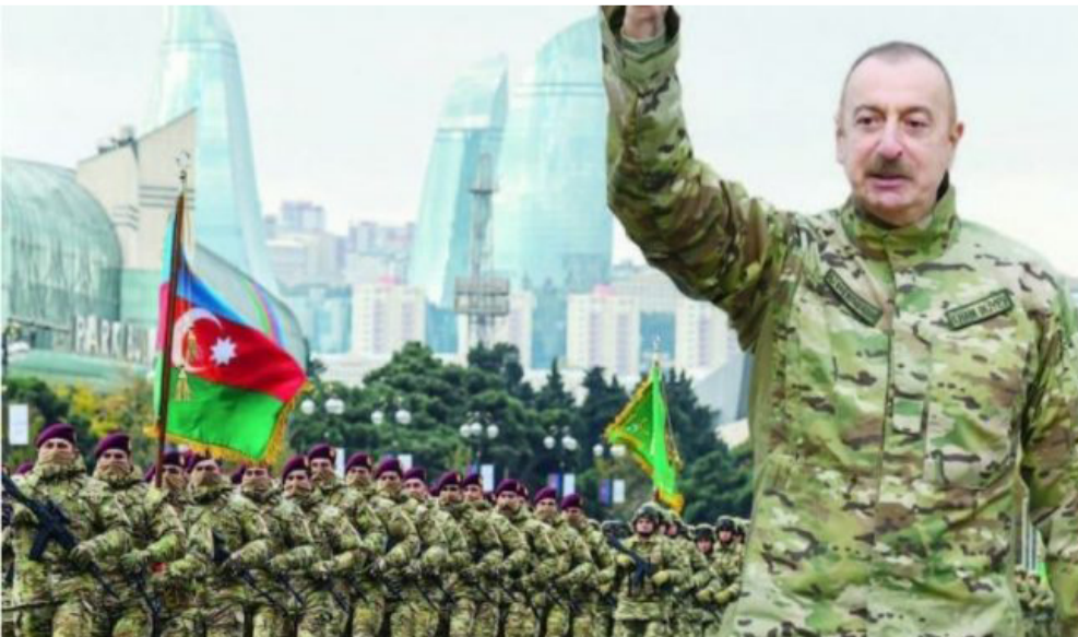
اهياء استعراض عسكري لاجياى الذكرى الثالثة للحرب الوطنية في جمهورية أذربيجان

احتفلت جمهورية أذربيجان يوم 27 سبتمبر - أبول، الذكرى الثالثة للحرب الوطنية، التي تمكن خلالها الجيش الأذربيجاني من تحقيق الانتصار التام على الأذربيجان عام 2020. بقيادة القائد الأعلى للقوات المسلحة، فخامة رئيس جمهورية أذربيجان، السيد إلهام علييف، وتم استرجاع إقليم كاراباخ الذي احتل منذ حوالي 30 سنة، من طرف أرمينيا، خلال 44 يوما من الحرب، والتي عُرفت عند الأذربيجانيين في السابق بتبدل أذربيجان قسارى جهدها لإحلال السلام في منطقة القوقاز.