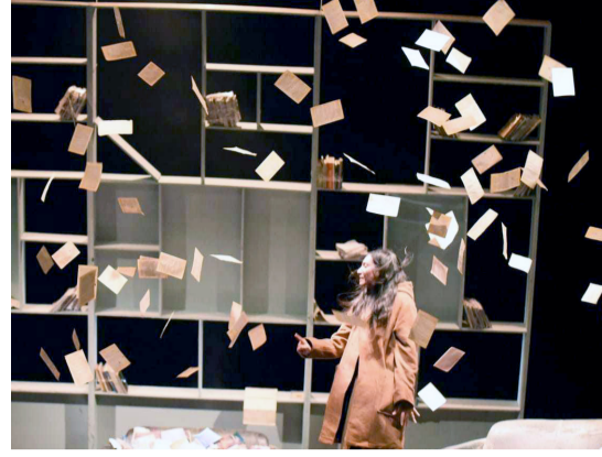
مهرجان؛ لقطات من عروض مهرجان بغداد الدولي للمسرح