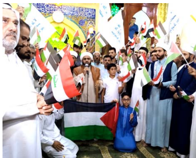
أعلام: مصليون وسط جامع في الفلوجة يحملون الاعلام العراقية والفلسطينية

العام لمنظمة بدر هادي العامري، ورئيس المكتب السياسي لحركة حماس إسماعيل هنية، في اتصال فلسطيني أمام الاحتفال الصهيوني. وقال العامري خلال الاتصال إن (ما حققته المقاومة الفلسطينية، هو وسام فخر واعتزاز وعز لكل المقاومين والجهاديين ومحبي القضية الفلسطينية في المنطقة، وماقمت به أثلج قلوب المجمع وأدخل السرور والأمل إلى قلوب كل محبي القدس والقضية الفلسطينية في العالم، فقد بيضتم وجوهنا، ونسال الله أن يبيض وجوهكم يوم تسود الوجوه). وكان رئيس الوزراء محمد شياع