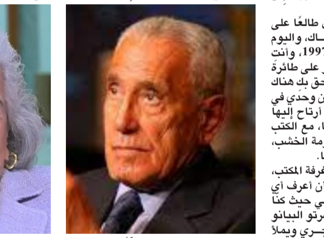
محمد حسين هيكل