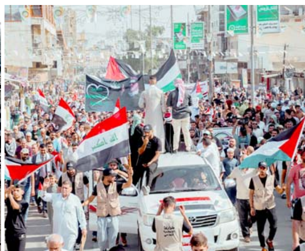
مسيرة: أهالي الأعظمية يخرجون مسيرة تضامنية مع غزة

السوداني، قد أوعز، بإرسال مساعدات إنسانية إلى قطاع غزة المحاصر. وقال المتحدث الرسمي باسم الحكومة باسم العواد في بيان أنه (تأكدوا لوقوف العراق النابتة والمبدئية من القضية الفلسطينية، ووجه السودان، بإرسال مساعدات إنسانية إلى قطاع غزة المحاصر من قبل قوات الاحتلال الصهيوني). تفاصيل ص 4