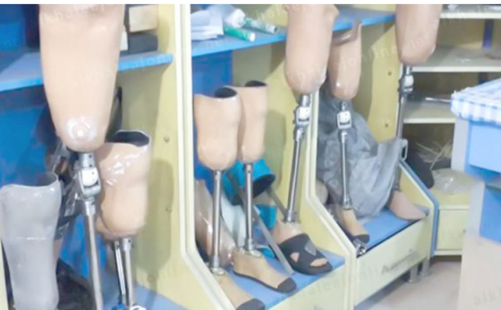
فعالياً: مخيم إصرار للأطراف الصناعية