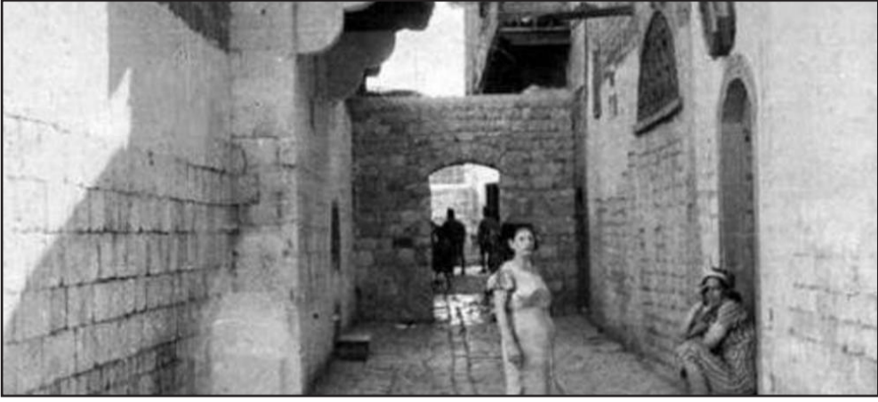
أحدى أزقة البغيا في بغداد

بحقيقتها. ولقد اكتشفت ان عالم البغاء غريب بمفاجاته. وان العوز او تردى الوضع الاقتصادي ما كان هو السبب الرئيس لعدد كبير من البغايا. وأن له بعدا سياسيا.. وان وظيفة بعض الملاهي في بغداد كانت اصطفا الفتيات الجميلات لسياسيين واصحاب وظائف كبيرة بعضهم بعيد عن الشهية.. فضلا عن زوجات كان ازواج بعضهم لا يشيعون حاجتهم للجنس.. وبالمناسبة، كانت نسبة المتزوجات بين البغايا 58 بالمائة مقابل 42 بالمائة بين مطلقة وارملة وغير متزوجة. ليس هذا فقط بل ان بيدهن من اطعنتي على اسرار لو شفتها في حينه لانهجت بيوت عوائل شريفة. وكتمتها، وتلك هي مهمة الباحث العلمي، ان يحافظ على اسرار عينات بحثه وان كانت بغايا وسمسيرات. كانت حياة كل واحدة منهن تصلح دراما حقيقية لو يتنجها التلفزيون العراقي الآن لاشتراها منه أكثر من تلفزيون عربي، لدينا قصة احداهن.. سنكتشفون.