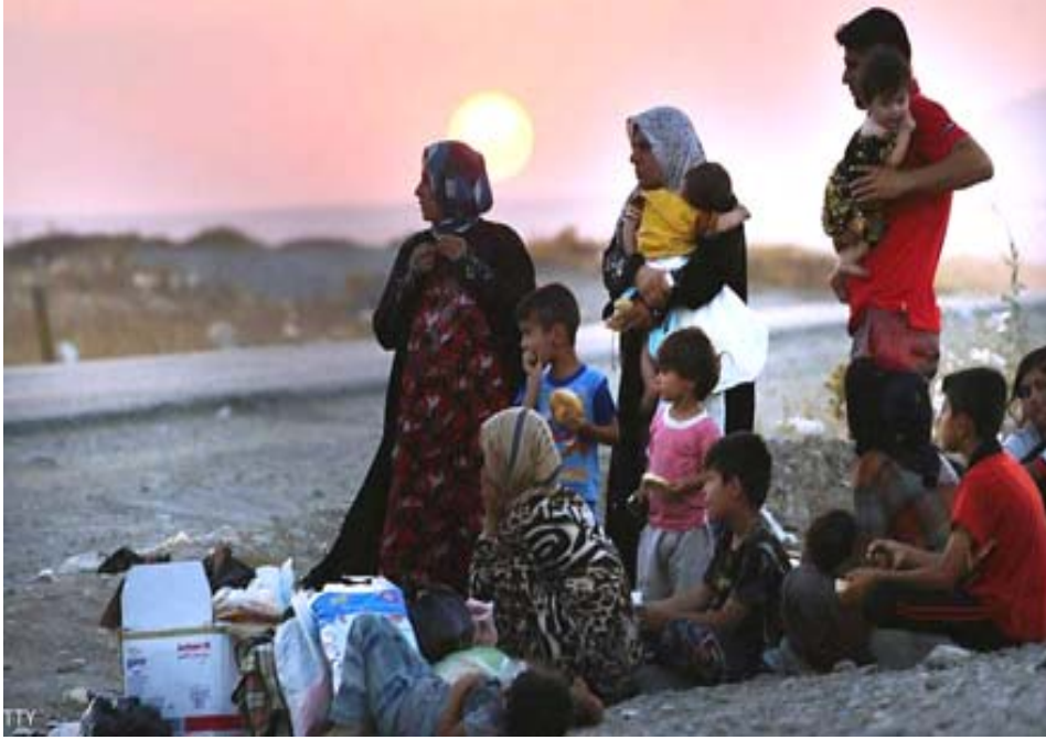
نازحون في مخيم شمال العراق

مناطقهم في نينوى، إضافة إلى أن النازحين يعنون وفقاً لرغبتهم ويشكل طوعي ولا أحد يستطيع إجبارهم على ترك المخيم). موضحة أن (232 نازحاً غادر مخيمات الخازن وحسن شام وعادوا إلى مناطقهم الأصلية في مدينة الموصل). وبينت أن (مخيم الخازن شهد عودة 141 نازحاً إلى مناطقهم الأصلية، فيما شهد مخيم حسن شام 113 عودة 68 نازحاً، وكان مخيم حسن شام 12 شهد عودة 23 نازحاً).