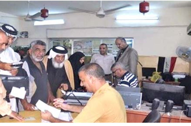
مراجعون لهيئة الحماية الاجتماعية

بغداد - الزمان إنجزت أسس الحماية الاجتماعية في بغداد والمحافظات المعاملات المراجعية المستفيدين من رواتب الإعانة الاجتماعية في جميع المحافظات عدا التي استمر تطبيق حظر التجوال