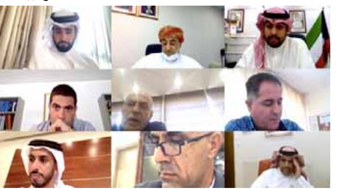
مؤتمر اتحاد غرب آسيا