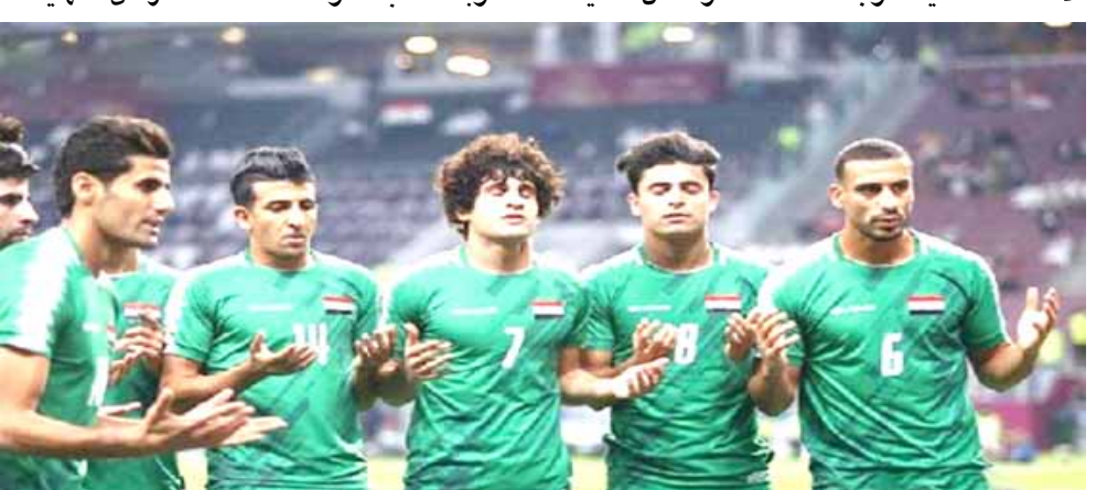
لاعبون من فريق المنتخب الوطني

بغداد- الزمان تواجه اللجنة التطبيقية في الاتحاد العراقي لكرة القدم ضائقة مالية كبيرة بسبب الظروف التي تشهدها البلاد في ظل الازمة الاقتصادية وجائحة