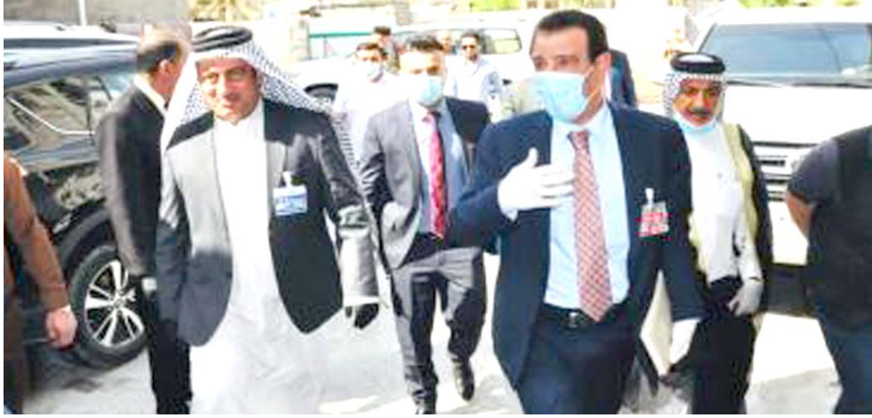
زيارة : وزير الزراعة محمد كريم الخفاجي يزور مقر الاتحاد العام للجمعيات الفلاحية في بغداد

يسمى بلد النخيل ويجب المحافظة على الإنتاج الوطني لتحقيق الأمن الغذائي الذي يوازي الأمن الوطني. زار وزير الزراعة محمد كريم الخفاجي مقر الاتحاد العام للجمعيات الفلاحية في بغداد خلال جولته الأولى بعد تسنمه مهام عمله في الوزارة. وأكد الخفاجي خلال زيارته أهمية الدور الكبير الذي تقوم به الجمعيات الفلاحية في مسيرة القطاع الزراعي مضمناً جهودها في دفع عجلة تطور وتقديم العملية الزراعية في البلد.