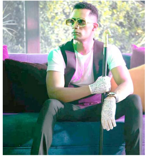
محمد رمضان يرتدي نظارة مرصعة بالماس

فايروس) منذ يومين، وكعادته حطم الأرقام القياسية في نسبة المشاهدة التي تجاوزت الـ 5 ملايين في ثلاثة أيام، إلا أن أكثر من لفت إنتباه الجمهور هذه المرة كان تفاصيل إطلاقه لرمضان في الكليب، وتحديدا إرتدائه لمرصعة باللون الذهبي ارتدى ففازات مرصعة أيضا، إضافة لإرتدائه الملابس الوضائية ضد كورونا.