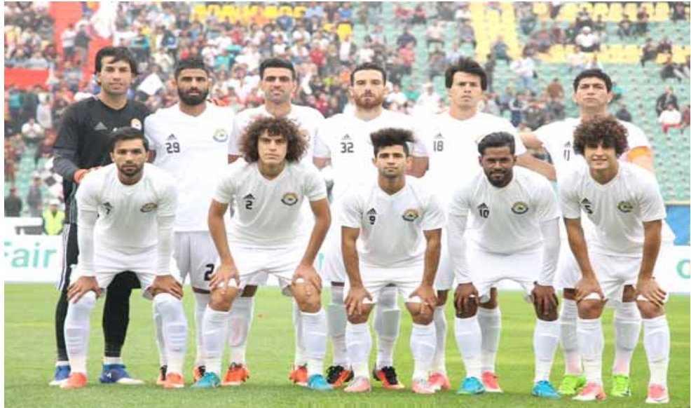
طاقم، فريق الزوراء بكامل طاقمه

لكن مهم ان تتدبر ادارته الامور وان تتخذ الاجراءات الفنية من هذه الاوقات لغرض دخول الموسم القادم في مهمة التعويض عن الذي حصل في موسم غير مقنع وبسبب ان تبسحت الادارة مع الجهاز الفني الامور الفنية من الجوانب لان مشاركة الزوراء تختلف عنها عن بقية الفرق لما يريده جمهوره الكبير المعروف الاكثر شعبية في العراق كذلك على مستوى العالم كما حصل في استفتاء جريدة ماركا الاسبانية كخائن افضل جمهور من بين اربعين ناد يدورنا ان تتمتع الفرق الكبيرة بقدرات فنية ومالية حتى تاتي مشاركتها المختلفة على المستوى المطلوب لانه فريق عريق وكبير ويحق انه صاحب اكثر الاقبا الملية. وتمنى احد مشجعي الفريق في ان تحضى فرق الدوري باهتمام حكومي من خلال الجهات الراعية حتى لا يتلقى تعاني كما كان عليه الزوراء في الموسم الاخير واتمنى على الادارة ان تعمل ما يوسعها لاعداد فريق قادر على المنافسات المحلية والعودة لحصد الاقبا وهو المهم ولان الفريق يحتاج الى الكثير من الدعم حتى يقوم بدوره.