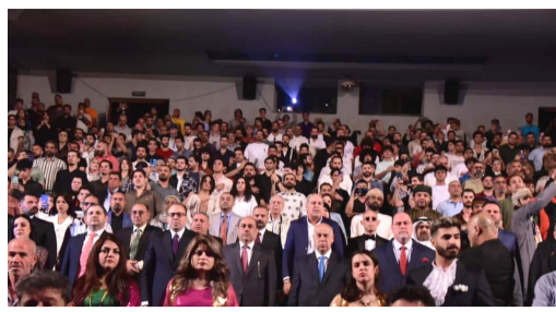
مهرجان: لقطات من حفل افتتاح مهرجان بغداد الدولي للمسرح