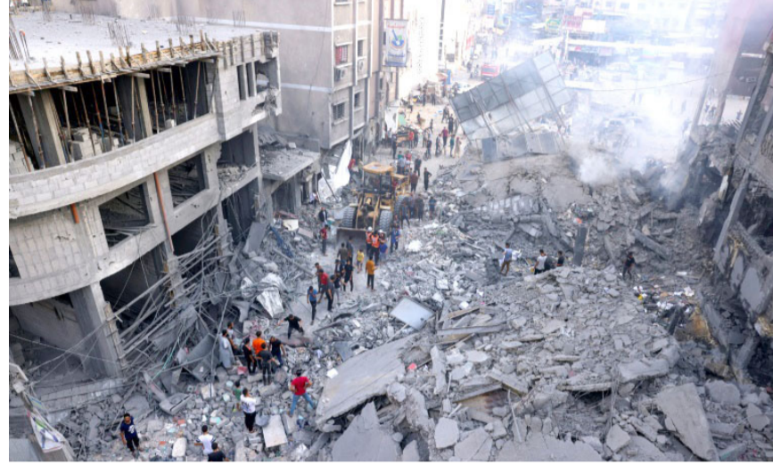
قصف: ركاب المبانى في غزة بعد قصف إسرائيلي

الوحيد)، مشددا على القول أن (حل الدولتين فقط سينتهي دوامات القتل التي يدفع ثمنها الأبرياء)، ولفت إلى أن (الأردن لن يتخلى عن دوره في الحفاظ على المقدسات الإسلامية والمسيحية في القدس وهما بلغت التحديتات). وشارك آلاف الأردنيين في تظاهرات وسط العاصمة عمان، تأييدا لهجوم حماس على إسرائيل، رافعين رايات فلسطينية ولافتات دعم للمقاومة، وخرج أكثر من أربعة آلاف شخص، وفق تقديرات مصادر أمنية، في تظاهرة حمل المظاهرات خلالها (اعلاما فلسطينية واردنية اولفتات كتب على بعضها لن نترككم وحكم في المعركة ومع المقاومة وخياراتها). ووصل بليكن إلى الأردن خلال جولة شرق أوسطية بدأت أمس وتنتهي