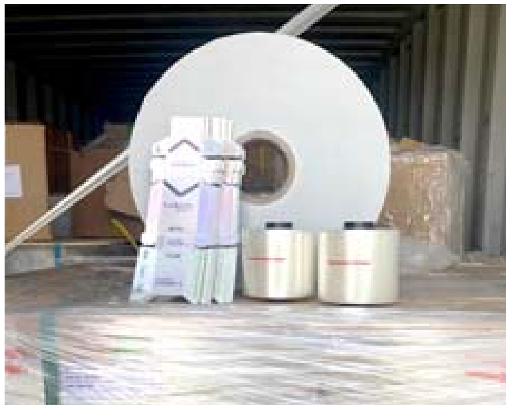
ضبط : الهيئة العامة للكمارك تضبط حاوية فيها مواد اولية لصناعة السكاكر

اسفرت العملية عن مقتل 4 إرهابيين، إثنان منهم يرتديان أحزمة ناسفة ويحملان رمايات يدوية وتدمير وكربن يحتويان على فرش و مواد غذائية والإستيلاء على عجلة نوع بيكبي ودراجة نارية، كما تم التعامل مع المواد المضبوطة أصوليا.