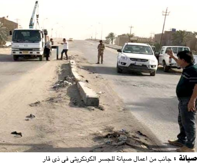
صيانة : جانب من اعمال صيانة للجسر الكونكريتي في ذي قار