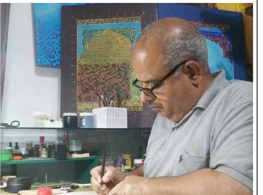
الحرف العربي غداء روحي

الخط العربي هو الأجل، هل لك أن تحدثنا عنها؟ البدايات كانت بسيطة ضمن عملي حين كنت طالبا في الاعدادية، أغراني الخط الذي تعلمته عند الأستاذ الخطاط عبد الستار الغراوي، وبعد اكتمال دراستي الاعدادية لم يسعني الحظ في الدخول إلى أكاديمية الفنون الجميلة، توجهت إلى دراستي في معمل