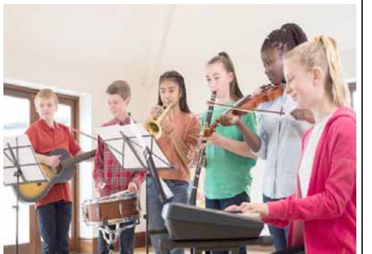
فرقة اوروبية من الشباب

كثيرة هي الدراسات والبحوث التي لم تنجح في اثبات صحة ما طرحه الكاتب والشاعر الأمريكي الشهير (هنري لونغفيلو) في نظريته قبل مايقارب المئتي عام على أن اللغة الموسيقية عالمية، فضلاً عن أنه لم يعتمد الأفكار والأسس الصلدة، وبقيت نظريته رغم مرور الوقت عليها حبيسة الأوراق لانتفاء امكانية تطبيقها على ارض الواقع، ورغم أننا لا ننكر امكانيات الموسيقى بمد جسور التواصل وعبورها للحدود والأخبار بما لا تخمك منه كل لغات العالم، فالاستماع مثلاً: إلى موسيقى "ديبوسي" لا يحتاج لإجادة الفرنسية، والغبطة لسماع