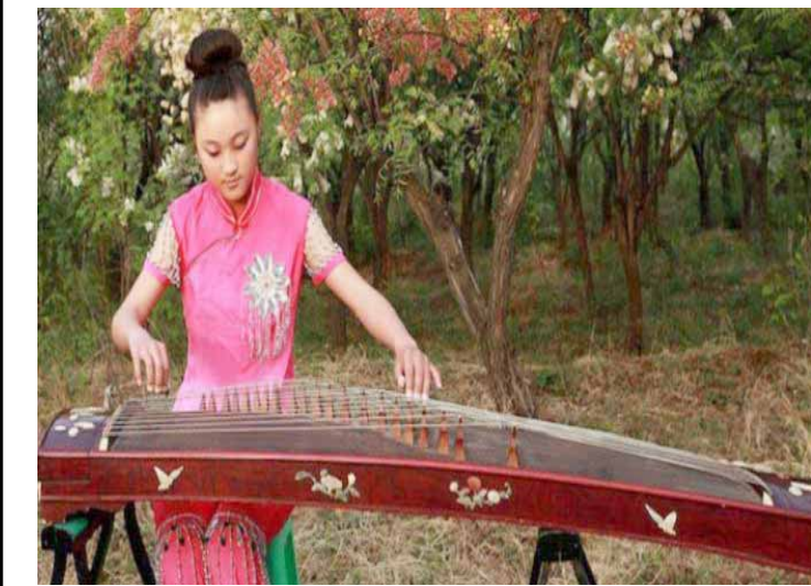
عازفة آلة يابانية

الى ذروة الانفعال وبحسب ما يطلبه المؤلف من تعابير، وتفي بآداء الإيقاع الآ واحد (التمباني) كآلة أساسية تسندها كما سلفنا جميع الآلات الأوركستراية (الهوائية والوترية)، ان هذه النقة والتعقيد في استخدام الإيقاع للموسيقى الغربية جعلت منه مصدر ذوقي وجمالي ذو تأثير مباشر على الخلق، كما يتفاعل الإيقاع بدوره في بناء العمل مع العناصر التكوينية الأخرى ليكون ركن من أركان بناء الفكرة وتطورها ونموها داخل العمل، لأجل صياغة التلوين والتنويع الجمالي التعبيري الفلسفي.