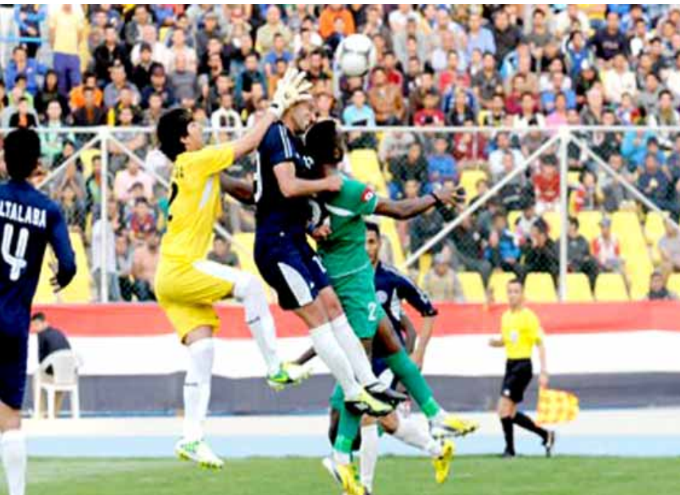
أزمة: جانب من احدى مباريات دوري الكرة فيما الأندية ترفض الاستئناف جراء أزمة جائحة كورونا

علاج بدايته المتذبذبة في خسارتين وتجاوز الأزمة، ونجح النجف بالفوز في مباراتين وتعادل بطلهما للقف الرابع بثمانية نقاط ومن نون خسارة ويبدو أن الفريق تجاوز مشاكله، ولعب الزوراء ثلاث مباريات حقق الفوز مرتين على الطالبروك والكهرباء وتعادل مع الأمانة قادته للموقع الخامس. وتضمن الطلاب من تدارك البداية المخيبة قبل تحقيق الفوز مرتين على الصناعات ونقط ميسان والتعادل مع النجف وتجرع خسارتي الغربيين الزوراء والجوية استقطعت سداسا بسبع نقاط ولعب الميناء أربع مواجهات نجح مرتين وتعادل في واحدة وخسر لقاء واحدا وجمع سبع نقاط سابع الموقف وقدم نفسه بقوة ووضوح امام الحدود لعب أربع مباريات ليحقق ثامنا بست نقاط من فوزين على ابراهيمما على الوسط وخسارتين في المركز الثامن، ومشاركة ثمانية لاربعة بعدما خسر ثلاث مباريات من مجموع خمس