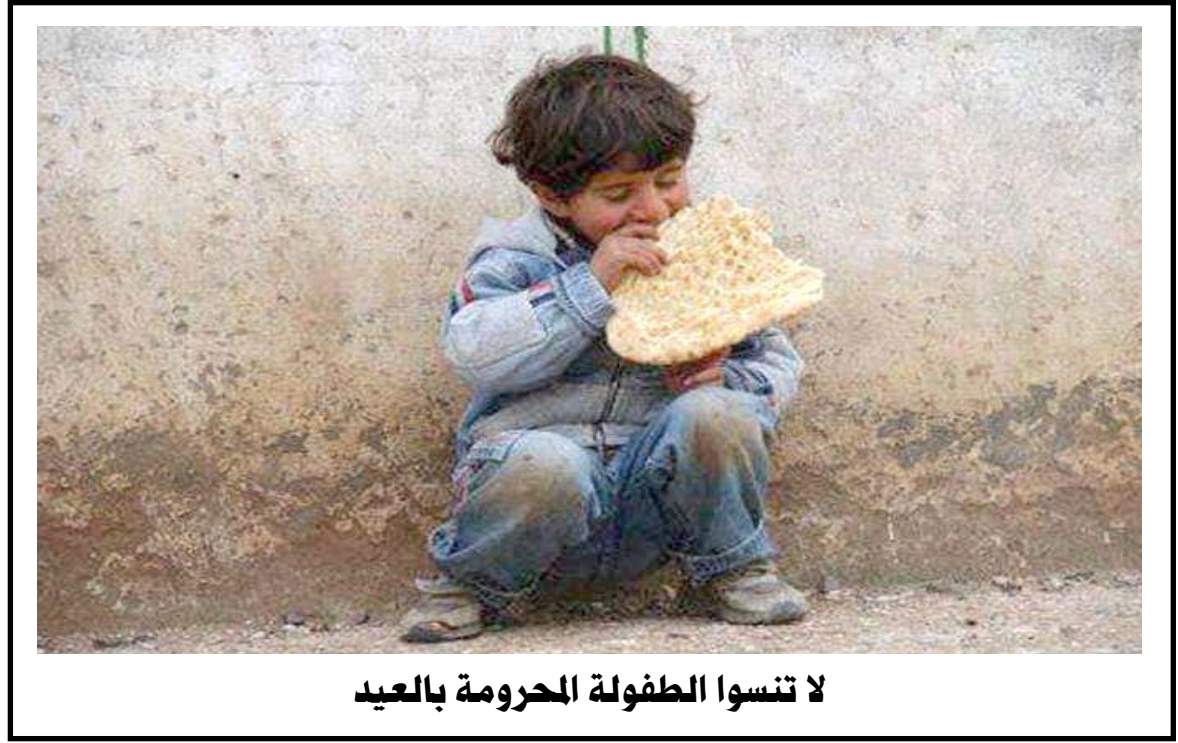
لا تنسوا الطفولة المحرومة بالعيد

المشكلة التي اصبحت تترقب الاسر مع ارتفاع درجات الحرارة خلال الصيف الالهب وحجرهم في منازلهم بسبب تفشي فايروس كورونا، و اشاروا الى ان (ساعات التحجير المواطنين بتتبار المنظومة الوطنية هو الاسوأ منذ اعوام، ولا شك ان هناك جهات تحاول استهداف قطاع الطاقة من خلال عمليات تخريبية لاشغال الحكومة في اول اختبار لها خلال موسم الصيف)، مؤكدا ان (المشاريع الوهمية التي اهدرت عليها