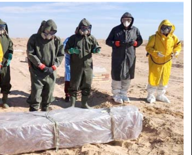
دفن ملاكات صحية تقوم بدفن عدد من متشي كورونا في مقبرة جديدة بالنجف

كورونا، الليلة قبل الماضية في مقبرة وادي السلام الجديدة بالنجف، وهم من الديانة المسيحية بعد فرز مقبرة خاصة لهم. وبين الحميدي أن (العدد الكلي لجمع من تم دفنهم حتى الان في هذه المقبرة مبلغ 96