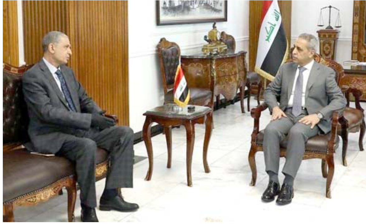
استقبال: رئيس مجلس القضاء الاعلى فائق زيدان خلال استقباله وزير الداخلية عثمان الغانمي