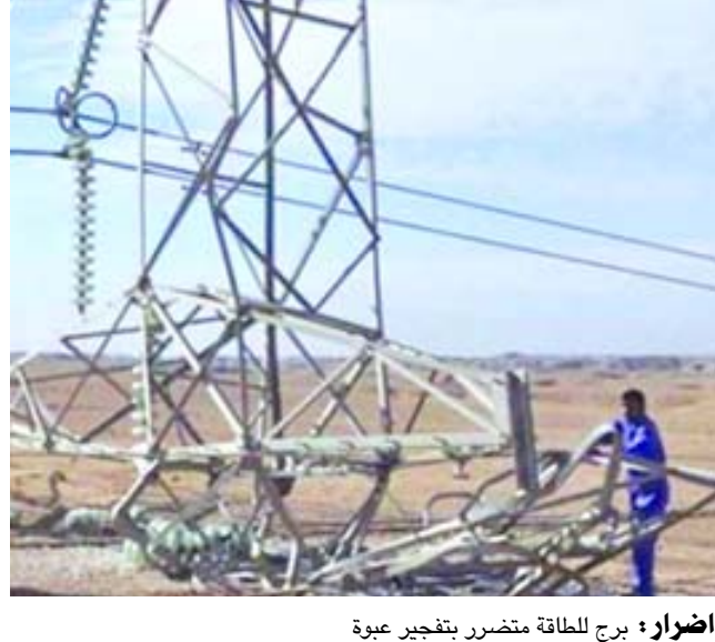
اضرار: برج للطاقة متضرر بتفجير عبوة

ديالى - سلام الشمري أعلنت قيادة شرطة ديالى، عن إلغاء 50 بالمئة من سيطرات بعقوبة الامنية لتحقيق 3 اهداف.