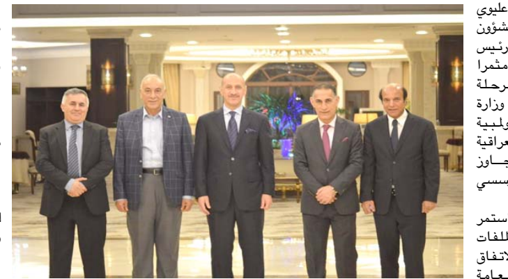
لقاء: درجال يستقبل رئيس اللجنة الأولبية ويبحث المشاكل بين المؤسستين

جرف رياضة الانجاز. من جانب اخر استعرض وزير الشباب والرياضة مع مديرى الشباب والرياضة في بغداد والمحافظات قانون نقل الصلاحيات الى مجالس المحافظات، والاستثمارات في الأندية والمنتديات الشبابية، وبناء الشباب وفق اطر واليات جديدة تمنح الامل لهم وبناء وطنهم وتقدمه واستقراره.