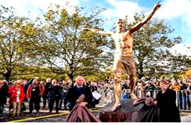
تمثال إبراهيموفيتش في مدينة مالو السويدية

الماضي لإصلاحه بعد قطع الساقين. وتعرض التمثال للعديد من عمليات التخريب منذ تشرين الثاني الماضي، بعدما أعلن إبراهيموفيتش عن اعتزازه شراء حصة في اسهم نادي هاماربي بالعاصمة ستوكهولم، ما أثار ردود فعل غاضبة لدى مشجعي مالو، الذي بدأ فيه إبراهيموفيتش مسيرته الكروية. وفي كانون الأول الماضي، تم قطع جزء من أنف التمثال، كما تم تخطية هذا التمثال الذهبي بطلاء