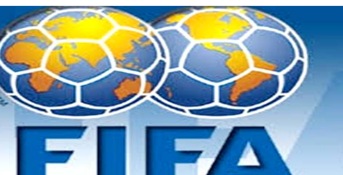
شعار الاتحاد الدولي لكرة القدم

زيورخ - وكالات أعلن الاتحاد الدولي لكرة القدم "الفيفا" اول امس الاثنين، عزمه إقامة