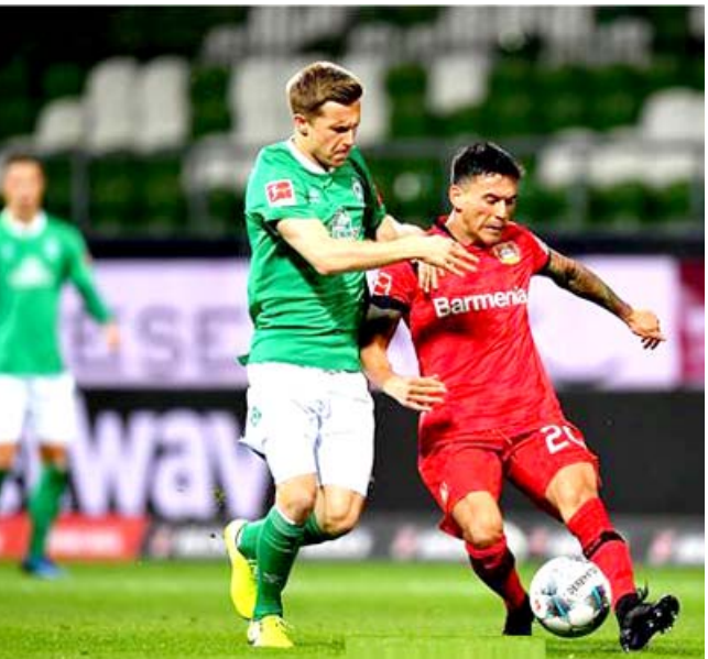
لقطة من مباراة ليفركوزن وبريمن في الدوري الالمانى

برلين - وكالات اكتمح باير ليفركوزن مضيفه فيررد بريمن 4 - 1 اول امس الاثنين، في المرحلة السادسة والعشرين من دوري الدرجة الأولى الألماني لكرة القدم (بونديسليجا). وخاض الفريرقان اول مباراة لهم منذ توقف السدوري المحلي في منتصف آذار الماضي بفعل أزمة فيروس كورونا المستجد. وتقدم كاي هافيرتز بهدف للفريرقان في الدقيقة 28 لكن بعد دقيقتين فقط أدرك ثيوبور جيبير سيلاسى التعادل لبريمن. وعاد هافيرتز وسجل الهدف الثاني له والفريرقي في الدقيقة 33 لينتهي الشوط الاول بتقدم ليفركوزن بهدفين مقابل هدف. وأكد الفريق النضيف فوزه في الشوط الثاني عبر إضافة هدفين حملاً توقيع ميتشيل فايزر وكريم ديميرباي في الدقيقتين 61 و78. الفوز رفع رصيد ليفركوزن إلى 50 نقطة في المركز الخامس بفارق نقطة واحدة عن المركز الرابع المؤهل لدوري ابطال المستنجد (كوفيد-19) تم