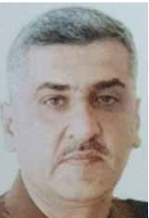
عدنان محمد الحردان

نحن لفيف من ذوي المفقودين والشهداء والجرحى نتقدم بخالص الشكر والامتنان والتقدير للسيد اللواء الركن المهندس عدنان محمد الحردان مدير مديرية الخدمات الشخصية ورعاية المقاتلين لاستقباله للمراجعين بدون موعد مسبق والتشديد على منتسبين المديرية بإنجاز الاعمال بشكل تام وارشادنا للاجراءات الصحيحة وتقديم الخدمات اللازمة للمراجعين وتسهيل المعوقات امانا فهو بحق الرجل المناسب في المكان المناسب وفق الله السيد اللواء عدنان محمد والله ولي التوفيق.