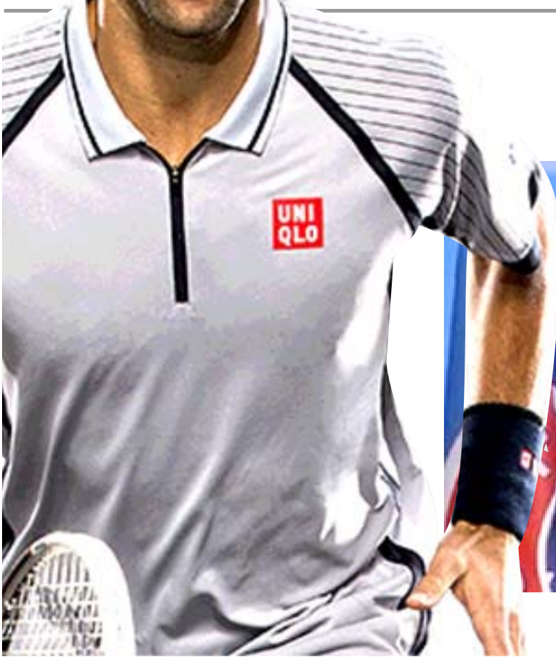
لاعب التنس نونفانك ديوكوفيتش

□ باريس- وكالات: يعتقد نونفانك ديوكوفيتش أنه سيفوز بأكثر عدد من القاب بطولات الخشن الأربعة الكبرى وسيصبح اللاعب الذي يقضي أطول فترة على قمة التصنيف العالمي بحلول وقت اعتزاله. ويمتلك اللاعب الصربي (32 عاماً) المصنف الأول الحالي 17 لقباً في البطولات الكبرى بفرق لقبين عن رفايل نادال وثلاثة عن روجر فيدرر، وقال لا يساوره أي شك في قدرته على تجاوزهما. وقال ديوكوفيتش في مقابلة تلفزيونية مع قناة إيه إن إن: "أؤمن بوجود حدود لقدرات المرء، اعتقد أن الحدود هي مجرد أوامير يصنعها غرور أو ذكاء، ومنذ فترة ليست بعيدة كان لديوكوفيتش نظرة مختلفة تماماً للثمن، وبعد الخسارة بمجموعتين متتاليتين أمام بنوا بير غير المصنف في بطولة ميامي المفتوحة عام 2018 قالت أيلينا زوجة ديوكوفيتش إن اللاعب الصربي كان مستعداً للاعتزال. وقالت في المقابلة قال إنه سيعتزل وكان هذا حقيقياً. لقد خسرت في ميامي، كانت هزيمة مروعة. بعدها قال لنا تعلمون