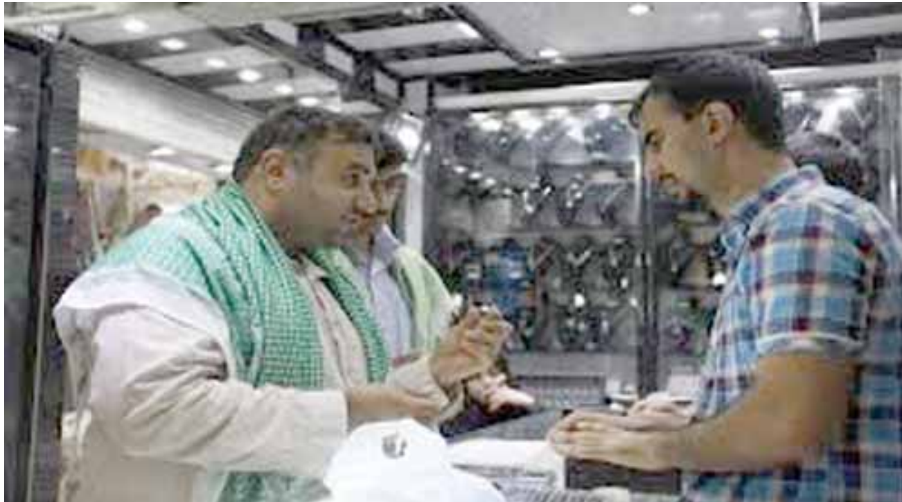
مواطنون في محل لبيع المجوهرات

وعلى صعيدنا المحلي فمادما قدمت الجهات المسؤولة لنا فمياه الشرب أسنة ولونها بني من الاتربة وغير معقمة ومع هذا لابد من دفع رسوم عليها والكهرباء مقطعة ولا ينعم بها المواطن اضافة الى اعتماده على المولدات ومع هذا خصصت الجهات المسؤولة تلك الكهرباء ومطلوب من المواطن الذي لا ينعم بها في الصيف ولا في الشتاء ولا يستطيع دائما ان يغتسل بالمياه الحارة