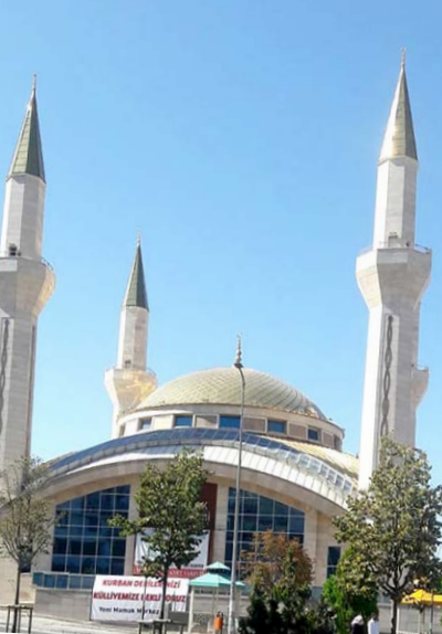
مسجد تركي في اشهر ضواحي أنقرة