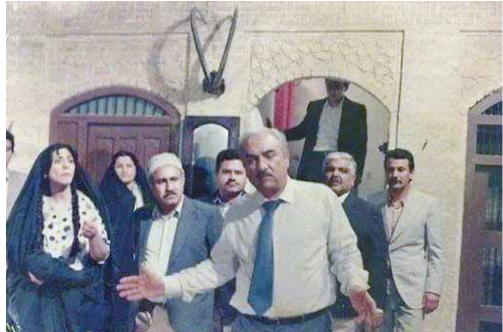
من اعمال الفنان سامي عبد الحميد

(بوشكين) وخريطة (رامبو) و (ادكار الن بو) و (سبزان) و (مونية) و (باخ) و كوونت مدينة اخرى احتوت كل هذه النداءات وكل ذلك الاثني من خلال متحف