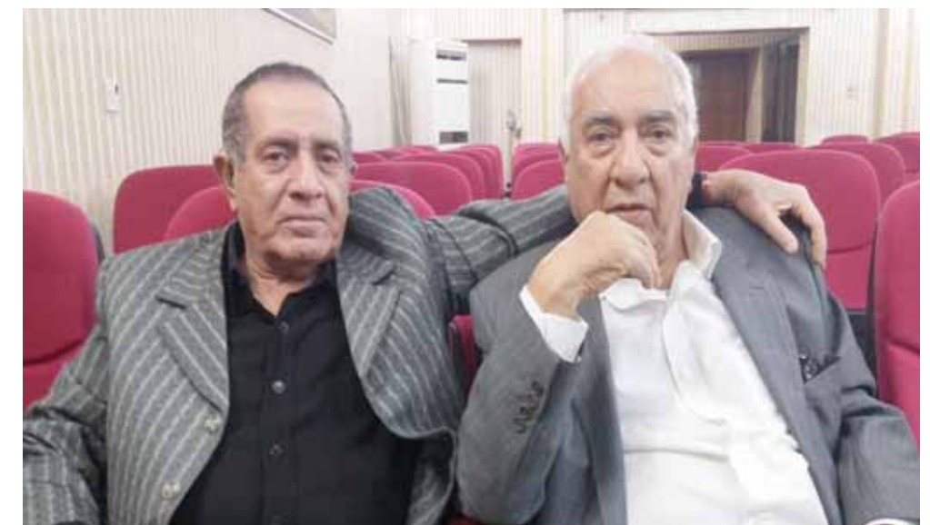
سامي عبد الحميد وصلاح القصب

هذا المتحف لو شيد سيضم اسمااء كبيرة، يضم اعمال وملايس (جواد سليم) وتخطيطات (جواد سليم)، ليس شرطاً تخطيطاته الاصلية حتى لو كانت مصورة ويطباعة حديثة، لا ضير اذا كنا لا نمتلك هذه المخطوطات والأدوات او لا نمتلك تلك المخلفات الثقافية.. تلك الشواهد الثقافية يمكن ان نبرهن الصحافة.. الرسائل المتبادلة.. صورته الارشيفية.. هذا المتحف سيخلد تلك الاسماء العظيمة التي كونت جغرافية