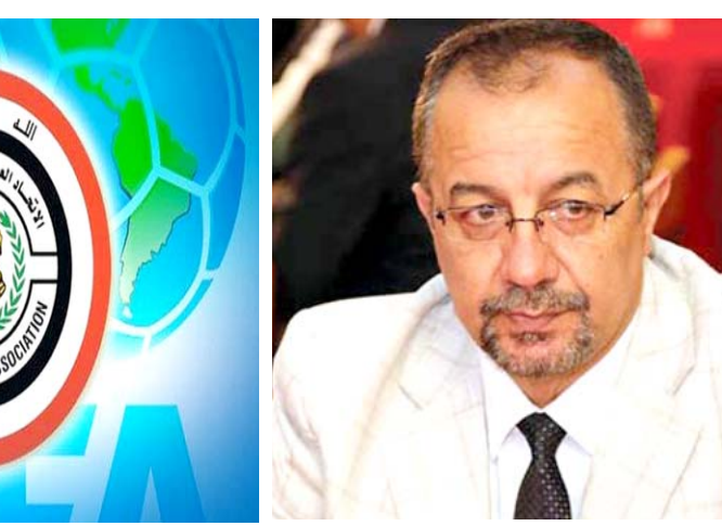
الاتحاد المركزي لكرة القدم