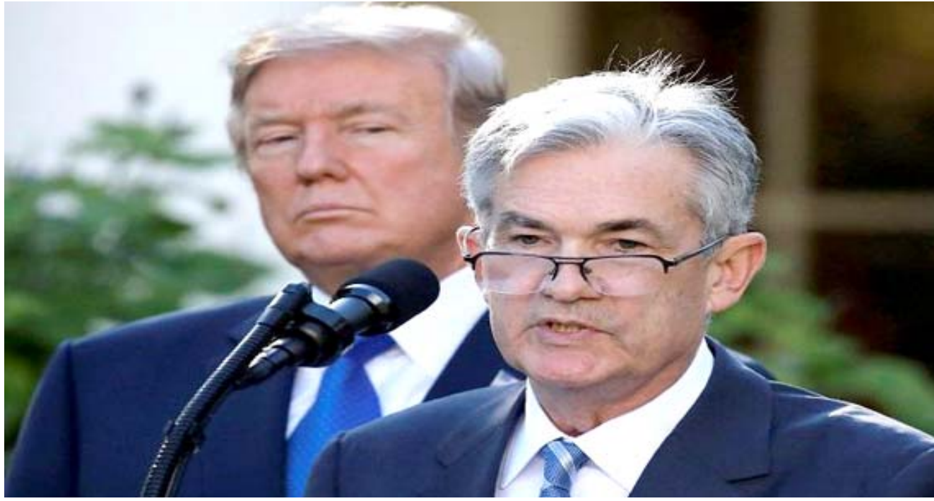
أزمة: رئيس الاحتياطي الفدرالي الأمريكي جيروم باول يتحدث عن الأزمة الاقتصادية الناجمة من تفشي كورونا ويظهر خلفه الرئيس الأمريكي دونالد ترامب

إلى هذه الأرقام، لم تعد الأزمة المالية تشكل مرجحاً للمقارنة إذ تخطتها أرقام 2020 بشكل كبير، ويتوجب بدلاً من ذلك العودة إلى أرقام كساد الثلاثينيات. وشهد الناتج المحلي الإجمالي للدولة ذات الاقتصاد الأول في العالم تراجعاً بنسبة 4.8% في الفصل الأول، وهو أقسى انخفاض منذ الفصل الرابع لعام 2008 (8.4%) وأودى كوفيد-19 بحياة نحو 73 ألف شخص في الولايات المتحدة، وأصاب ما يوازي 2.2 مليون شخص، بحسب تعداد لجامعة جونز هوبكنز.