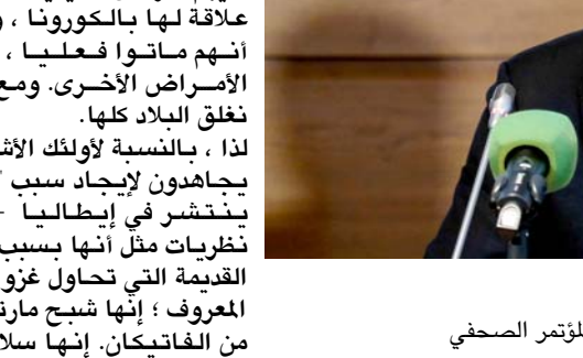
مدير المعهد الإيطالي للصحة في المؤتمر الصحفي

لم يكن هناك سوى شخصين فقط في الوقت الحاضر غير حاملين لأمراض أخرى غير فيروس كورونا ، ولكن