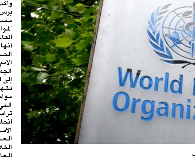
منظمة: شعار منظمة الصحة العالمية عند مدخل مقرها في جنيف

مشروع قرار وأكد المصدر الأوروبي لوكالة فرانس برس أنه لم يتم تجنب أي موضوع في مشروع القرار سواء كان بالنسبة لمواصلة إصلاح منظمة الصحة العالمية وخصوصاً قدراتها التي تبت أنها غير كافية لمنع حدوث أزمة بهذا الحجم. وقال السفير الأميركي لدى الأمم المتحدة في جنيف اندرو بريمبرغ الجمعة 'أمل في أن نتكمن من الإضمام إلى الإجماع. وتخوض واشنطن، التي تنهم بكين بأنها أخفت حجم الوباء العالمي، مع منظمة الصحة العالمية التي شكك الرئيس الأميركي دونالد ترامب بإدارتها للوباء معتبراً أنها انحازت لموقف الصين. وعلق المساهمة الأميركية في منظمة الصحة العالمية. وهناك عدة مواضيع تثير الخلافات من إصلاح منظمة الصحة العالمية وصولاً إلى تايوان وأبحاث اللوجستية التي قد يطرحها.