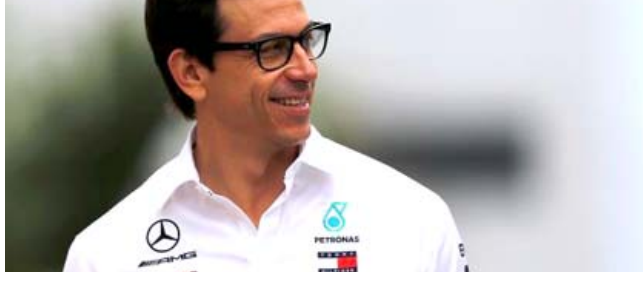
رئيس فريق مرسيدس توتو فولف

هذا الموسم أيضاً، وقال فولف: "ما من فريق جيد سينجح ببساطة وجود سائق توج باللقب أربع مرات سابقة في سوق الانتقالات نجاة ورغم هذا، أكد مرسيدس تسميته بسائقه الحاليين، ونفى فولف أن يكون فريق مرسيدس الألماني حريصاً على استقطاب سائق ألماني مجدداً، وقال: "نحن في فريق مرسيدس نرغب في تقديم أفضل السيارات وضم أفضل السائقين بغض النظر عن جنسيتهم". ويترك فيتل فريق فيراري بنهاية الموسم الحالي بعد ستة أعوام قضاها معه وتبين أن الإسباني كارلوس ساينز (25 عاماً) سيحل مكانه في قيادة سيارة الفريق. ولم يتضح بعد ما إذا كان فيتل سيجد فريقاً جديداً ليقود سيارته في 2021. وكان فيتل فاز بلقبه الأربعة المتتالية في البطولة بين عامي 2010 و2013 مع فريق ريد بول قبل الانتقال إلى فيراري في 2015. وفي المقابل، سيستغل دانيال ريشاردو المكان الذي كان متوقفاً لفيتل في صفوف فريق ماكلازين.