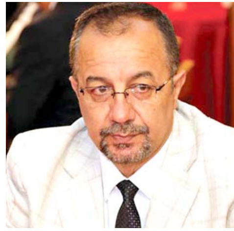
الاتحاد المركزي لكرة القدم