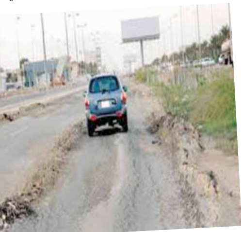
شوارع ملأى بالخرف

بغداد - الزمان أكد مواطنون في مختلف مناطق بغداد ان غالبية الشوارع والطرق في حالة سيئة وبحاجة الى صيانة او تعبيد جديد وقالوا في احاديث متفرقة ل (الزمان) ان شوارع بغداد بائسة وبحاجة الى اضافة امتار