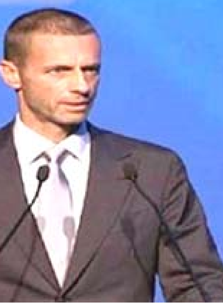
رئيس اليويفا الكسندر تشيفرين

□ باريس- رويترز: قال الكسندر تشيفرين رئيس الاتحاد الأوروبي لكرة القدم (اليويفا) إن الاتحاد القاري للعبة الشعبية بخطط لإنهاء موسم الجاري بحلول آب المقبل بما في ذلك دوري الأبطال والدوري الأوروبي. وتوقفت معظم بطولات الدوري في أوروبا في سراسر آذار الماضي في ظل استمرار أزمة فيروس كوفيد-19 لكن بعض البطولات كشفت عن خطط لعودة المباريات خلال الأسابيع المقبلة. وأعلنت فرنسا وهولندا بطولتي الدوري لكن مباريات الدوري الألماني عادت للحياة من جديد يوم السبت وتوقع تشيفرين أكمال الموسم في 80 في المئة على الأقل من البطولات. وقال تشيفرين في تصريحات تلفزيونية لدينا فكرة لكن يتعين علينا الانتظار حتى تؤكد اللجنة التنفيذية لليويفا المواعيد. بوسعي القول إن الموسم الأوروبي سينتهي في أغسطس إذا ما ظل كل شيء كما هو الآن. وأضاف المسؤول الأوروبي اعتقد أن معظم بطولات الدوري ستكمل الموسم والبطولات التي لن تكمل الموسم هي صاحبة القرار. لكن سيكون عليها خوض صفقات إذا أرادوا المشاركة في البطولات الأوروبية. ولم تستكمل بعد مباريات دور 16 في دوري أبطال أوروبا وفي الدوري الأوروبي. ويتطلع باريس سان جيرمان الذي توج بطلا لدوري فرنسا الأول لخوض مبارياته في دوري الأبطال خارج بلاده بعد أن قالت الحكومة الفرنسية إنها لن تسمح بإقامة أي أحداث رياضية على مستوى المحترفين في أراضيها قبل سبتمبر أيلول المقبل. وعن ذلك قال رئيس اليويفا باريس سان جيرمان وليون. سيتعين عليهما تنظيم مباريات في فرنسا. وإن لم يكن هذا ممكناً فسيتمن عليهما