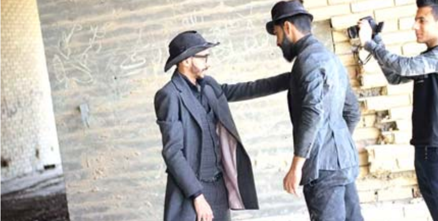
سينما : الملصق الترويجي لفيلم (جينيز فرانسيسكو)

Film : Jeans Francisco Writer and director Mohammed mazhr