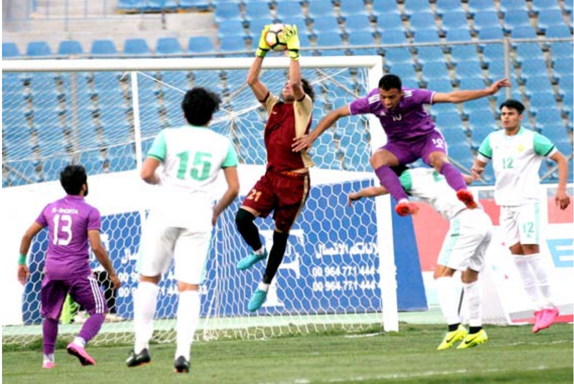
طموح: نطق الجنوب تطمح بالتألق من جديد مسابقات المئات

أقرانه حتى الضعيف منهم ولم يتمكن من الخروج من هذه المشكلة عندما خسر في ملعب نطف الوسط بهدف الختاجة المخيبة الثالثة التي نالت من طموحات المشاركة بعد التراجع في النتائج والترتيب وتلقي ثلاث خسارات وفوز قبل أن يلتقي مع النقط في مهمة شكلت تحدياً للفريقين حيث النقط الذي يسعى للفوز بعدما كان قد حققه في المرة الأولى على حساب الميناء بهدفين ولعب الجنوب واحدة من المباراة المهمة في الفترة القصيرة وكاد أن يقلب الطاولة على كتيبة علوان قبل أن تنتهي قبل أيام ما أثار على التشكيلة العام وصيده إلى أربع نقاط من خمس مباريات في المركز الثاني عشر وله هدف وعليه أربعة ويكون خرج من المنافسات التي دخلها وسط ظروف عمل مرتبكة وصعوبات واجتهد المدرب واللاعبين ومنهم لم يلتحق بالفريق إلا قبل أيام ما أثار على التشكيلة العام ويودره أدى إلى انحسار الأمور لم يتمكن الفريق من التغلب عليها لأنه لم يستند على فترة عمل واضحة وبعد توقف الدوري لفترة طويلة وحالة الضغط المالي التي واجهت الفريق الذي يرى في إلغاء الدوري الأمر الأفضل لأنه بعد لامعني لاستمرار مشاركته جراً ما حصل وفي كل الأحوال لا يمكن التقليل من مشاركة الفريق وكادت ليس بالأمر السهل ليستمر الفريق بالدوري الذي وصل إليه في موسم 2004 وظهر بشكل مقبول في بعض المواسم وخلال وجود الموارد المالية التي دعمت الإدارة في تشكيل عدة فرق ومنها قريبة حصلت على مشاركات خارجية بعدما سيطرت على البطولات المحلية.