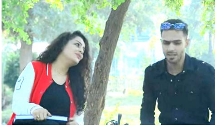
مشاهد من فيلم العمل شرف

وانتشار وباء الكورونا في العالم ضوءاً للامل الجديد وفرصة لصناعة عروض مسرحية مستقبليّة تنافس