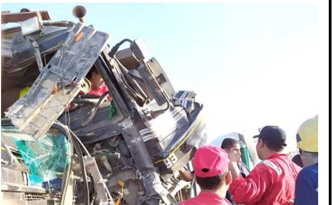
حادثة: الدفاع المدني يحاول بقتد مصابي حادثة الطريق الدولي السريع

الزمان - بغداد - مؤكدة على (ضرورة الالتزام بالتعليمات المرورية وعدم تجاوز السرعة المحددة والانتباه بخصوصاً في الطرق السريعة لتجنب وقوع الحوادث التي تسبب الخسائر البشرية). واعلنت مديرية الدفاع المدني امس الثلاثاء عن اخماد حرائق اندلعت في جبال مخمور دون خسائر بشرية. وقال المديرية في بيان انه (تم الانتهاء من اخماد حرائق جبال مخمور في محافظة نينوى والتي اندلعت بمساحة من الاعشاب وحشائش متجبيسة)، واضافت ان كان نتيجة السرعة الزائد وقلة