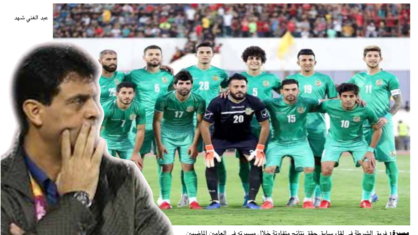
مسيرة : فريق الشرطة في لقاء سابق حقق نتائج متفاوتة خلال مسيرته في العامين الماضيين

التي شكلت حافزاً مضافاً للفريق في ان يستمر التحضير للموسم الحالي بعدما حافظ على قوته، وشكل الحصول على اللقب دافعاً للإدارة في البحث عما يدعم صفوف الفريق بعد اكثر عندما ذهبت الإدارة الى دعم صفوف الفريق في اعداد لاعبين آخرين امام تحقيق مطالب الدفاع عن اللقب الذي استقله مرتين بعدما تغلب بصعوبة على الحدود بهدفين لواحد قبل ان يتلقى خسارة الزوراء في ثاني مباريات الموسم وفي بداية مرتبة زادت عنها نتيجة التعادل مع نقاط ميسان بهدفين قبل توقف الشعبية لكنه بقي امام بطولتين مهمتين حيث بطولة الملك محمد السادس التي استهلها نهاية اب الماضي في مواجهة الكويت الكويتي وخسرهما بهدف ثلاثة قبل ان يحسم الامور وينتقل للدور الثاني عندما تمكن من هزيمة نفس الفريق في ملعب كربلاء بهدفين دون مقابل وانتقل للدور السادس عشر وتمكن من الفوز على نواديو بهدف دون رد ثم كسر الفوز مرة اخرى بالنتيجة الهزيمة اياماً خمسة اهداف دون رد لينتقل لأحد انوار البطولة المهمة حيث دور الخاتمة الخيب كثيرا وفي وضع غير متوقع بعد خمس من الشباب السعودي بسعة اهداف دون رد في نتيجة تتبقي مؤلدة في دورين قبل ان يفشل في محو آثارها بعدما خسر لقاء الارباب بهدف لتتقيد الجروح بعد ان كان ترك الفريق السياق الملكي مع انه لم يواجه فريقاً قويا صحیح يمتلك لاعبين محترفين لكن إدارة الفريق فشلت في اختيار لاعب المباراة الذي ظهر مبتلا وفي اجواء باردة جدا جرت المباراة ومن دون جمهور وفي تفاصيل فشلت الإدارة مرة أخرى في تدارك الامور ليخرج الفريق مغتلا من حيث التكتيكية والسمة والخروج الخذل لبطول الدوري المحلي بعد موسم يشار له باهتمام دوري ابطال اسيا