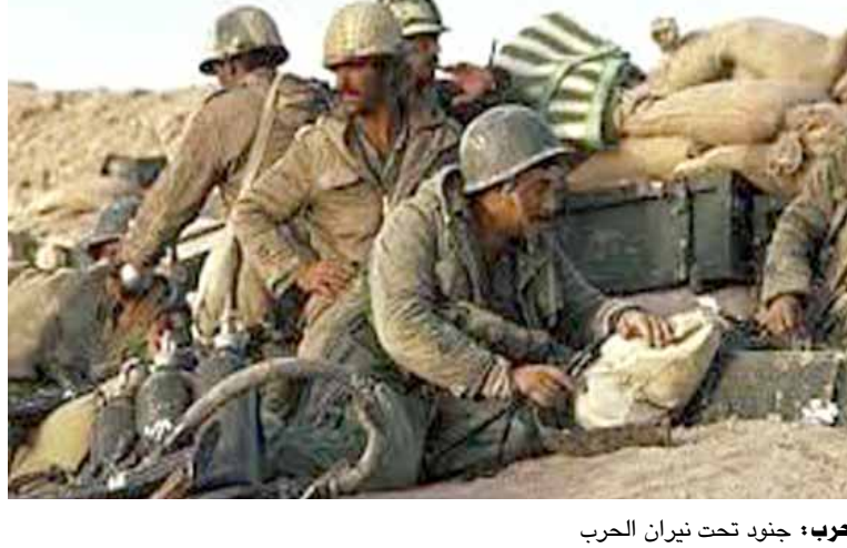
هرب، جنود تحت نيران الحرب

والملحوظ انه حينما يوجد ادب يستوعب طموح الشعب ويساهم في نوعيته ويصور الامه واملاله ويرسم له طريق مستقبله ويرين له الحياة ويقوي عزامه بها يوجد ناقد على طرازه في سعة المعرفة وشمول التجارب يقرب مفاهيمه الى قرائه ويسير لهم اكتشاف جوانبه الفنية الخاصة والجوانب التي تعمق معرفتهم بالحياة والناس والكون. وعلى نحو ما تعددت مدارس الاب واختلفت مذاهبه وتنوعت صبغته ومضموناته ظهرت في مجال النقد مآذهب شتى لثقفتي وتختلف في فهمها للاب وفي موقفها منه وفي تحميله اعباء من نوع ما ازاء الحياة والناس الذي يظهر بينهم.. وليس بينهاى اخرى ظواهر الحياة الاجتماعية يعود وجوده على وجود عدد من البواعث المتصلة بحاساس الشعب ووجدانه، كما ان دراسته من خلال علاقاته بالحياة واستمداده طموحه منها يستوجب ناقدًا يتوفر فيه الاحساس الفني المتشعب بالوعى والبركار لاكتشاف علائق وبالنسبة الى طرفونا فان النقد يواجه عددا