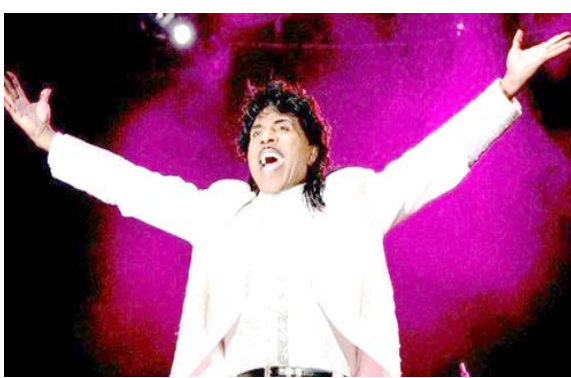
المغني، في عدد كبير من مجلة رولينج ستون إن رائد موسيقى (الروك آند رول) ليتل ريتشارد توفي السبت عن عمر ناهز 87 عاماً. وافته لرولينج ستون، لكنه

قال إن سبب الوفاة غير معروف. وقال تشارلز جلين، عازف الجيتار في فرقة، لموقع (تي.إم.زد) المتخصص بأخبار المشاهير إن (ريتشارد كان مريضاً منذ شهرين وإنه توفي في منزله بولاية تينيسي الأمريكية محاطاً بأخيه وأخته وابنته). وقال جلين لموقع (تي.إم.زد) إنه تحدث مع ريتشارد في 27 آذار وطالب منه المغني أن يزوره، لكنه لم يتمكن من ذلك بسبب وباء فيروس كورونا. وأضاف أن ريتشارد كان بمخاية الأب له واشتهر ريتشارد في الخمسينات وأوائل الستينات بأغاني أداها منها (توتي فروتي) و(الونج تال سالي).