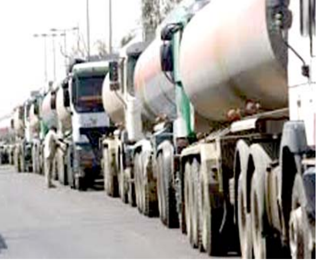
نقل: رتل من صهاريج نقل الوقد المستورد تقف في منفذ حدودي

الطلب على المشتقات للمحطات الكهربائية، إضافة إلى زيادة الطلب على مادة البنزين). منوها بان (الوزارة بانتظار إزالة الحظر الجوي لبغديسي وصول فريق تشغليته). وأضاف ان (مصفى الشعيبة يشهد حاليا عملية وحدة أزمة إلى جانب وحدة Fcc وحدات Fcc لتحويل النفط الثقيل إلى منتجات خفيفة). موضحا ان (إنجازها إضافة إلى ادخال مصفى كربلاء للعمل وبالبالغة نسب انجازها 86 بالمئة، سيمكنا الوزارة من تامين حاجة البلاد من مختلف المشتقات كما ونوعا). وعن مصافي الصمود (بيجي)، افساد وكيل الوزارة للشؤون المصافي والغاز، بان مصفى صلاح الدين يعمل حاليا بشكل طبيعي وبطاقة تكريبية تبلغ 70 ألف برميل يوميا، ومصفى صلاح الدين 2 سيذخل إلى العمل نهاية العام الحالي، وبذات الطاقة وحدة أزمة، اما مصفى الشمال والتي كانت طاقته تبلغ 140 ألف برميل يوميا، فان ملاكات الوزارة تزيل ما تم تدميره منه لتقويم حالته ومعرفة متطلبات تاهيله لاسيما ان عصابات (داعش) دمقرته بشكل معقد طال مواقع حيوية منه.