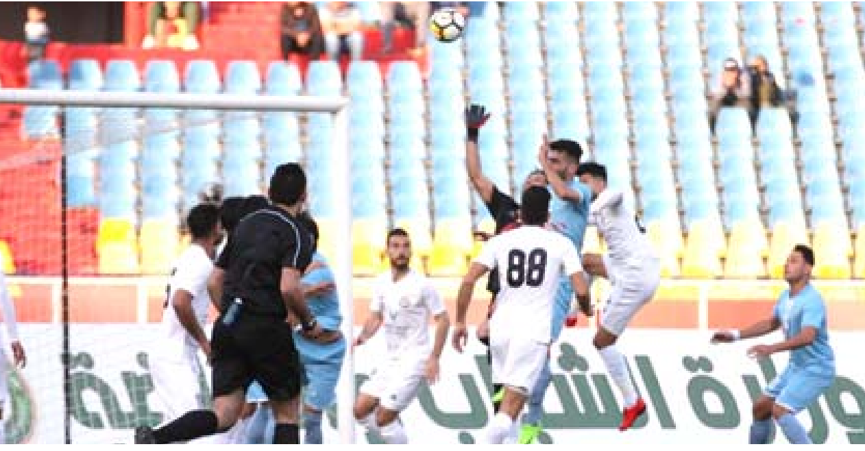
أزمة الزوراء: يواجه نادي الزوراء أزمة مالية تهدد صدارته للدوري الممتاز بعد فترة التوقف بسبب الوباء العالمي

لجنة كرة القدم تواصل تأجيل الدوري الممتاز بسبب الوباء العالمي