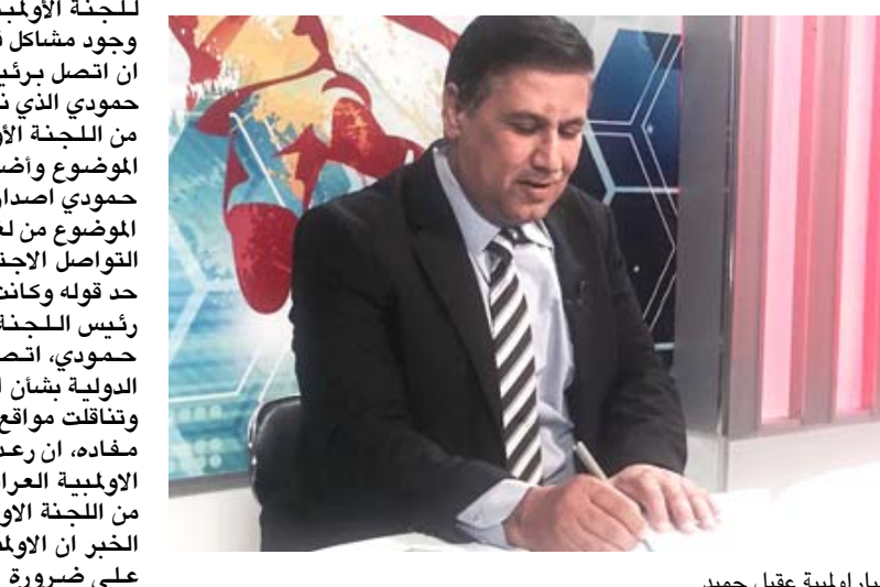
رئيس اللجنة البارالمبية عقيل حميد

كل التوفيق والنجاح في قيادة الرياضة والشباب في العراق الى بر الإستقرار وتحقيق النجاح ورفع العلم العراقي في جميع الميادين الرياضية محليا ودوليا.