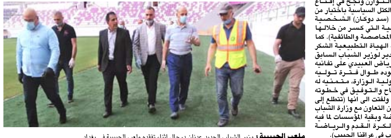
ملعب الحبيبية: وزير الشباب الجديد عدنان درجال اثناء تفقده ملعب الحبيبية في بغداد

مضاعفة لتقديم كل ما في وسعنا خدمة لبلدنا العزيز). واختم كلامه بالقول (شكراً لمشاعركم النبيلة، وأسأل الله التوفيق لكم جميعاً وبلدنا وشعبنا الكريم دوام الأمن والهدوء). وأضاف في بيانته الهياة التطبيعية لاتحاد العراقي لكرة القدم، استيزار كابتن المنتخب الوطني السابق عدنان درجال لحقبة وزارة الشباب والرياضة القطاعي الشباب والرياضة، لا سيما وان المرحلة الحالية تتطلب تضافر جميع الجهود لإنجاح مسيرة العمل، متوكلاً على الله ومستعينا بكم وبمساندتكم لنا، ودعمكم المعنوي الذي يحملنا مسؤولية