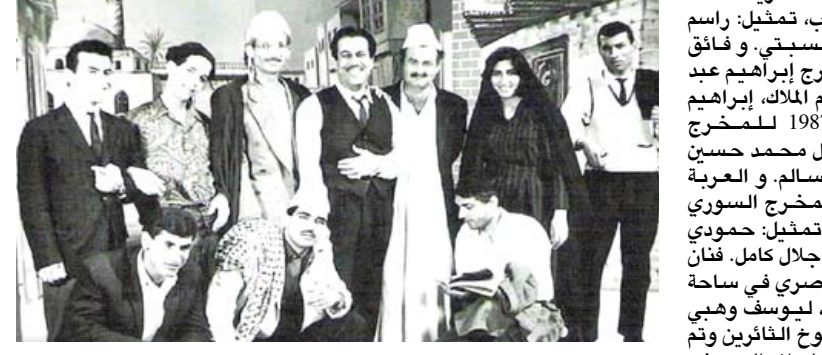
فريق مسلسل تحت موس الحلاق

من أعماله: أوراق الخريف 1964 للمخرج حكمت لبيد، تمثيل: راسم الجميلي، سهام السندي، و فائق بترجوح 1984 للمخرج إبراهيم عبد الخليل، تمثيل قاسم الملا، إبراهيم جلال، و عمارة 1987 للمخرج صاحب حداد، تمثيل محمد حسين عبد الرحيم، سهى سالم، و العربية والحصان 1989 للمخرج السوري محمد منير فكري، تمثيل: حمودي الحارثي، إقبال نعيم، جلال كامل، فنان رغما عنه، سليم البصري في ساحة الخديريه، الصحراء، ليوسف وهبي ومثل فيها أحد الشيوخ الكلاسيكيين وتم عرضها في سينما علاء الدين في وقتها تحت موس الحلاق، شاركة في بطولتها حمودي الحارثي، إخراج: عثمانوشيل رسام، تمثيل: خليل الرفاعي، راسم الجميلي، سهام السندي، كتيها، سليم البصري.