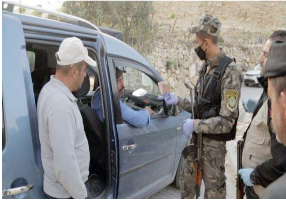
عبور: قوات الأمن تمنع الأفراد الفلسطينيين الذين لا يحملون تصاريح من العبور إلى إسرائيل

ماذا أفعل؟ وضعي المالي سيء.. لم أعمل منذ ثلاثة أسابيع.. أحتاج النقود.. طلب منه الآن البقاء في عزلة منزلية لمدة 14 يوماً.. استماتة العمال الفلسطينيين للعودة لأعمالهم في إسرائيل يسلب الضوء على اعتماد الاقتصاد الفلسطيني على إسرائيل، وهي قضية حساسة في النزاع المستمر منذ عقود.