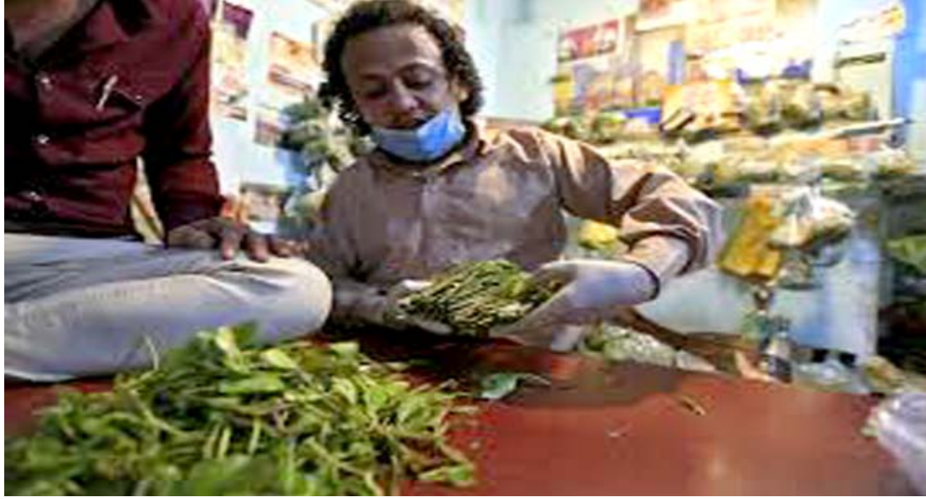
تحد: بائع قات في صنعاء. يتحدى فايروس كورونا ويواصل تشويقه

فقد أصبح يساوي ما يعادل 734 دولارا، ولا يوضح التقرير سبب هذا الانخفاض الحاد في سعر الكوكايين لكنه لفت إلى أن الوباء تسبب في انخفاض سعري أوراق فيسكون القات السبب الأول لانتشار الفايروس بشكل سريع جدا لأن أسواق القات فيها أكبر ازدهام للمواطنين. فقد أصبح يساوي ما يعادل 734 دولارا، ولا يوضح التقرير سبب هذا الانخفاض الحاد في سعر الكوكايين لكنه لفت إلى أن الوباء تسبب في انخفاض سعري أوراق فيسكون القات السبب الأول لانتشار الفايروس بشكل سريع جدا لأن أسواق القات فيها أكبر ازدهام للمواطنين.