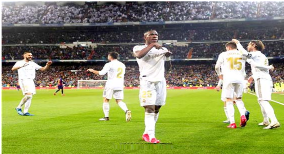
عداوة تاريخية: اشتعل التنافس بين الفريقين الريال وبرشلونة في الخمسينات، ولأسيما بعدما تعاقد مدريد مع ألفريدو دي ستيفانو

بإنهاء الموسم الحالي 2019-2020 والحفاظ على نزاهة المسابقة ورحبت بمساندة الحكومة. وواصلت: "تفكر الرابطة وأولية في اتخاذ خطوات التجريبية أولية وسيعود اللاعبون للتدريبات والمباريات وفقاً لتوجيهات الصحة وبعد التشاور مع اللاعبين والمدربين". وعقد أوليفر دون وزير الثقافة، الوزير المسؤول عن الرياضة في الحكومة البريطانية، أول اجتماع رسمي لهيئة رياضية مشتركة أنشئت لدراسة الجوانب العملية لاستئناف اللعبة. وكتب دون على تويتر "أدرك أن الرياضيين يريدون بشدة عودة الأول بين العديد من الاجتماعات التفصيلية للتخطيط لعودة أمنة لرياضة النخبة خلف أبواب مغلقة عندما يكون ذلك أمناً وفقاً للإرشادات الطبية. يوجد الكثير من الأشياء التي يجب دراستها لكن بداننا التخطيط". في موضوع آخر يعد كلاسيفكو كقطبي الكرة الإسبانية ريال مدريد وبرشلونة، أحد أهم المواجهات التي جذبت الجماهير من جميع أنحاء العالم في السنوات الأخيرة، إن لم تكن الأهم على الإطلاق. وبخلاف الندية بين اللاعبين على أرض الملعب، يوجد صراع سياسي، حيث يمثل ريال مدريد القومية الإسبانية، بينما برشلونة يمثل إقليم كتالونيا والذي سعى مراراً وتكراراً للانفصال عن الدولة الإسبانية. وأقيمت 244 مواجهة رسمية بين الفريقين في مختلف المسابقات، حقق الريال 96 انتصاراً، وهو نفس عدد انتصارات البارسا، وحسم التعادل 52 مواجهة، في دليل واضح على قوة الصراع بينهما. ويحتل الأرجنتيني ليونيل ميسي نجم وقائد برشلونة صدارة الهدافين لمباريات الكلاسيكو بـ18 هدفاً. وتبرز في السطور التالية تاريخ العداة الطويل بين عملاقي الكرة