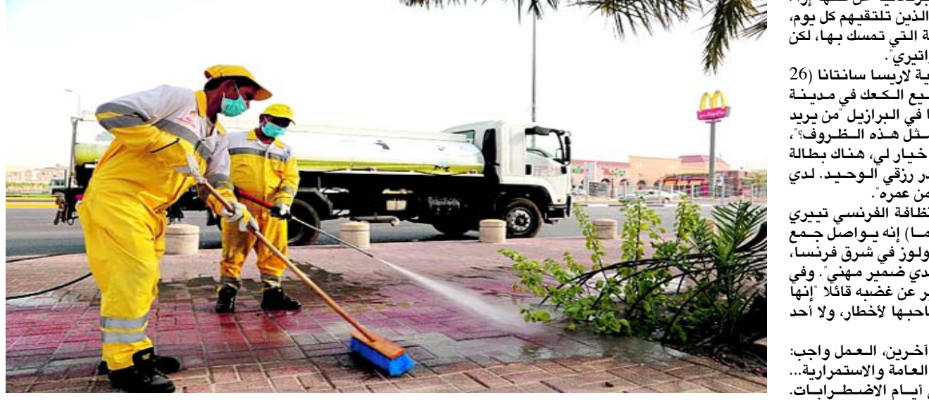
خط دفاع: عاملون في الخط الدفاع الثاني يقومون بتعقيم وتغيير مناطق مختلفة ضد فايروس كورونا

باريس (ا ف ب)، يعملون من أجل لقمة عيشهم وعيش عائلاتهم، او يدافع الواجب... لكنهم هم الذين يؤمنون اليوم استمرارية العالم، بانحو مواد غذائية، عمال النظافة او خدمات التنظيف، لطالما شعفروا بانهم مهمشون، غير مرتين، لكنهم اليوم اساسيون في المعركة ضد فيروس كورونا المستجد. لعملهم لا يحصلون على التصفيق والتكريم الذي يقدم للاطباء وللمرضى كل مساء في بلدان عدة من العالم من على سفرات المنازل، لكن اختلفت النظرة اليهم، اليوم، يتوقف الناس أكثر ليحدثوا معهم، ويعيظهم يكتب كلمة "شكرا" على مسنوعهم النفايات او على باب متجر للمواد الغذائية.