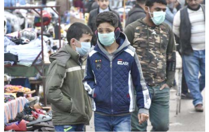
عوائل عراقية تحتمي بالكمامات من كورونا