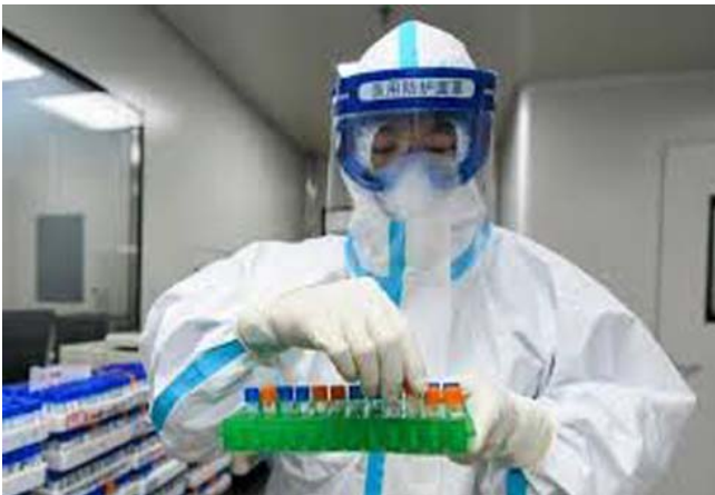
أحد الملاكات الطبية في أمريكا يحمل مصل رمديسفير