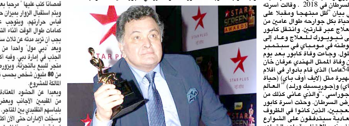
بقية الخبر على موقع الزمان

مومباي - وكالات - قالت أسرة الممثل الهندي ريشي كابور إنه توفي يوم الخميس بعد صراع دام عامين مع سرطان الدم. قام كابور ببطولة أفلام شهيرة في بوليوود منها (بوبي) و(ميرا نام جوكر) "اسمي جوكر". أسرة الممثل الهندي ريشي كابور يتحدث في مؤتمر صحفي في نيويورك بصورة من أريشيف رويتزر. وكابور (67 عاماً) سليل أسرة مشهورة في صناعة السينما وهو متزوج وله اثنان وشخصت إصابته بالسرطان في 2018. وقالت أسرته في بيان "ظل مبتهجاً ومقلباً على الحياة بكل جوانحه طوال عامين من العلاج عبر قاريتين. وانتقل كابور إلى نيويورك للعلاج وعاد إلى مومباي في مومباي في سبتمبر. أيلول. وجاءت وفاة كابور بعد يوم من وفاة الممثل الهندي عرفان خان (42 عاماً) الذي قام بأدوار في أفلام شهيرة مثل (أيف أوف باي) (أحباة باي) و(جوريسيك ورلد) "العالم الجوراسي". "والذي عانى كذلك من مرض السرطان. وحدثت أسرة كابور المحبين، الذين كانوا في الظروف العادية سيتدفقون على التباور لتأبينه، بالالتزام بقواعد التباعد