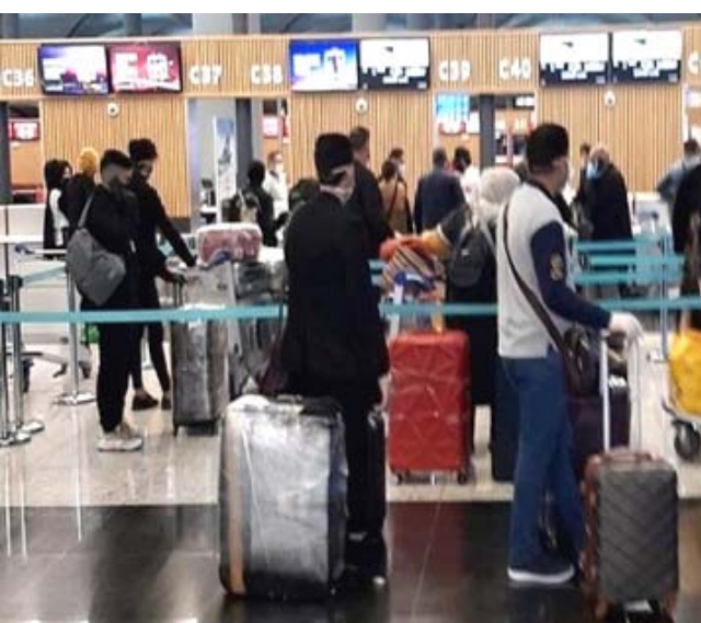
مسافرون عائدون للوطن