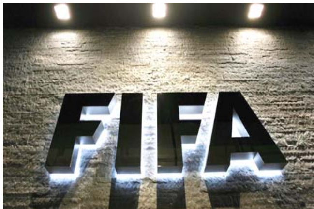
الاتحاد الدولي لكرة القدم