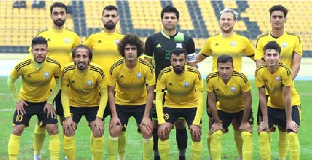
طموح يسعى فريق أربيل إلى تكرار إنجازاته في المنافسة

وكان الفريق كان على الموعد في 2007 والحصول على اللقب الثاني تواليًا واستمرت القصة والحكاية مرة أخرى والكل يتحدث عن كيفية الحصول على