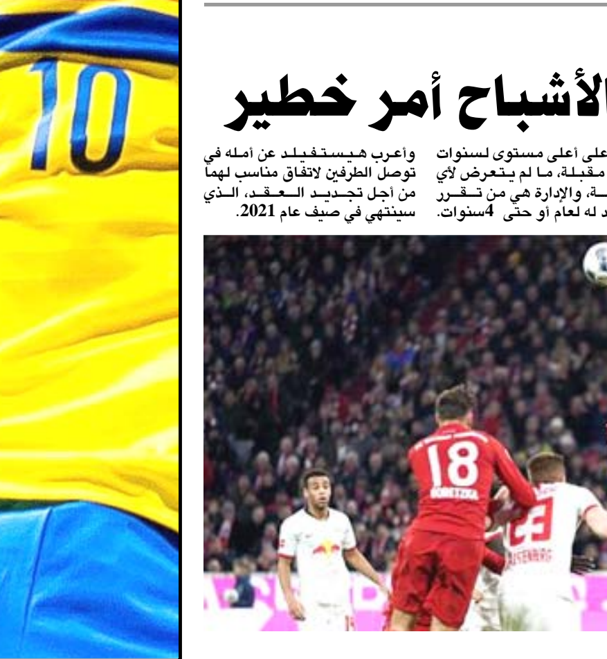
جانب من إحدى مباريات الدوري الألماني

وأعرب هينستفيلد عن أمله في توصل الطرفين لاتفاق مناسب لهما من أجل تجديد العقد، الذي سينتهي في صيف عام 2021.