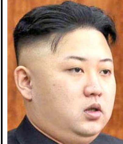
كيم جونج أون