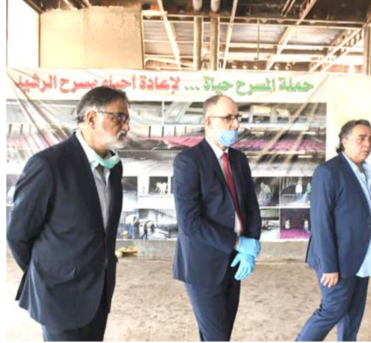
إعمار: فنانون برفقة وزير الثقافة في مبنى مسرح الرشيد