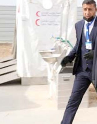
افتتاح: رئيس مجلس النواب محمد الخلبوسى يفتتح مستشفى ميداني لمعالجة مصابي كورونا في نينوى ويجول في اناسمه

الضغوط وعمليات التطهير والتنسيق مع الجهات المختصة داعبيا الى اجراء فحوصات شاملة