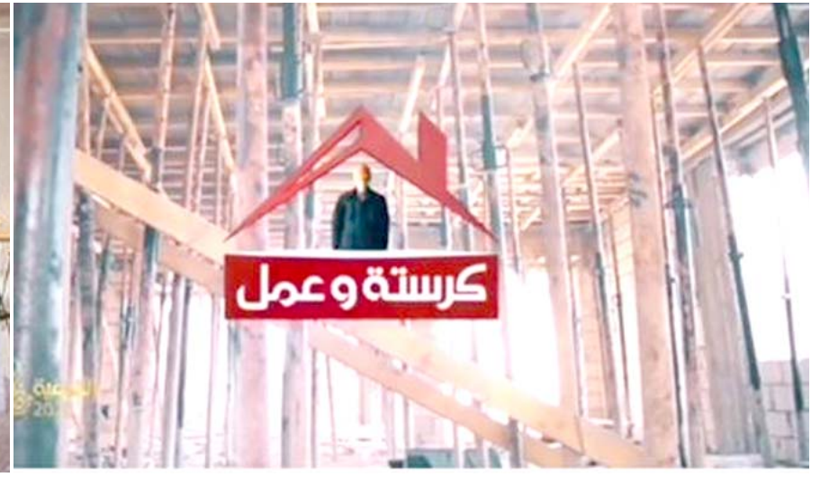
(تيل): برنامج كرسية وعمل