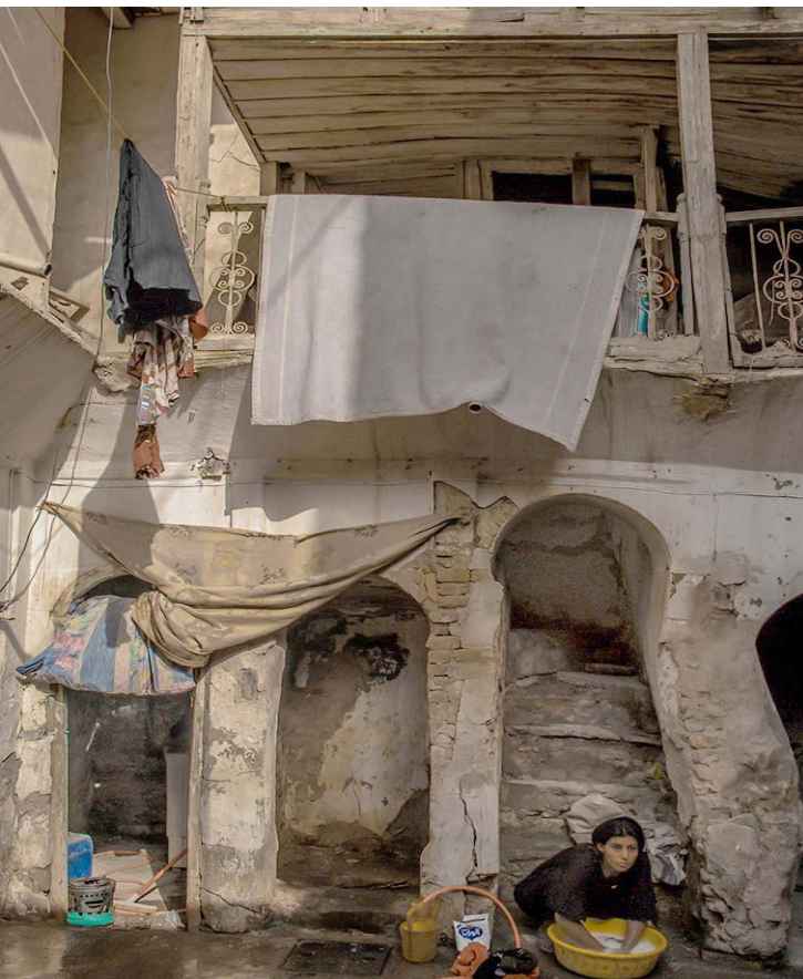
حوش من دار تراثية