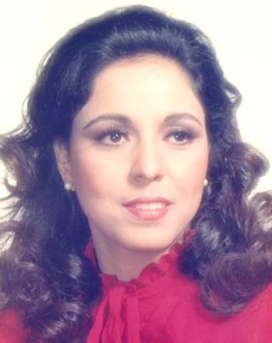
عفاف راضي، تتعالى جنبتي، المطربات في جيلها، وقد غابت جرحتي عنوة السودان، عن الساحة الغنائية سنوات حببتك، راح وقالوا راح، طويلة قبل أن تعود بعد ذلك للغناء.

القاهرة - الزمان عادت الفنانة المصرية عفاف راضي، بعد غياب طويل لحديث عن حياتها في زمن كورونا، وكيفية تقضي وقتها في الحجر المنزلي. وقالت عفاف راضي، خلال مداخلة هاتفية لبرنامج (التاسعة) مع الإعلامي وأهل الإبراهيمي، والمذاع عيسى الفضائية المصرية الأولى، إنها ترفع شعار (وحدي قاعدة في البيت) خلال نشفي جائحة فيروس كورونا المستجد، وأنها تلتمز بتعليقات الحجر المنزلي منذ بداية الجائحة، وأنها لا تخرج إلا لخروف طارئة. وأضافت الفنانة المعتزلة منذ سنوات، أن أغنياتها الشهيرة (وحدي قاعدة في البيت) رفضتها في بداية الأمر عندما عرضها عليها الموسيقار الكبير بلبل حمدي، ولكنها في نهاية الأمر اقتنعت وحققت الأغنية نجاحاً كبيراً، وتابعت: "بلغ حمدي كان يستطيع عمل أغنية كل يوم وهو أستاذ في الأغاني".