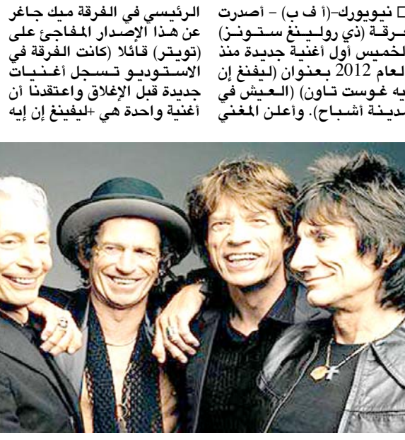
فرقة رولينغ ستونز

نيويورك (أ ف ب) - أصدرت فرقة (رولينغ ستونز) الخمس أول أغنية جديدة منذ العام 2012 بعنوان (ليفينغ إن إيته غوست تاون) (العيش في مدينة أشباح)، وأعلن المغني الرئيسي في الفرقة ميك جاجر عن هذا الإصدار المفاجئ على (تويت) قائلاً (كانت الفرقة في الاستوديو تسجل أغنيات جديدة قبل الإغلاق واعتقدنا أن أغنية واحدة هي (ليفينغ إن إيته غوست تاون) ستكون مناسبة لهذه الأوقات التي نعيشها). وفي مقابلة مع خدمة (آبل ميوزيك) قلت الإعلان، قال جاجر إنه وكثير ريتشاردن كتبنا الأغنية قبل أكثر من عام، لكن تبين أنها ملائمة للأوقات الحالية. وأوضح «كتبت الأغنية عن الوجود في مكان مدمع بالحياة لكنه أصبح مجرداً منها إذا جاز التعبير كنتها بسرعة كبيرة في غضون 10 دقائق تقريباً». وقال إصدار الأغنية عمل جاجر بعض الكلمات لتتناسب أكثر مع اللحظة الراهنة. وأضاف جاجر (أدخلت بعض التعديلات عليها. لم تكن كثيرة، لاكون صادقاً. والنسخة المعدلة تشبه كثيراً النسخة الأصلية) للأغنية.