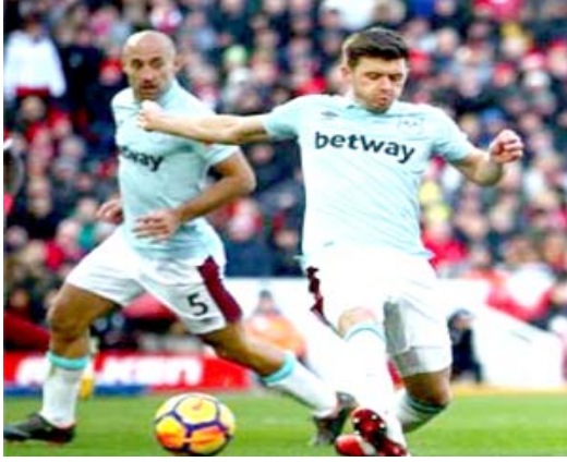
خسائر فادحة: تكبدت الدوريات الكبرى في أوروبا خسائر جسيمة بسبب الوباء العالمي

هذا المبلغ أو 800 مليون يورو من عائدات البث المفقودة، ويمكن أن تصل المبيعات التجارية الباقية المفقودة إلى 300 مليون يورو، يليه انخفاض قدره 180 مليون يورو في أرباح يوم المباراة" وتتشير البيانات المالية أيضاً إلى أن خسارة قيمة اللاعبين في سوق الانتقالات ستصل إلى 3 مليار يورو. وأضاف المتحدث: "بالإضافة إلى التضرر في خسارة مالية شديدة لبطولات كرة القدم في أوروبا، فإن أزمة كورونا سيُسبب أيضاً في خفض الإيرادات للأندية الأوروبية الرائدة". تعلق الانتقالات وأردف: "في موسم 2018، 2019 حقق أفضل 20 نادياً إيرادات