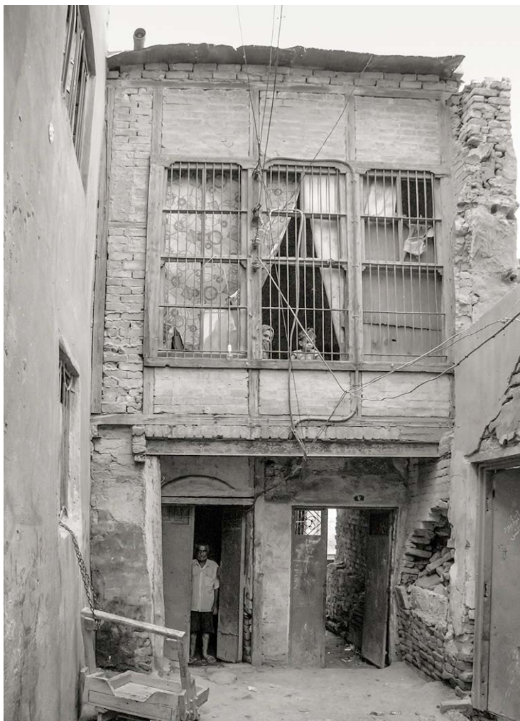
منزل قديم في كربلاء