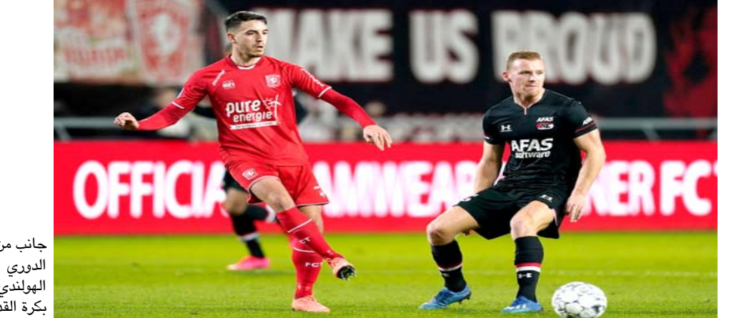
جانب من الدوري الهولندي بكرة القدم