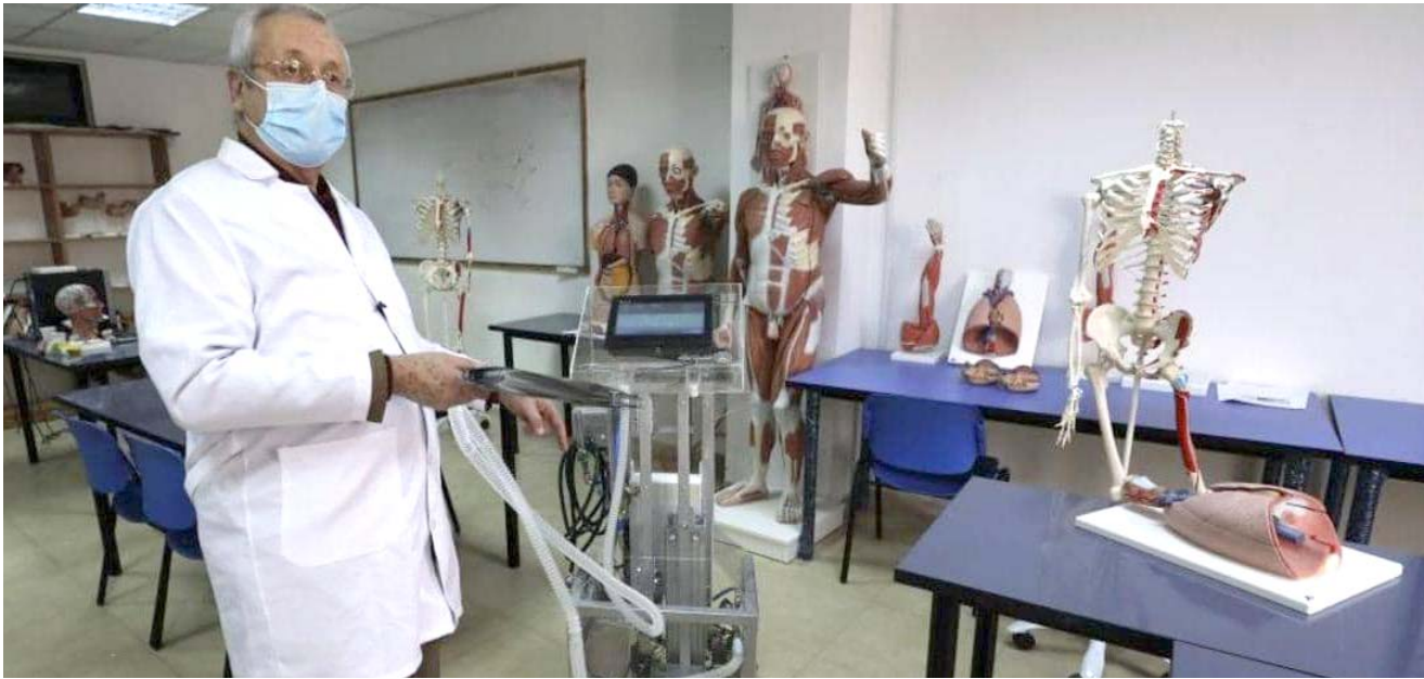
اختراع: مختبر في جامعة فلسطينية شهد اختراع جهاز تنفسي

تعامله هو مع فيروس كورونا المستجد الذي قال في كانون الثاني/يناير إنه تحت السيطرة بالكامل ليفتح لاحقاً بنحو 50 ألف شخص في الولايات المتحدة ولم لجميع الدول الأعضاء. واتخذت إدارة الرئيس الأميركي دونالد ترامب بنسبة كلاً من الصين ومنظمة الصحة العالمية واتهمتهما بعدم منع تفشي الفيروس الذي أودى بحياة أكثر من 190 ألف شخص حول العالم. ويقول معارضو ترامب إنه يحاول صرف الأنظار عن طريقة