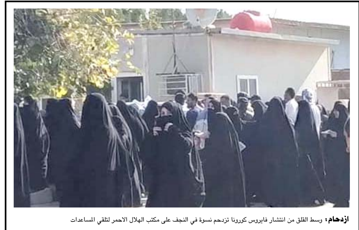
ازدهام : وسط القلق من انتشار فايروس كورونا تزدهم نسوة في النجف على مكتب الهلال الاحمر لتلقي المساعدات

تغيير نظام الرواتب يتكمن من جزعين هما الراتب الاسمي، والمخصصات وهي التي تشكل الجزء الاكظم من المورد الشهري للموظفين، وهي متفاوتة من وزارة إلى أخرى (ومن فئة إلى أخرى). وشدد على ان (الراتب الاسمي لن يتم المساس به والتقليص سيتناول المخصصات بنسبة معينة منها، وسوف تؤول على شكل توفير للمستقبل، وتمت مناقشة الأمر مع النواب العنقيين). وكشف أيضا عن ان (مجلس الوزراء سيبرسي حزمة إصلاحات ويرسلها إلى مجلس النواب والآخر هو من مناقشة ويقر، ولا يوجد هناك قرار فردي). واعلن مسؤول في مجلس الوزراء الإثنين الماضي ان الحكومة الحالية تدرس مقترحات