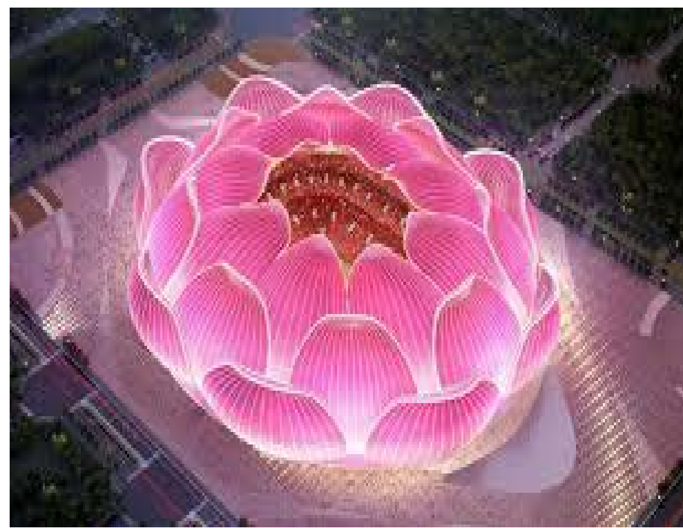
احدى الملاعب الالمانية في الصين

شنغهاي، أكبر ملعب في المدينة المقرر السابق لشنغهاي سبيغ، لعملية تحديد كبرى، وفيما تقوم مجموعة أيفرغراندي بدفع تكاليف بناء ملعب غوانغجو الجديد، يضيف جي ان باقي الملاعب تحمل نفقات بنائها النادي والحكومة المحلية سويا. وراى البروفيسور البريطاني سايمون شادوك، مدير مركز صناعة الرياضة الأوراسية في جامعة اميليون لإدارة الأعمال، أنه بالإضافة الى طموح الصين لاستضافة كأس العالم، فإن الخهافت لبناء ملاعب جديدة يوجه رسالة ان الصين تتطور وتصبح أقوى وأكثر صحة. تابع هذا ملعب ضخ، وتصميمه صادم واحتاجت صورة أنحاء العالم ويقوم الناس بالتعليق عليها ايما كان. وأضاف هذه تقريبا القوة الناعمة للملاعب. تحاول الصين استخدام هذه التصميم المميزة للملاعب لجذب الانتباه، ولجعل الناس يفهمون ان الصين تريد ما تريده باقي الدول.