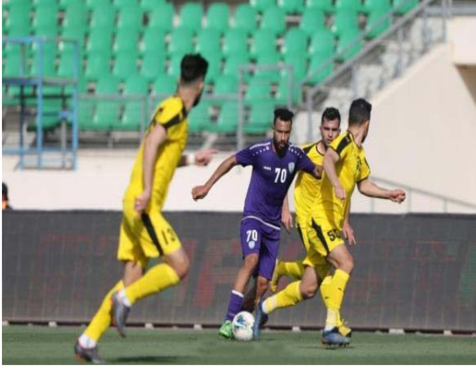
لقطة من الدوري

عضواً. وأضاف في حال لم تستطع الهيئة تنفيذ ذلك، فذلك سيعد دليلاً قطعياً على فشلها وفشل مشروع الإصلاح، لذلك أنا شخصياً في حالة عدم تمكن الهيئة التطبيقية من زيادة الهيئة العامة إلى 300 عضو سأتهمها بتزوير النظام الأساسي وتفصيله على قياساتها الخاصة لوصول أشخاص معينين دون غيرهم لعضوية المكتب التنفيذي للاتحاد. تجدر الإشارة إلى أن الهيئة العامة، هم من ينتخبون الهيئة الإدارية الجديدة للاتحاد الكروية في الانتخابات المقبلة.