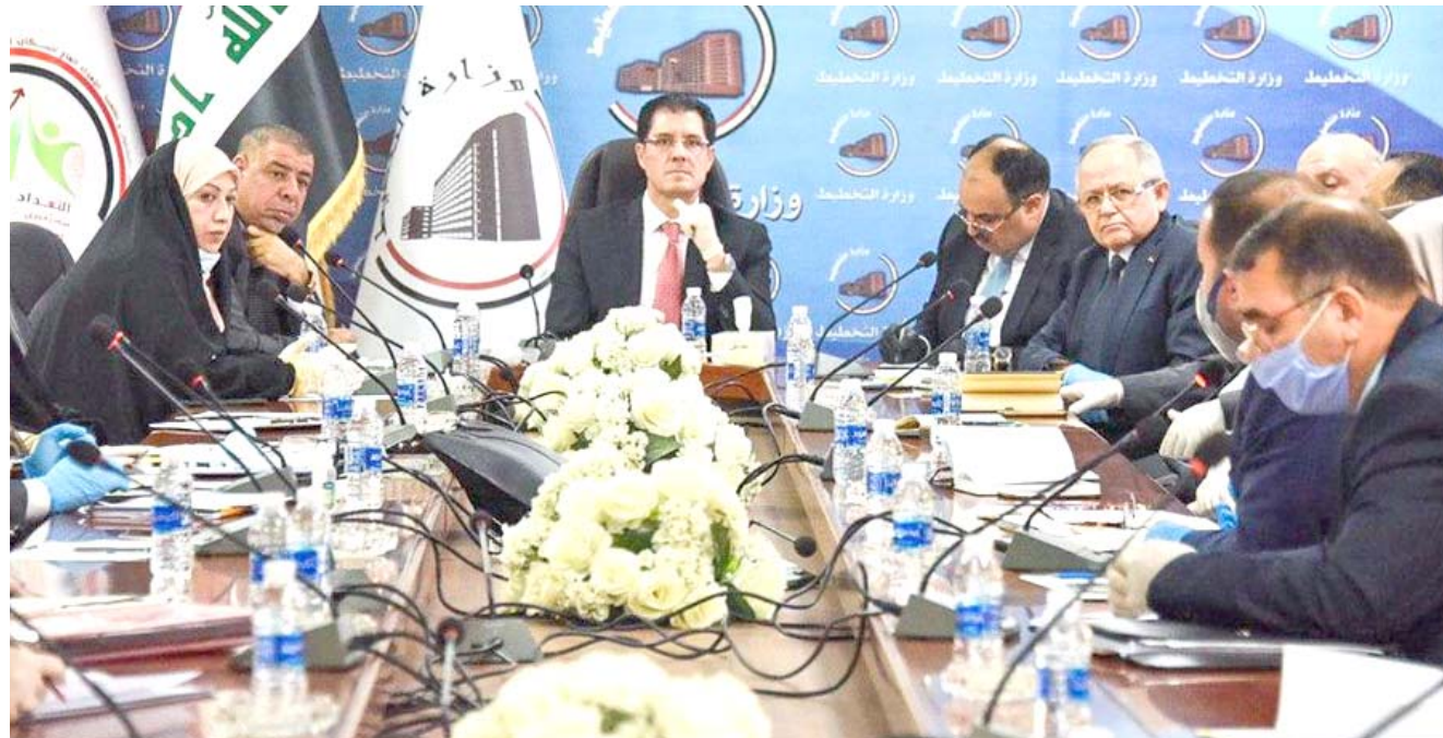
اجتماع وزير التخطيط خلال ترؤسه اجتماع اللجنة العليا للمشروع الوطني بحضور عدد من النواب