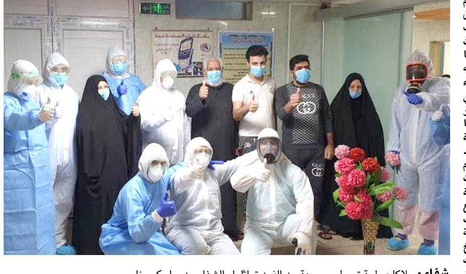
شفاء : ملاكات طبية تحيط بمجموعة من الذين تماثلوا بالشفاء، من وباء كورونا

أربيل - فريد حسن شدد رئيس حكومة إقليم كردستان مسرور البارزاني على ضرورة ان تتحمل الدولة العراقية مسؤولية تعويض المتضررين من جريمة الانتفال وتقديم الضمانات لمنع تكرارها مستقبلا. وقال البارزاني في بيان لثقته (الزمان) بمناسبة ذكرى حملات الانتفال نفذها النظام السابق عام 1988 (تحل علينا اليوم الذكرى الثانية والثلاثون لأكبر حملات الابادة الجماعية ضد شعب كردستان، التي كانت جزءا من مسلسل كان يهدف إلى الاساس إلى اقتلاع ومحو الهوية القومية للكرد وشعب كردستان) مضيفاً ان (هذه الجرائم الكبرى التي ارتكبت ضد شعب كردستان امام انظار العالم أجمع وازهقت ارواح الالاف من الابرياء، يجب الا تمر ذكرى عابرة لاستدكار ماسينا بل يتعين ان تعمل من اجل اجتثاث الفكر الشوفيني العنصري الذي كان الدافع الرئيس وراء هذه الابادة الجماعية)، مشيراً إلى انها (امتدت إلى معظم مناطق كردستان، ولا تزال جرحاً غائراً يرحى من ذاكرة شعب كردستان). وضمن البارزاني قائلا انه (في الوقت الذي تؤكد فيه حكومة إقليم كردستان سعيها المتواصل لتحويل مذابح