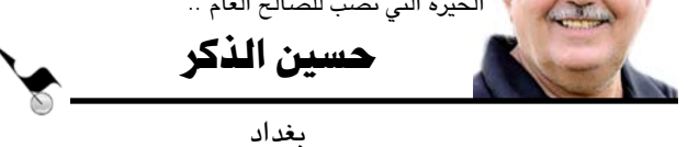
حسين الذكر بغداد