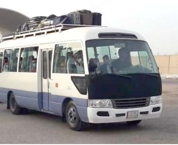
مؤسسة الزمان العراقية الدولية للصحافة والنشر