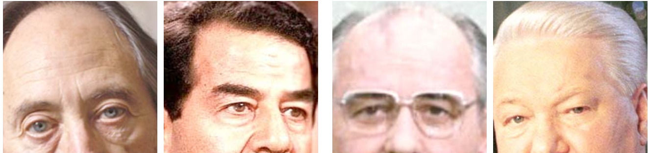
بوريس يلتسين، ميخائيل غورباتشوف، صدام حسين، اليقين توفلر

بوتين يصف قرارات البيت الأبيض والآلة والإتحاد السوفيتي سقط في لحظة ماجنة