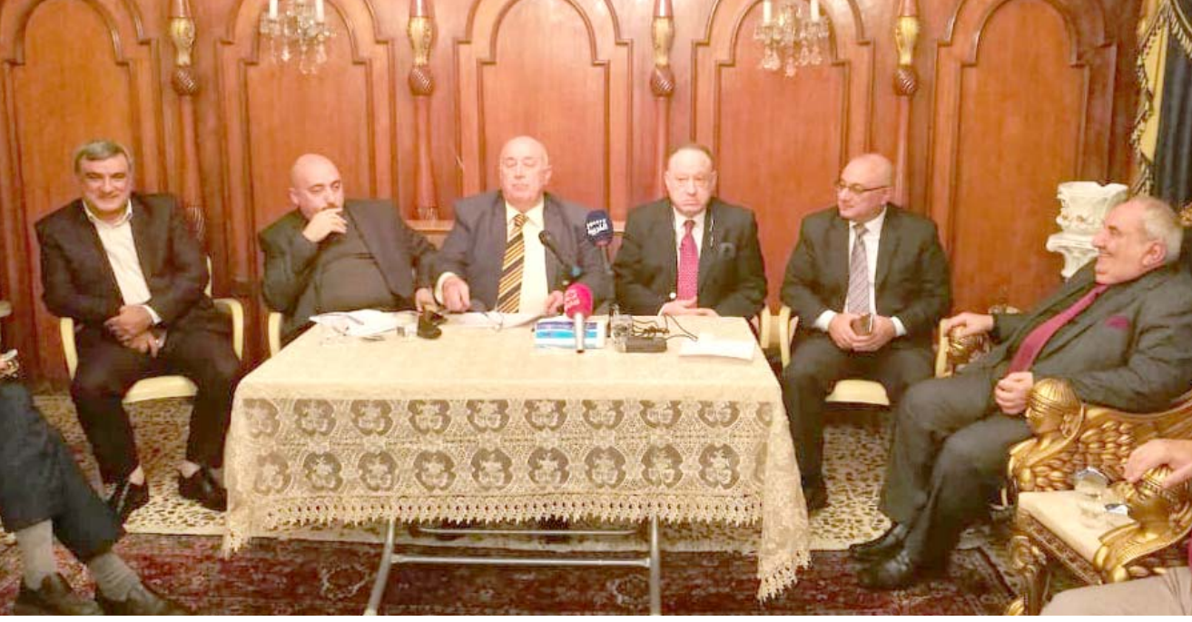
المشاركين في النقاش

الإنتاج العام وتعظيم الإيرادات العامة غير النفطية إلى أقصى درجة ممكنة دون المساس بمستوى المعيشة للطبقات الوسطى والفقيرة في المجتمع العامة كثيرة جدا بل ويمكن أن تكون صحية على المدى طويل منها خفض الرواتب والرئاسات الثلاث والإلغاء مجلس الوزراء تشكيل فريق مالي واقتصادي خبير بإدارة الأزمات بين أعضاء من خبراء المالية والاقتصاد