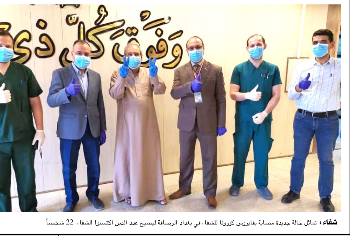
شفا : تاتل حالة جديدة مصابة بفايروس كورونا للشفاء في بغداد الرصافة ليصبح عدد الذين اكتسبوا الشفاء 22 شخصاً

بغداد - الزمان أعلنت وزارة الصحة والبيئة امس الجمعة تسجيل 76 حالة جديدة مصابة بفيروس كورونا ليرتفع العدد إلى مجموع الاصابات الكلي في العراق بلغ 458 حالة قبل تعلن محافظتا ديالى وواسط تسجيل اصابتين. وقال بيان للوزارة ان مختبراتها شخمت تأكيد اصابة 76 حالة جديدة بفيروس كورونا المستجد في العراق موزعة كالآتي 9 في بغداد/ الرصافة، و 2 في مدينة الطب، و 3 في بغداد/ الكرخ، و 3 في البصرة و 1 في كركوك و 18 في النجف وحالة واحد في كل من السليمانية وذي قار وبابل وصلاح الدين، و 3 في أربيل). وافتاد البيان بر تسجيل 4 وفيات جديدة موزعة كالآتي حالتان في البصرة وحالة واحدة في ذي قار وحالة واحدة في بابل وتسجيل 17 حالة شفا، جديدة موزعة كالآتي 16 في بغداد/ الرصافة، و 1 في السليمانية و 1 في الديوانية). وكشف البيان عن ان (مجموع الاصابات الكلي في العراق بلغ 458 حالة و 122 حالة وفاة و 122 حالة شفا). وفي وقت لاحق أعلنت محافظتا ديالى وواسط تسجيل اصابتين بالفايروس.