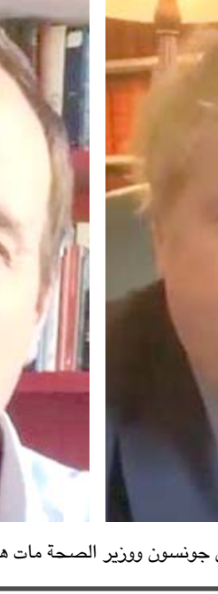
اصابة : رئيس وزراء بريطانيا بوريس جونسون ووزير الصحة مات هانوك يعلنان اصابتهما بكورونا