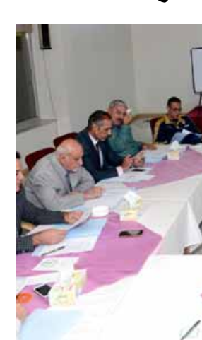
اجتماع سابق لاتحاد كرة القدم