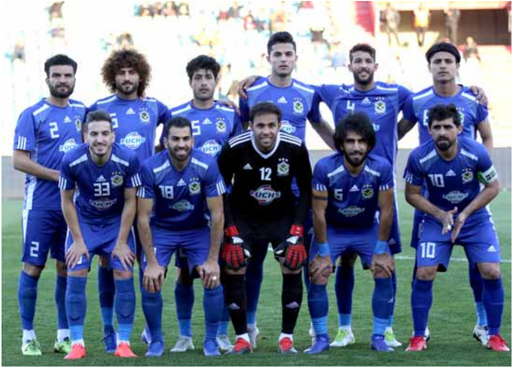
حظوظه: يسعى الجوية إلى استعادة بريقه ونيل اللقب الدوري الممتاز

طريقهم للمنتخب الوطنية، ويتطلع الفريق الذي فضل المشاركة رغم ظروفه المعروفة والأمل في أن يكون منافسا في مجموعته عبر ما يمتلكه من لاعبين استهلوا الموسم ويأملون أن يكونوا عند حسن الإدارة التي تكون قد امتت مطالبات المشاركة واللعب وسط طموحات المنافسة وتحقيق النتائج المطلوبة لإمام رغبة كبيرة في الوصول إلى الدور النهائي.