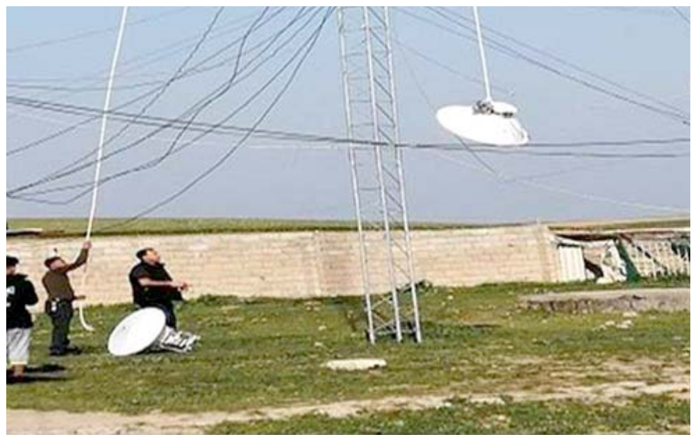
إبراهيم: فنيو الاتصالات يقومون بصيانة أبراج اتصالات متضررة

بغداد - الزمان طالب مواطنون الجهات المعنية بضرورة متابعة شركات النقل في البلاد وحصتها على تقديم خدمات جيدة وذات جودة عالية أسوة بالشركات الموجودة في دول الجوار. وقال مواطنون لـ (الزمان) امس ان (خدمة شركات الإتصال للهاتف النقالة في دول الجوار تعد ذات جودة عالية لما تقدمه من خدمات وبأسعار زهيدة عبر اطلاق باقات بين مدة وأخرى بشأن الاشتراك بخدمات الإتصال والإنترنت). ولأقربين الى ان (الشركات الموجودة حاليا في العراق بدأت تتجاهل نحو تفعيل خدماتها لكن لم تصل الى مستوى الطموح الذي يتطلع اليه المواطن وممازالت اسعار كارتات التعبئة باهضة الثمن وفناؤها يكون سريعا بسبب عدم وجود تعاون بين الشركات المتنوعة مما يتحمل المتصل عبر الشبكات الأخرى تكاليف كبيرة). ودعا المواطنون الشركات والجهات المعنية (تحسين جودة الإتصال ودعم المواطن الذي يعيش ظروفها صعبة في ظل غلاء المعيشة وتراجع فرص العمل وان تكثف جهودها لإطلاق عروض تناسب مع الظروف الراهن من خلال تخفيض أسعار كارتات تعبئة الرصيد وتقليل كلف المكالمة للمشتركين).