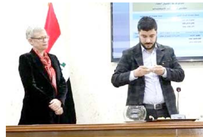
قرعة: جانب من سحب قرعة مفوضية الانتخابات في إقليم كردستان بإشراف دولي