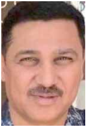
بغداد - عبد اللطيف الموسوي لندن - الزمان

واستشهدا ثلاثة مظاهرين في محافظة البصرة/ام قصر، وإصابة تسعين متظاهراً بسبب التصامات التي حدثت بين القنوات الأمنية والمتظاهرين، مضيفة انها اشتر اعتقال 93 متظاهراً في محافظة بغداد اطلق سراح 14 منهم، واعتقال 38 متظاهراً في محافظة البصرة، و 22 متظاهراً في محافظة ذي قار و 34 متظاهراً في محافظة كربلاء) وتابعتها (وقعت قيام عدد من المتظاهرين بضربي القنوات الأمنية بقناتني المولوتوف ويحرق عدد من المباني والمحال التجارية في ساحة الخلائي وشوارع الرشيد في بغداد وحرق مبنى مديرية العشائر في ذي قار وعلق الطرق أمام حقول النفط في محافظات ميسان واسط والبصرة وعلق ميناء ام قصر وبعض الجسور الحيوية في عدد من المحافظات واستمرار غلق عدد من المدارس والجامعات فيها بسبب الإضراب). وافاد مصدر اممي في محافظة ذي قار بان قائد شرطة المحافظة محمد القرشي اصدر امراً بسحب قوات الشغب من الشوارع واستبدالها بأخرى. وأوضح ان (القرشي وجه بتكليف قوات الشغب والشرطة الأمنية متتابعة الأوضاع الميدانية). وكشف مصدر اممي عن إغلاق المحال التجارية قرب جسر الاحرار وسط بغداد تحسباً من عمليات الحرق. وأوضح المصدر ان (ضرباً متقطعاً للشغب الأمني مع رمي بالحجارة تنهدتها منطقة حافظ القاضي، ومقريات جسر الاحرار). وأكد ان (اصحاب المحال التجارية في تلك المنطقة بدأوا بفرغ مخازنهم من البضائع الموجودة تحسباً من احراق البنائات والمحال).