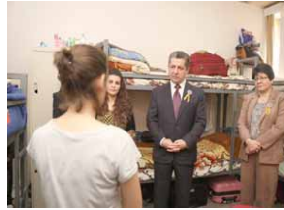
زيارة: رئيس حكومة كردستان يزور مركزاً لإيواء النساء