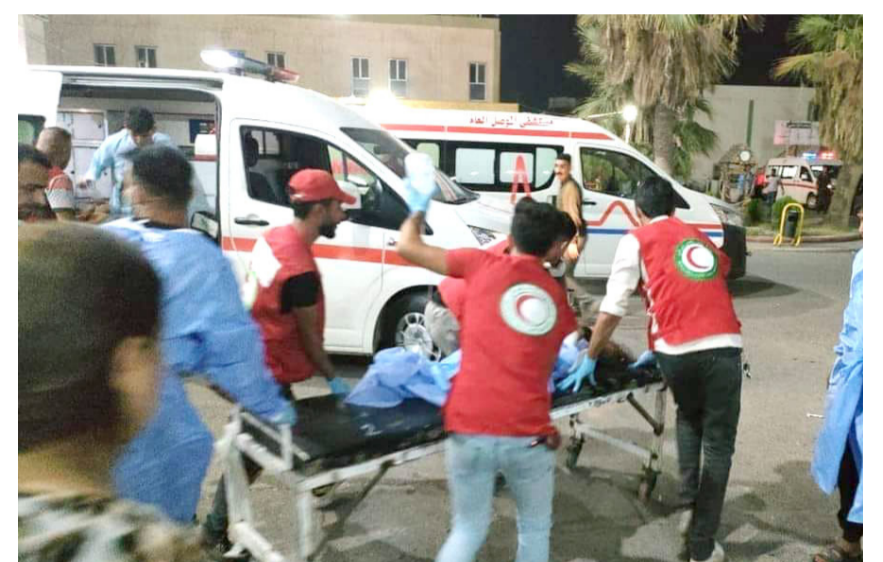
ساعات: فرق الاسعاف تنقل مصابي حريق الحمدانية للمستشفيات وتبدي تضامنها معها، تتسأل الله العلي القدير ان يربط على قلوبهم بالصرير ويشمل

الاعمال النارية داخل القاعة واحراق السقف بشكل سريع وانهباره). ولفت الى ان (وزارة الصحة تبذل جهوداً كبيرة لعلاج المصابين، وان المفقودين سيحاولوا جزامهم العادل). وكانت مديرية الدفاع المدني، قد كشفت في وقت سابق عن ان (الحريق أدى إلى انهيار أجزاء من القاعة نتيجة استخدام مواد بناء سريعة الاستعمال واطئة الكلفة تدعى خلال دقائق عند اندلاع النيران). مؤكداً ان (القاعة مغلقة بالواح الكويونيد سريع الاستعمال والمخالفة لتعليمات السلامة وافتقارها إلى متطلبات السلامة من مخلفات الأضرار والإطفاء الرطبة، فيما أعرب المرجع الديني على السيستاني في بيان مكتبه تابعته (الزمان) اس عن (بالغ الأسى والأسف للحريق المروع الذي وقع في الحمدانية واسفر عن سقوط مئات الضحايا والمصابين، وإن تقدم تعازيها للعوائل الحكومية