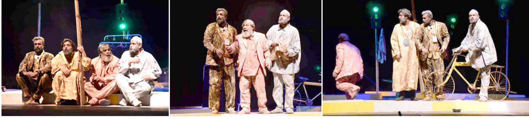
مسرحية: لقطات من مسرحية (صفصاف) - عسة - نور القيصر

المسرحية لحقبت مضت ثم يفتتح على الواقع الآن لوصفها أزمة متصلة مع الماضي وعدم وجود متغير نوعي مع التحول السياسي، كون هناك تكون سياسية، شكل امتداد لما سبق سنين طويلة ونحن نقف على نفس الرصيف بل وفي نفس النقطة، شحبت وجوهنا، وتهاكت ثيابنا حتى صارت بلون التراب ولازلنا نتحرك بسرعة دراجة هوائية لا نملك حتى إطارات، كي تسير بصورة طبيعية (خيبيات متكررة، لكن في العرض المسرحي قلب الرشيد المعادلة، من خلال لون الإشارة المرورية، الأخضر مفتوح منها لها اتجاهها في التعبير عن الأزمنة، رسالته وصلت، ويجب أن تكون هناك تكييف للرواية الإخراجية). مضيفاً (فريق المسرحية قدم الأزمة العراقية وكأنه يقول الأزمة مستمرة فقد قدنا الكثيرين المعطيات الإيجابية الحياتية والتي تعبر عن سلوك متواز بين السابغ والحاضر).