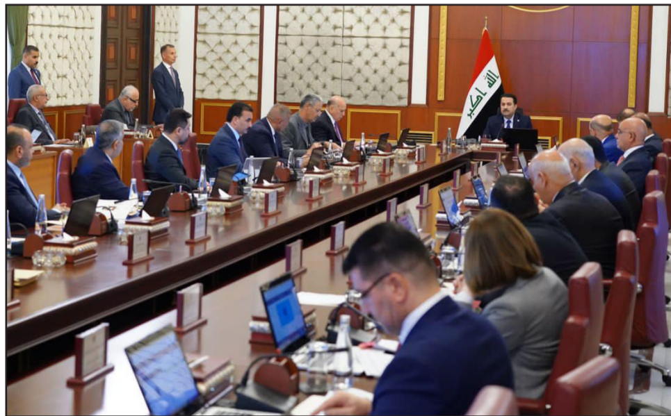
جلسة: رئيس الوزراء يترأس الجلسة الاعتيادية لمجلس الوزراء

وقال بيان جلسته (الزمان) امس ان (المجلس) عقد جلسته برئاسة محمد شياع السوداني، حدد خلالها موسم الإستزراع الشتوي وتوزيع البذور في الأول من تشرين المقبل، وأضاف ان (السوداني) استعرض مشاركته في اجتماعات الجمعية العامة للأمم المتحدة، والقضاء التي عقدت على هامش هذه المشاركة مع قادة رؤساء الدول، والمختصات الدولية والعالية، وما تمخض عن هذه اللقاءات من تفاهات واتفاقات وبيانات مشتركة، تغذي مسار التعاون الدولي للعراق، وتعرز الشراكات الاقتصادية مع الدول الشقيقة والصديقة).