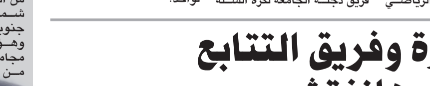
سلة: فريق دجلة بكرة السلة

بغداد- الزمان أوقعت القرعة فريق نادي دجلة الجامعة العراقي في المجموعة الرابعة من البطولة العربية للأندية بنسختها 35 التي تحتضنها العاصمة القطرية الدوحة الى جانب اندية الاتحاد الليبي ومجد طنجة المغربي وبيروت اللبناني والأهلي المصري وجرتر النقرة الخاصهر لبطولة الأندية العربية الخامسة والثلاثين لكرة السلة التي ستقام بدولة قطر خلال الفترة من 1-12 تشرين الأول. وستقام المنافسات في نادي قطر بالعاصمة الدوحة وتضم قائمة فرق البطولة أندية، دجلة الجامعة العراقي، والحرق من البحرين، والأهلي ونادي قطر من قطر، والأهلي، والاتحاد السكندري من مصر، وبيروت ودينامو من