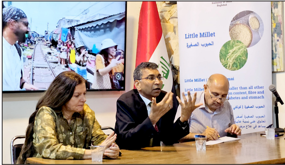
مؤتمراً: السفير الهندي في مؤتمر صحفي

وتطور بيساي (إرسال طلاب العراق لدراسة الماجستير والدكتوراة، ووجود دورة لكار الموظفين العراقيين في تطوير قدراتهم، والنسورات مستمرة لمختلف المسؤولين الدولة في العراق، كما ستقوم منظمة جيورفود الهندية بإقامة مخيم في لزيارة الأطراف الصناعية، في مبادرة إلى ضحايا الحرب والمخيم خمسون يوم والمكان قاعة خاصة في معرض بغداد