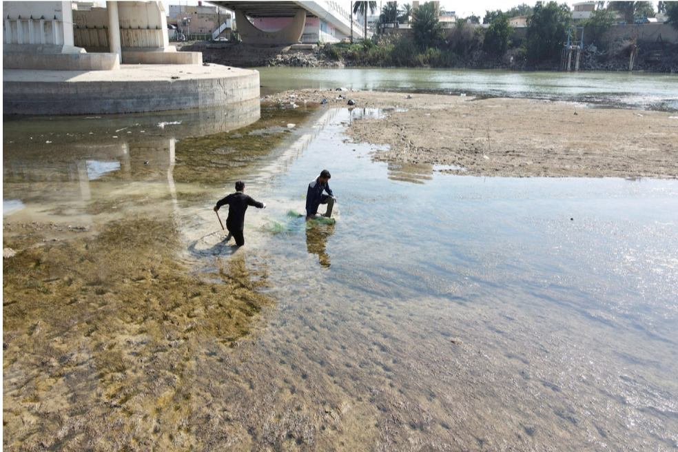
انحسار: صبية يلهون في نهر دجلة بعد انحسار مناسيبه