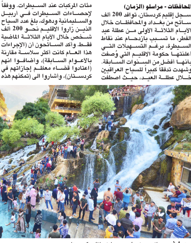
مصافي: سائحون في أحد مصافي إقليم كردستان