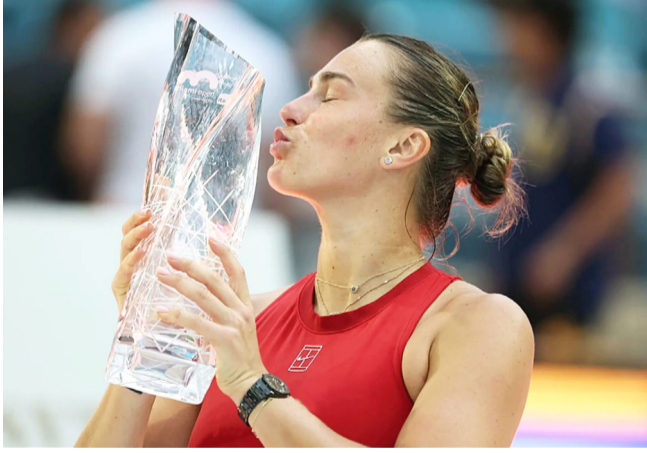
تتويج : سابالينكا المصنفة الأولى عالمياً تتوج بلقب بطولة ميامي المفتوحة للنسك

□ ميامي - وكالات: توجت البياروسية أرينا سابالينكا، المصنفة الأولى عالمياً، بلقب بطولة ميامي المفتوحة للنسك 1000 نقطة، في منافسات فردي السيدات، بعد فوزها على الأمريكية جيسكا بيجولا 7-5 و6-2 في المباراة النهائية، وحزرت سابالينكا اللقب عن جدارة، دون أن تخسر أي مجموعة طوال مشوارها في البطولة، ليكون ثاني الفاتحة هذا الموسم، بعد بطولتي بريمزين، فيما رفعت رصيدها الإجمالي إلى 19 لقباً، على مدار مسيرتها الاحترافية. الأولى، وسعت البياروسية الفارق إلى 3000 نقطة في صدارة التصنيف العالمي، مع البولندية إيجا شفيونيتك، التي ودعت البطولة من دور الثمائية أمام الفلبينية البكس إيالا.