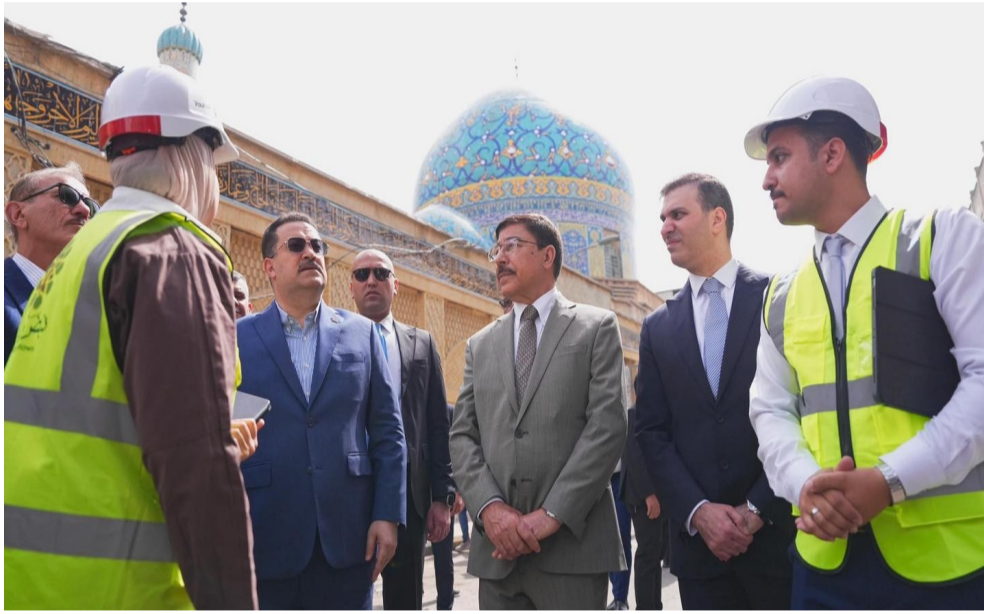
زيارة: رئيس الوزراء خلال زيارته شارع الرشيد ببغداد

تاهيل وصيانته للممرين ذهاباً وإياباً من جسر الغالبية إلى هيبه بطول 9 كيلومترات، وعرض يصل إلى 11 متراً)، وبين أن (المقطع الثاني يشمل تاهيل وتعرض للممرين من جسر الغالبية إلى سيطرة مدخل بغداد بطول 21