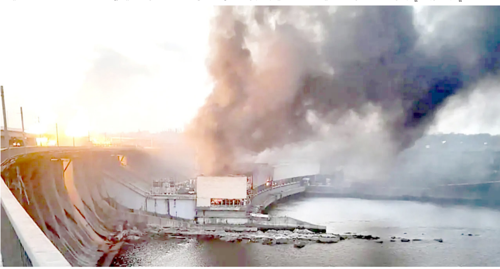
حريق: اندلاع حريق في إحدى محطات الطاقة الأوكرانية نتيجة القصف الروسي

الأسابيع الثلاثة الأخيرة... واصلت روسيا ضرباتها على منشآت الطاقة، واستمرت في ارتكاب جرائم حرب.» وصرح وزير الخارجية البريطاني ديفيد لامي خلال مؤتمر صحفي مشترك مع نظيره الفرنسي أن الرئيس الروسي فلاديمير «بوتين» ما زال يعزل الجهود ويماطل، في حين يمكنه أن يقبل بوقف لإطلاق النار