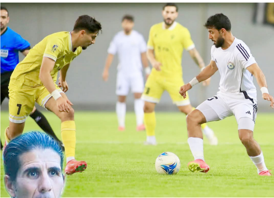
خسارة فريق الزوراء، يتعزز إلى خسارة مفاجئة أمام دهوك بالمحترفين

بعد رفع رصيدة إلى 44 نقطة وواصل تقدمه موسماً متميزاً في كل شيء، ويأمل في إنهاء ترتيبه متقدماً فيما فشل أربيل استعادة توازنه ونغمة الفوز حتى بين جمهوره عندما سقط أمامهم متجرعا للخسارة الحادية عشرة وبيات يعيش فترة التراجع الحقيقية بدون فوز منذ عقودوات وافقد القدرة على التعويض والشبكة اهدار نقاط مباريات الارض وكانت مباريات الجولة 25 التي جرت خلال ايام العيد قد أسفرت عن تمكن الزوراء من استعادة الصدارة 52 مدعوماً بفوزة المهم على الطلبة بهدفين لوحيد بعدما خسرت زاخو في ملعب الآخوة الأعداء دهوك بهدف سجلته في وقت لاحق في وقت نقطة من الجولة المركز الثالث 49 وتقدم الشرطة 50 وصفا بعد فقرة الغريم الجوية بنتيجة قاسية عندما تغلب عليه رباعية نظيفة وتعادل كربلاء والكرخ بهدف وفوز المتألق القاسم بهدف على نوروز وتغلب الميناء على الغنط بهدفين وتعادل الكرخمة وبيديان بيون اهداف وتمكن النجف من مرمى على الحدود بثلاثة أهداف لوحيد وفوز الكرخية على أربيل بثلاثة اهداف لوحيدوا نقم بمبدا على جارة نطق البصرة بهدف حافظ الغراف على صدارة فرق الدوري الممتاز لكرة القدم 40 نقطة رغم خسارته ثمانية ايام الفهد بهدفين لواحدي في الجولة 22 من الدوري امسى الاول فيما رفع الاخيرة رصيدة الى 33 في المركز الخامس وتقديم الامانة بتعادل بهدفين في المركز الثاني 39 والموصل ثانيا 37 واستعاد الجولان 39 وفوز بربصيدة 27 والاتصالات 23 سادس عشر.