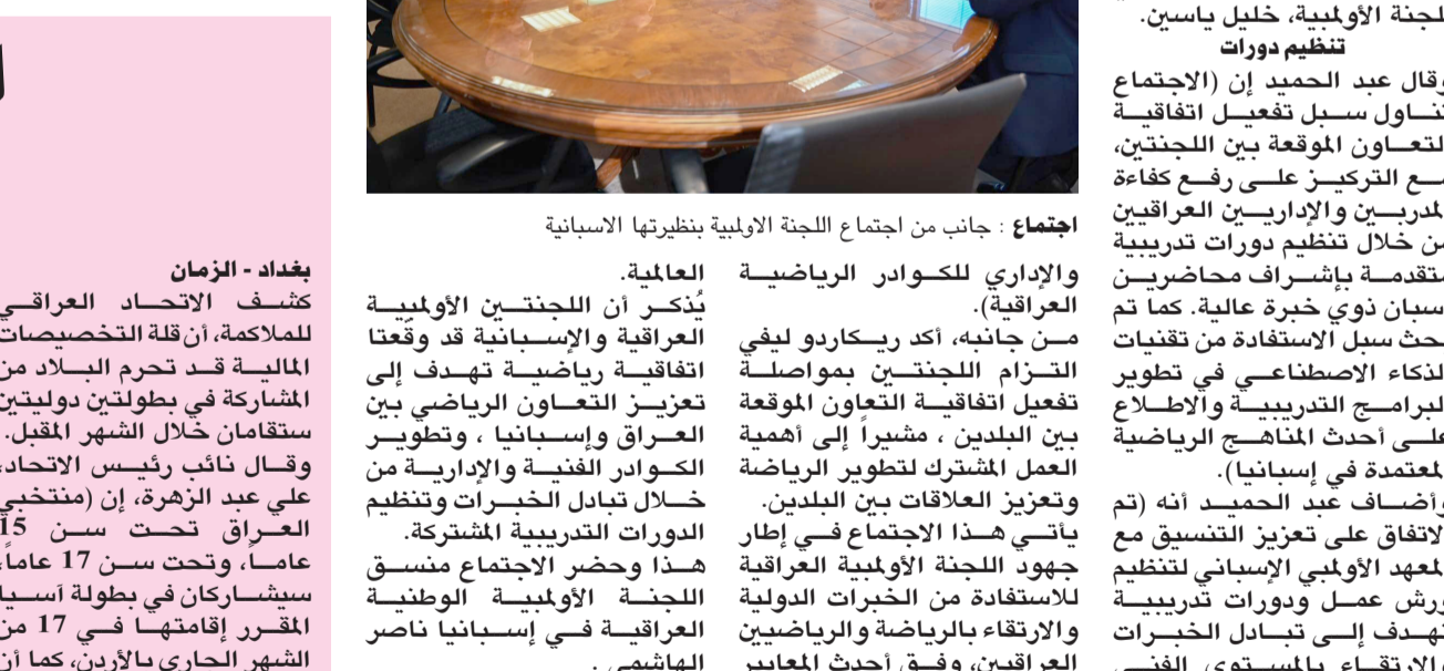
اجتماع: جانب من اجتماع اللجنة الأولمبية بنظيرتها الإسبانية