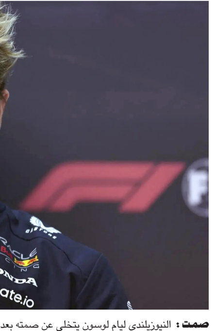
صمته : النيوزيلندي ليام لوسون يتخلى عن صمته بعد قرار فريق ريد بول

□ أوكلان - وكالات: تحلى النيوزيلندي ليام لوسون عن صمته بعد قرار فريق ريد بول، المنافس لبطولة العالم لسباقات سيارات فورمولا 1، الاستغناء عن خدماته بعد خوضه سباقين فقط في الموسم الجديد للمسابقة. وقرر ريد بول، التحلي عن خدمات لوسون، 23 عاماً، لينتقل لفرق ريسينج بولز، فيما حل الياباني يوكي تسونودا محله. أمس الخميس، بعد تأهله في المركز الأخير في سباق جائزة الصين الكبرى وكذلك في سباق السرعة الذي جرى بكمشان شنغهاي، بالإضافة لتعرضه لحادث تسبب في استبداده خلال ظهوره الأول هذا الموسم في سباق الجائزة الكبرى الأسترالي بمدينة ميلبورن. تواصل اجتماعي استعان لوسون وسائل التواصل الاجتماعي للحديث إلى حبيبه عقب استبداده من ريد بول، ونشر لوسون صوراً له عندما كان طفلاً يظهر فيها كسائق فورمولا 1، وعلق عليها قائلاً لطالما كان حلمي منذ صغري أن اصبح سائقاً في فريق أوراكل ريد بول، وهو ما سعت لتحقيقه طوال حياتي، وأضاف لوسون: الأمر صعب، لكنني ممتن لكل ما أوصلني إلى هذه المرحلة لكل من وقف إلى جانبي، شكراً جزيلاً لكم على كل الدعم الذي أقدروه، وحرص لوسون أيضاً على توجيه الشكر لفرق ريسينج بولز على حقارة الاستقبال، قائلاً إنه متحمس ومستعد للعمل في أحد أوصاله، ووقع لوسون مع ريد بول كسائق ناشئ في عيد ميلاده الـ 17، وفي كانون الأول الماضي، حل محل سيرجيو بيريز في الفريق