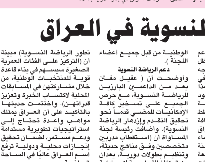
بطولة: إحدى مشاركات العراق في بطولة دولية بالملكمة