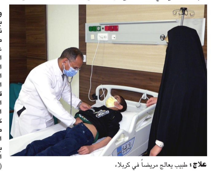
علاج: طبيب يعالج مريضاً في كربلاء