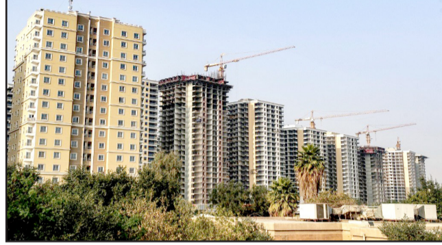
مجتمعات: الشقق السكنية في مجتمعات بغداد تشهد أسعاراً خيالية

والتي تجاوزت 15 ألف دولار (حوالي 22 مليون دينار عراقي) للمتر المربع، تأكد أن أسعار العقارات في بغداد لا مثيل لها عالمياً، مما يجعل العقارات في العاصمة الأغلى سعراً من أي مكان آخر في العالم. وهذا لا يشمل المناطق التجارية، حيث يبلغ سعر المتر المربع أربعة أضعاف سعرة في المناطق السكنية. ان الطلب على العقارات في بغداد يتزايد باطراد، ولا توجد مشاريع كبيرة قيد التنفيذ لتلبية هذا الطلب، الحقيقة أن حيازة إقطاعية إلى 3-2 ملايين وحدة مع حيازة إقطاعية إلى 3-2 ملايين وحدة سنوياً لوكالة الطب الخزايد في السوق، والحلل الأمل لهذه المشكلة هو بناء مجتمعات سكنية على أطراف بغداد، ذات بنية تحتية قوية متصلة بمركز المدينة، حيث أن الاعتماد فقط على مركز بغداد لن يعالج أزمة الأسعار، والاهم أن تكون بأسعار مناسبة لأصحاب الدخل المحدود.