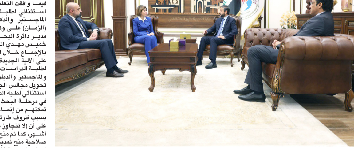
اجتماع: نعيم العبودي يبحث مع ايفان جابرو التعاون المشترك بين وزارتي التعليم والهجرة

بغداد - ابتهاج العربي بحث وزير التعليم العالي والبحث العلمي نعيم العبودي، مع الهجرة والمهجرين ايفان فائق جابرو، مجالات التعاون الثنائي المشترك، وقال بيان تلقته (الزمان) امس إن (العبودي