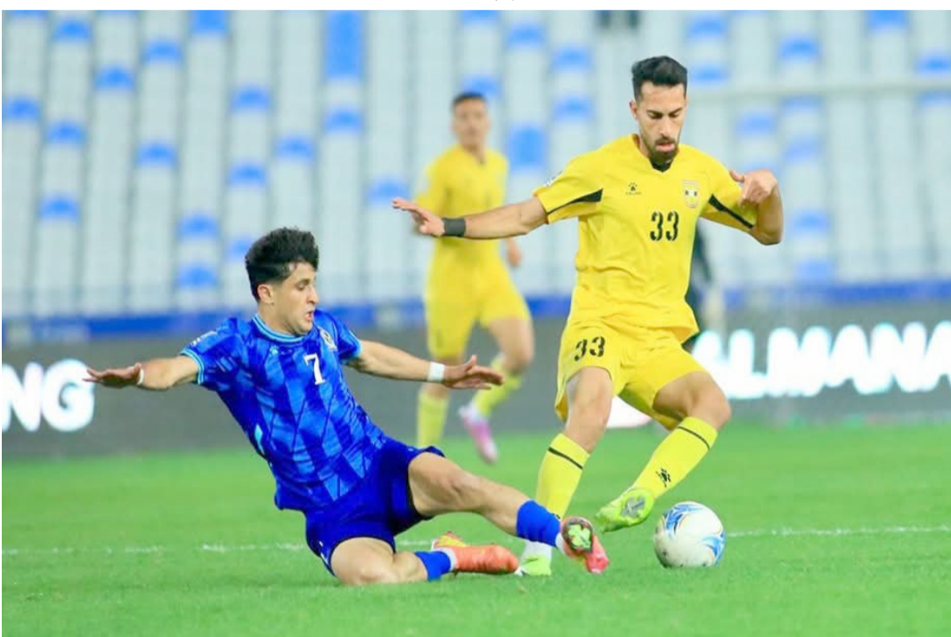
فوز فريق الكرخ يحقق فوزاً ثميناً على فريق القوة الجوية في دوري المحترفين

عن صحوة وتلقى الخسارة الثالثة توالي قبلها من الكرامة ناهما والجوية بين جمهورية وافقد للتمرکز المطلوب وخلق المساحات للانطلاق الهجومي في ظل تباعد الخطوط ولان الطلاب كانوا في الموعد وقدموا واحدة من المباريات المهمة بينما افتقد نوروز لزام المبادرة ومحاوله العودة قبل الخروج بنتيجة ثقيلة ارغمة التراجع مركزاً حيث الثاني عشر 30 ويات بشعر بتراجع الاداء والام الهزائم وسط تحديات ومشاكل النتائج ما يدفع قحطان جثير الى معالجة الامور بسرعة خلال فترة التوقف التي بدأت مع نهاية الجولة المذكورة ولان الفريق يجد نفسة امام تغير حاد في مسار المشاركة.