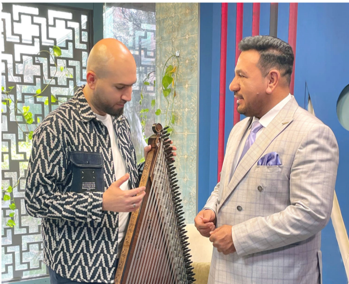
موسيقى: ديار ازاد يبدع موسيقياً مع آلة القانون