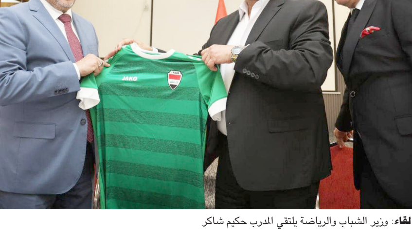
لقاء وزير الشباب والرياضة يلتقي المدرب حكيم شاكر

بغداد- الزمان حضر عمار الحكيم، رئيس تيار الحكمة الوطني، مائدة السحور الرياضي بدعوة من رئيس اللجنة الاولمبية الوطنية العراقية، عقيل مفتن. وأعرب الخطابى خلال المناسبة عن تقديره للجهود البارزة التي يبذلها مفتن في العمل الاولمبي والرياضي، متمنيا له دوام النجاح والتفويك كما اثنى على الجهود التنظيمية المتميزة في اقامة البطولة الدولية للرياضة للفرسية، معربا عن سعاده ببقاء مفتن. عن جانبه، عز عقيل مفتن عن ائتمانه لحضور الخطابى، مشيرا الى ان هذا اللقاء يعكس روح التعاون بين المحافظات العراقية واللجنة الاولمبية. وأكد مفتن ان المكتب التنفيذي للجنة الاولمبية يدعم جميع الإجراءات التي تساهم في تطوير الرياضة في المحافظات، والارتقاء بها لتحقيق الإنجازات موضحاً أن ذلك لا يتحقق إلا عبر العمل الجاد، ووضع خطط واضحة، ومنهجية فعالة.