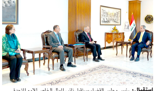
استقبال: رئيس مجلس القضاء، يستقبل نائب الممثل الخاص للأمم المتحدة

انصف المستفيدين، وشمول أكبر عدد ممكن من المستحقين للأراضي السكنية، ومضى إلى القول أن (اعداد المتقدمين للحصول على الأراضي كبيرة، ولتلائم مع أعداد الأراضي التي تصل نسبتها إلى 25 بالمئة من المتقدمين).