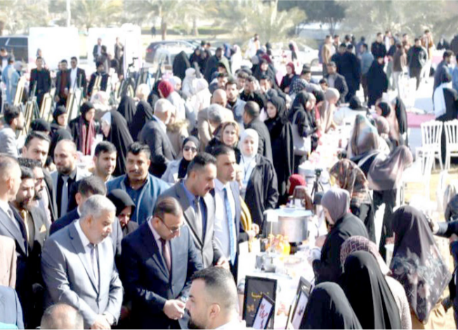
افتتاح: وزير الزراعة يفتتح بازارا خلال زيارته لجامعة الكوفة