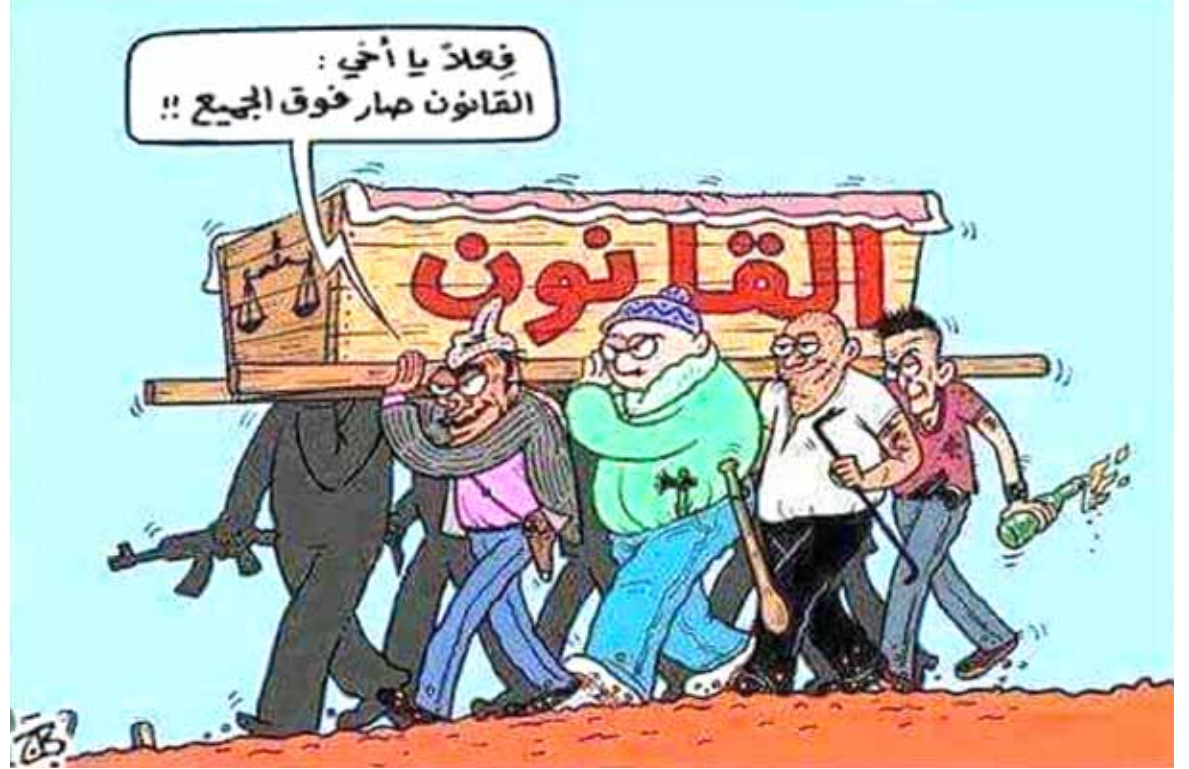
نقلا عن مواقع التواصل الاجتماعي

الكثيرين من الذين يرغبون زيارة الديار المقدسة الى سحب اسمائهم من القرعة او تاجيلها لسنوات مقبلة نتيجة تلك التكاليف التي يصعب تحملها في الوقت الراهن)، مؤكداً ان (النواب والمسؤولين يتسابقون لإداء فريضة الحج من خلال الحصول على استثناءات وكذلك يعفي أغلبهم من تكاليف الفريضة بعد عودته تقوم الحكومة بدفعها لهم وهذا يعد تمييزاً بين المواطن اعرب مواطنون عن استغرابهم من عدم شمول النواب والمسؤولين بقرعة الحج في كل عام واستثناءهم من تكاليف أداء الفريضة، عابدين ذلك تمييزاً وتعدياً على الحقوق والاستحقاقات، وقال المواطنون لـ (الزمان) امس ان (النواب امس ان الحصول على استثناءات وكذلك يعفي أغلبهم من تكاليف أداء فريضة الحج عام تقوم هيئة الحج باستيفاء اجور اكثر من السابق مما دفع