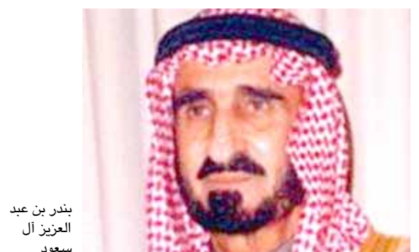
بندر بن عبد العزيز آل سعود

الرياض (ا ف ب) - توفي الأمير بندر بن عبد العزيز آل سعود، شقيق العاهل السعودي الملك سلمان واكبر أبناء الملك الراحل عبد العزيز، مؤسس أسرة آل سعود، الذين لا يزالون على قيد الحياة. وقال الديوان الملكي انه سيصلى عليه بعد صلاة العشاء امس الاثنين