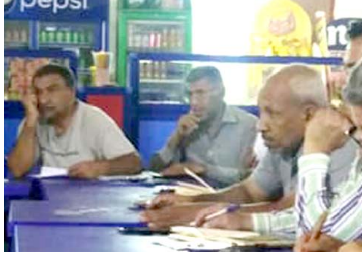
تدريب وتأهيل : مشاركون في ورشة الادارة المسرحية يتابعون المحاضر