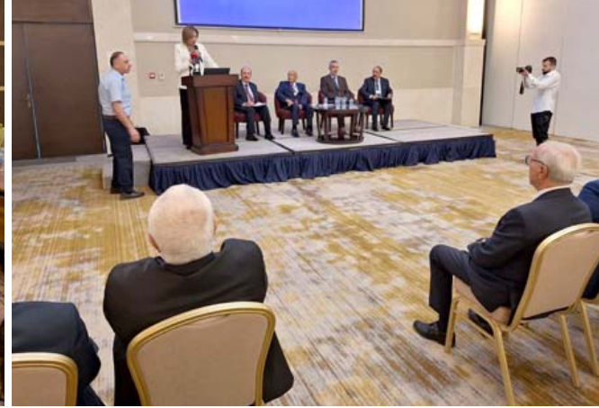
ندوة: الامن القومي العربي في ندوة لاتحاد الحقوقيين العرب بالعاصمة الاردنية عمان

طابع شعبيها، وتنظيم نمط الحياة فيها، وتشكل جزءاً أساسياً في قيمها الجوهرية وقدرتها ونهضتها ومدى تأثيرها الإقليمي والدولي، وتنازع ان (الإنسانية العلمية تقتضي أيضاً الإشارة إلى أمرين غاية في الأهمية هما قضايا الأمن القومي العربي قد شهد نوعاً من التسييس القوي بتأثيراته السلبية على الإبراك العربي لمفهوم الأمن القومي العربي ومفهوم الأمن القومي العربي بصرف النظر عن مستواه، قد عانى من عملية توسيع مذهلة في المنطقة العربية، أفقدته مضمونه تماماً، حيث جرى توسيع المفهوم ليشمل كل جوانب دراسات الشخصية السياسية وربما الاقتصادية)، وشدد على القول (اعتدوا للأمن القومي العربي باعتباره، فهو الحل، ولا طريق أمن سواء، لمواجهة التحديات الكثيرة التقليدية منها والمستحدث التي لم تتكامل على الدول العربية كما فعلت الآن، مهددة الوطن العربي فرادى ومجمعة). أما شعبان فقد قدم رؤية واقعية للأمن العربي الراهن وحللت تداعياته من نكبة حزيران 1967 وحتى الحروب العربية العربية، ودعا إلى (مشروع نهضوي عربي يستجيب للتحديات ويقدد الأمة من التشتت).