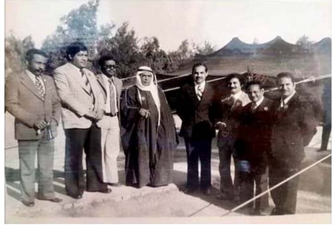
وفد نقابة المحامين إلى المؤتمر التأسيسي لاتحاد الحقوقيين العرب عام 1975