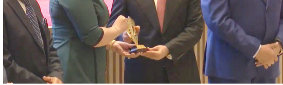
حفل: رئيس مجلس القضاء الاعلى خلال مشاركته حفل اتحاد المحامين العرب في بغداد

بغداد - ندى شوكت أكد رئيس مجلس القضاء الاعلى فائق زيدان، ان الاستقلال التام للقضاء هو الضمان الاساس للحفاظ على القانون وقال زيدان خلال الحفل الافتتاحي لاجتماع المكتب الطارئ لاتحاد المحامين العرب في بغداد ان القضاء قبل عام 2003، كان جزءا من السلطة التنفيذية، باعتبار ان وزير العدل هو من يدير القضاء، حيث شهدنا في تلك الحقبة ممارسات كثيرة أفقدت القضاء استقلاله، وأضاف ان الاستقلال التام للقضاء هو الضمان الاساس للحفاظ على القانون، وأشار الى انه بعد تغيير النظام السياسي في عام 2003، والتصويت على الدستور عام 2005، أصبح للقضاء سلطة مستقلة عن السلطتين التشريعية والتنفيذية، وتابع ان هذا الاستقلال الحقيقي وعلى أرض الواقع، فيما قررت محكمة جنابات الرصافة، بتبرئة حفيد