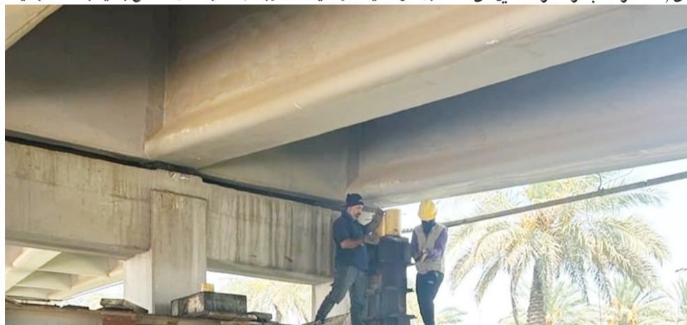
تاهيل : ملاكات امانة بغداد تنفذ اعمال تاهيل مجسر حي العامل

عملها في العاصمة والمحافظات. وقال البيان ان (كاظم اوعز الى ابن رشد المختصة، بفحص وتقييم الاعمال الهندسية في مشاريع البنى التحتية، وتطوير مستوى العمل)، مؤكداً ان (الامانة ماضية بتبني مشاريع عمرانية، للنهوض بالواقع الخدمي وفقاً لمعايير الجودة والسيطرة النوعية)، وتابع كاظم ان (دور الشركة مهم في فحص المواد الداخلة في المشاريع الإنشائية والبنى التحتية شفافياً)، مشدداً على (دعمها وتأمين التخصصات المالية اللازمة، لتطوير مختبراتها ومعداتها، وشراء الاجهزة والمعدات المطلوبة لتوسعة مهامها، في اطار تحقيق طفرة نوعية في مواصفات المشاريع المطلوبة)، وفي الديوانية، تم احالة مشروع إنشاء جسر بنت الهدى الكونكريتي، وسط المحافظة الى التنفيذ، موضحة تفاصيله ومدته الإجمالي، وقال المحافظ ميثم عبد الإله الشهد، امس انه (تم احالة مشروع إنشاء جسر بنت الهدى الكونكريتي وسط المحافظة الى التنفيذ)، مبيناً ان (المشروع بطول 58 متراً وعرض 10 امتار، بقيمة بلغت مليار و698 مليون دينار، ضمن مشاريع الأمن