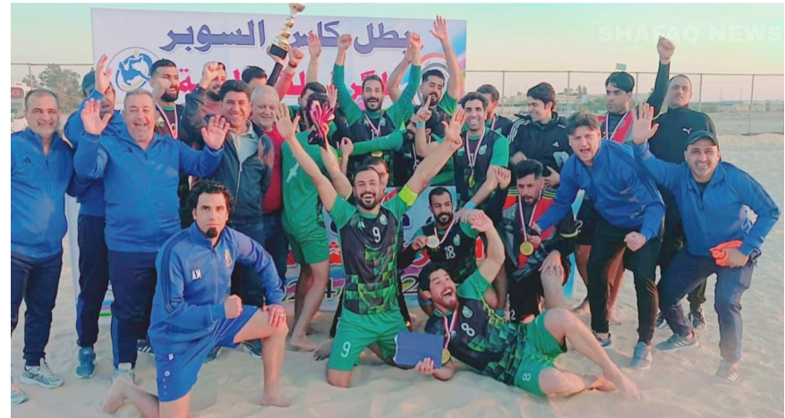
بطولة فرحة فريق المصافي بتتويجه ببطولة كرة الشاطئية

بغداد - الزمان توج فريق المصافي بطلاً لكأس السوبر لكرة الشاطئية، بعد فوزه على مصافي الجنوب بنتيجة 6-1 . وجرت مباراة كأس السوبر، بإشراف الاتحاد العراقي لكرة القدم، في ملعب مصافي الجنوب بمحافظة البصرة . وكانت مباريات الجولة الرابعة من منافسات المجموعة الثالثة للسوبر الممتاز لكرة القدم التي جرت يوم الاثنين الماضي، انتهت الأولى بفوز فريق مصافي الجنوب على ضيفه فريق احرار ميسان بنتيجة 5-0 ، وفوز