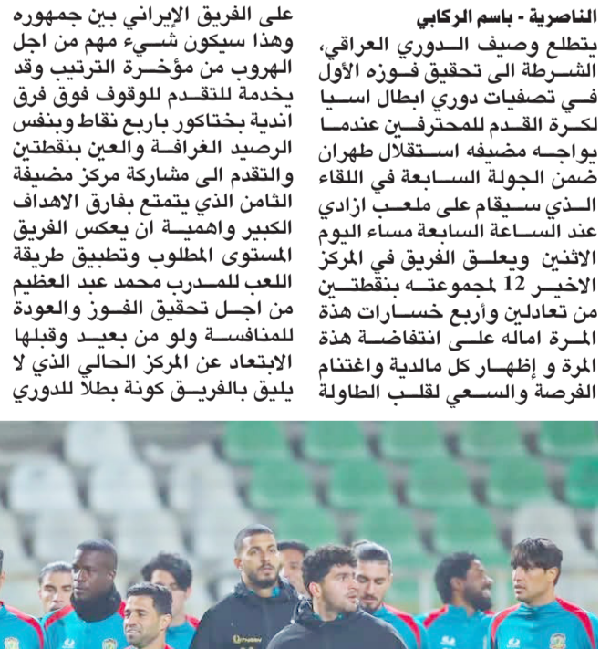
تدريبات: فريق الشرطة يتدرب في طهران استعدادا لمواجهة الاستقلال الإيراني

الحملي ثلاثة مواسم متتالية ويضم عدد من لاعبي المنتخب الوطني واسماء معروفة وقبلها استعد الفريق بعد تحقيق اهم نتائج بالدوري المحلي بالفوز على الجوية الخميس وعلى اللاعبين المتمتع بالثقة والقوة والتركيز للقيام بواجباتهم حتى يتعرض الفريق لهزة جديدة ويتعين اللعب بشعار الفوز وحده لسداواة الجروح للتخفيف من سلسلة النتائج المؤلمة والحالة الحرجة للمحترف العراقي الذي عند رغبة جمهورية بالفوز الذي يمنحة مشاركة المنافس ترتيبية