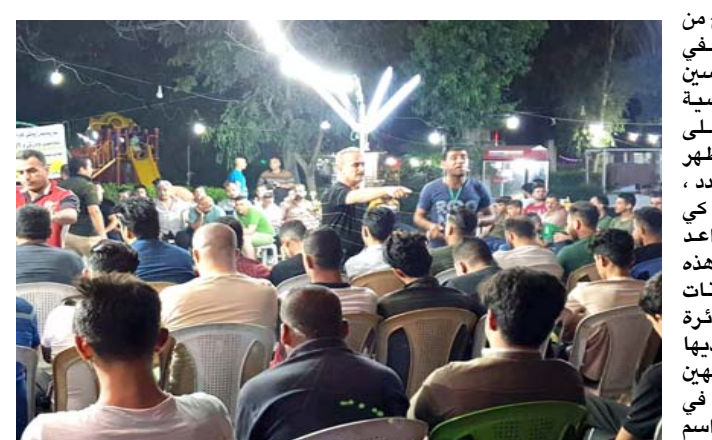
مشهد من لعبة المحيبس في مقهى خانقين

خانقين - الزمان نظم البيت الثقافي في خانقين جولة ثقافية في المقاهي والاماكن العامة في خانقين للوقوف على واقع الاعباب الشعبية في القضاء خلال شهر رمضان المبارك. حيث بدأت الساحات تزخر بمحبى وعشاق اللعبة الشعبية المتوارثة في خانقين الا وهي لعبة المحيبس الشهيرة، واجتمع الشباب لينضموا تحت فرق شعبية لكل الاحياء السكنية الموجودة في المدينة، وتتقابل لتخفى عندهم ذلك الكنز الصغير في سواعد بشرية، وما ان عجز الخصم من اخذ الضلالة حتى يعم الفرح والغناء المغادي والاقوال الحامسة في الساحة دالة على فشل المحاولة وانهم اقوى، واذا بالخشخ الساعي لكشف (المحيبس) يتحسر