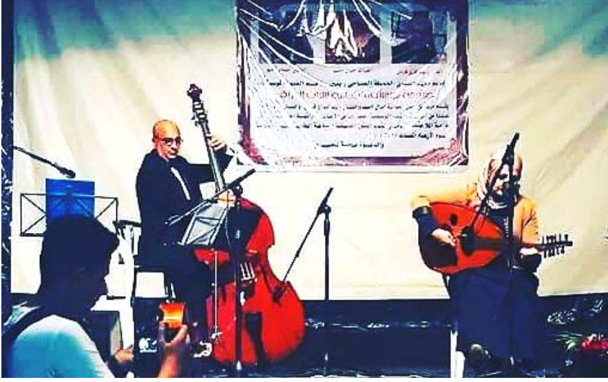
نشاطات : مسيرة و ليد غازي فرمان حافلة بالنشاطات الفنية