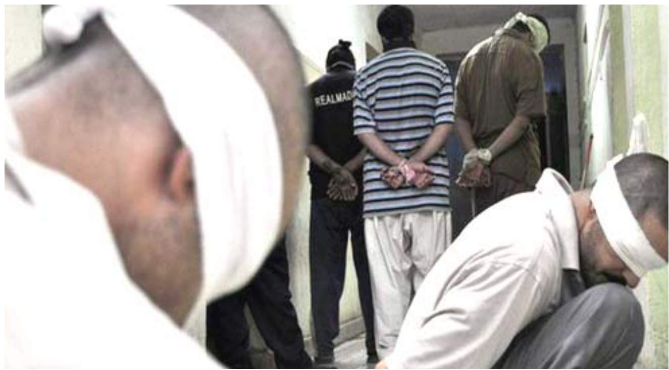
إعتقال : قوة أمنية تعتقل عدداً من المطلوبين