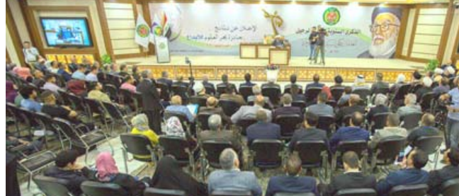
جانب من حفل جائزة الإبداع

يخطفونوا لانقلاب . وكان الاف المتظاهرين بدأوا في السادس من ايله من المحكمة والمتعلقة بجرانم إبادة واخرى ضد الانسانية وجرانم للانضمام الى مطليهم بتنحي البشير. واعلن الجيش بعد خمسة ايام اطاحة الرئيس الذي حكم السودان ثلاثين عاما بقبضة من حديد. كما اعلن اعتقال البشير وتشكيل مجلس عسكري يتولى السلطة. لكن المتظاهرين لم يوقفوا تركيزهم، بل تواصلوا مطالبة المجلس بنقل السلطة الى المدنيين. وأكد مصور في وكالة فرانس برس ان باصحات تحمل مئتا المتظاهرين واصالت النواذف السببت من ولاية كسلا في شرق