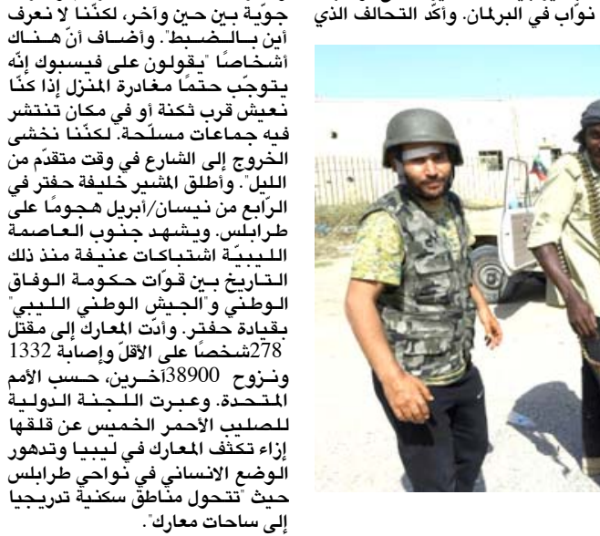
ضاحية : مقاتلون ليبيين في ضواحي طرابلس

يخطفونوا لانقلاب . وكان الاف المتظاهرين بدأوا في السادس من ايله من المحكمة والمتعلقة بجرانم إبادة واخرى ضد الانسانية وجرانم للانضمام الى مطليهم بتنحي البشير. واعلن الجيش بعد خمسة ايام اطاحة الرئيس الذي حكم السودان ثلاثين عاما بقبضة من حديد. كما اعلن اعتقال البشير وتشكيل مجلس عسكري يتولى السلطة. لكن المتظاهرين لم يوقفوا تركيزهم، بل تواصلوا مطالبة المجلس بنقل السلطة الى المدنيين. وأكد مصور في وكالة فرانس برس ان باصحات تحمل مئتا المتظاهرين واصالت النواذف السببت من ولاية كسلا في شرق