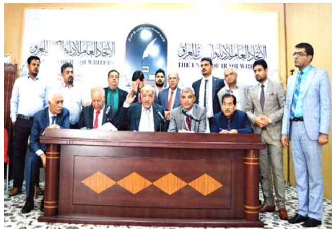
اللجنة المشرفة على إنتخابات الأدباء.