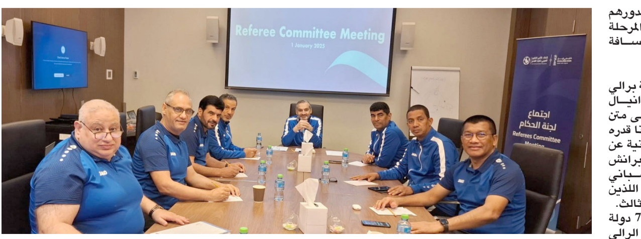
اتحاد: اجتمع لجنة الحكام في اتحاد كأس الخليج