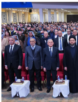
تأبين : الرسائل الثلاث والقرى خلال حضورها يوم الشهيد العراقي

التحديات والصعوبات حتى تجاوزت الكثير، وترسخت مبادئ الدولة، وتضاعفت الجهود في عملية البناء، وفي بحر الإرهاب والتطرف وترسيم السلم المجتمعي، مؤكداً (دعم العراق لأنشاقته الفلسطينية لنيل حقوقهم بحياة آمنة وفي دولتهم المستقلة، وكذلك الوقوف مع الشعب اللبناني الشقيق لتجاوز هذه الظروف وبما يساعده على تخفيف آثار المحنة على حياة اللبنانيين). ولفت إلى (الحرص على اوضاع سوريا، ودعمنا شعبيها لإعادة بناء دولته المستقلة ضمن نهج الديمقراطية العادلة المحافظة لحقوق جميع مكوناتها). فيما دعا رئيس تحالف قوى الدولة الوطنية عمار الحكيم، إلى إطلاق مبادرة لحصان إقليمي شامل لتعزيز التعاون والتفاهم بين دول المنطقة. وقال خلال الحفل اللبنانيي لذكرى استشهاد آية الله محمد باقر الحكيم أمس (أهمية استنهاج دروس الشهادة والتضحية في مواجهة التحديات السياسية والاقتصادية).