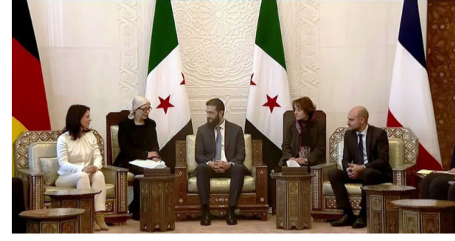
لقاء الشرع يلتقي وزير خارجة فرنسا والماني

باريس - سعد السعود زيارة لافتة قام بها وزير الخارجية الفرنسية جان نويل بارو ترافقه وزيرة الخارجية الألمانية آنالينا بيربوك إلى العاصمة السورية دمشق والتقى قائد الإدارة السورية الجديدة أحمد الشرع، وهي أول زيارة لهما عقب سقوط نظام الأسد. واستخدمت وزيرة الخارجية الألمانية بيربوك، طائرة نقل مروحية تابعة للجيش الألماني من طراز إيه 400 إم، وهبطت في مطار العاصمة دمشق، وتأتي هذه الزيارة نيابة عن منسقة السياسة الخارجية للاتحاد الأوروبي كايا كالاس، وقاما الوزيران بيربوك وبارو إجراء محادثات مع ممثلي الحكومة الانتقالية السورية. وقبيل توجه وزير الخارجية الفرنسي إلى دمشق على منصة إس إس «معا، فرنسا والماني»، نقف إلى جانب السوريين، في كل أطيافهم، مضيفاً أن البلدين يريدان «تعزيز انتقال سلمي وفعال لخدمة السوريين ومن أجل استقرار المنطقة» وأضاف «ستمثل هذه الزيارة رغبة فرنسا والماني في الوقوف إلى جانب الشعب السوري بعد سقوط نظام بشار الأسد» وأضاف أن «التبادلات الميدانية ستسمح للوزراء أيضاً بالعمل على الاستجابة لتحديات الأمن الجماعي، وفي المقام الأول مكافحة الإرهاب» وكتب الوزير الفرنسي في منشور على