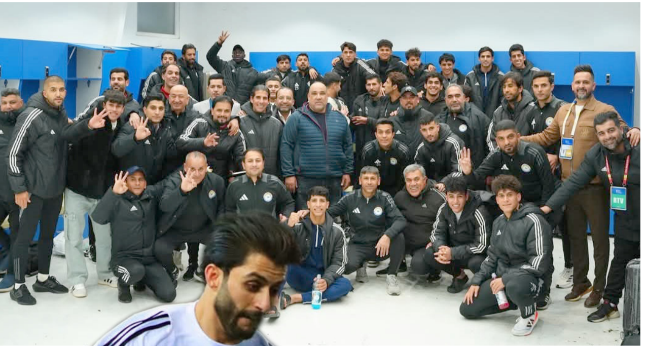
فرحة: الملوك التدريبي لفريق الزوراء، واللاعبين يعبرون عن فرحتهم بعد تحقيق الفوز على فريق الجوية