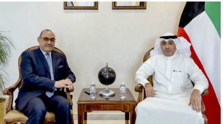
احتجاج: مساعد وزير الخارجية الكويتي يسلم مذكرة احتجاج للسفير العراقي

تلقته (الزمان) أمس إنه (بعمليات منفصلة وجهود خفيفة واستناداً إلى معلومات استخباراتية دقيقة لمديرية الاستخبارات البحرية وأقسام شعب قيادة عمليات النصرة وميسان والجزيرة والفرقة السابعة التابعة إلى مديرية العمليات والاستخبارات العسكرية بالتعاون مع القوات الامنية المساحة لارض تم نصب كامتان محكمة في مناطق متفرقة من المحافظات ذاتها. أسفرت عن الفاء القبض على 77 متنبها قضيا قانونية مختلفة في قضاء القائم والنجف والكربلاء