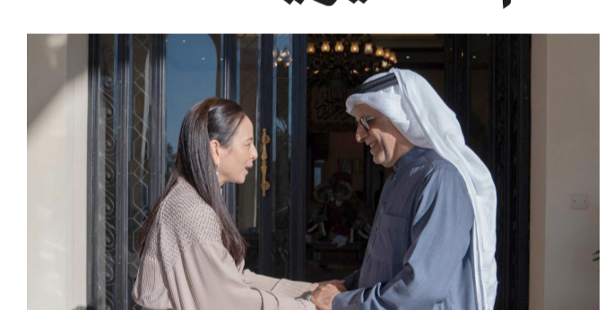
في البلاد بما يسهم في تحقيق المصالح العليا للعبة.

جهود سلمان بن ابراهيم آل خليفة في قيادة مسيرة الاتحاد الآسيوي لكرة القدم نحو التقدم والنماء، مؤكدة حرص الاتحاد التايواني على التفاعل الإيجابي مع مساعي الاتحاد القاري نحو رسم ملامح المستقبل المشرق لكرة القدم الآسيوية على مختلف الأصعدة.