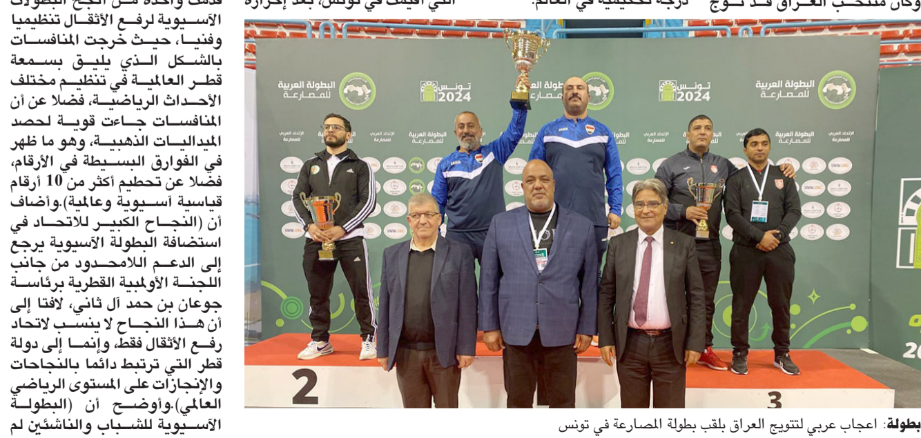
بطولة: أعجاب عربي لتتويج العراق بلقب بطولة المصارعة في تونس

وقية الاتحادات الوطنية بما يصب في تحقيق التنمية المرجوة لأركان اللعبة على الساحة القارية. خطته تطوير واستمع رئيس الإتحاد الآسيوي لكرة القدم إلى إيجاز عن خطط التطوير في الإتحاد التايواني للشعوب المقبلة، مشيدا بما تضمنه من مساور متميزة وأهداف موححة، مؤكدا أهمية وحدة وتضامن أسرة اللعبة