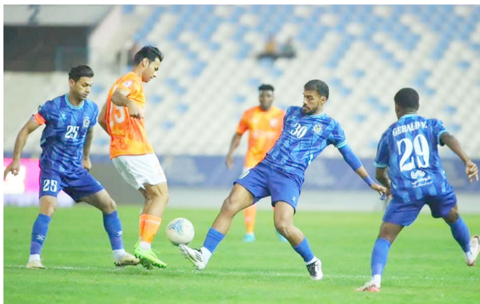
مواجهة : إحدى مواجهات فريق القوة الجوية في دوري المحترفين

جمهورية جارة العراق الضعيف وتفكك خطوط اللعب والفشل في تقديم العمل المطلوب لتجاوز حالة الضعف التي يمر فيها قبل أن تعمق جراحة الخسارة الخامسة والتعويل سيكون على خبرة المدرب قسطنطين جدير بدلاً لرفيقه والمحاولة استعادة الثقة للاعبين الفريق الذي لم يستطع اغتنام فرصة مباريات المدينة وتحولها لنفسه رغم أنها تحظى باهتمام كبير وتجمد رصيداً في المركز الثامن عشر. وحقق اربيل فوزاً مهماً على الكهرياء بنتيجة أربعة أهداف لواحد قبل أن يمتدح اثار خسارة الميناء ويبحث أصل المنافسة مرة أخرى بعدما خاض المهمة بقوة وتركيز وخرج مرفوع الرأس بين جمهوره وقدم للمركز الخامس 18 ويظهر في دفاع ضعيف تلقى 17 على عكس الهجوم الواضح الذي سجل 18 كما يحتاج الفريق للتوازن في النتائج فيما عاد الكهرياء بالخسارة الثانية بعدما قطعت مساعي ولي كريم في البحث عن الفوز لكن الفريق لم يدرج التعامل وللمرة الثالثة يواجه صعوبات مو اجهات الذهاب بخسارتين وتعادل واخذ بنتيجة عن بداية وتراجع مركزاً 14. ونجح الجوية في تحظى عقبة الكرامة بالهدف الوحيد وتحقيق الفوز الثالث تحت قيادة لؤي صلاح والخاسر في البطولة والتقدم امام الكرخ الذي ظهر أكثر تنظيمياً و