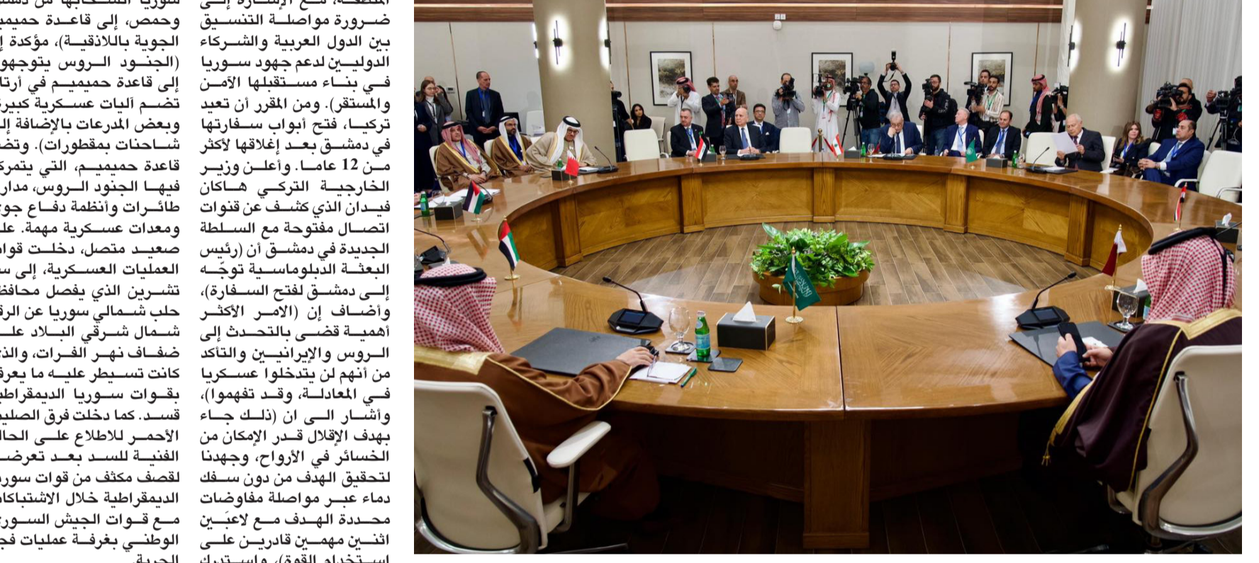
اجتماع : لجنة الاتصال الوزارية العربية بشأن سوريا تعقد اجتماعها في مدينة العقبة الأردنية

عنان - رند الحاشمي أكد البيان الختامي للجنة الاتصال الوزارية العربية بشأن سوريا في اجتماعها المنعقد بمدينة العقبة الأردنية، التضامن الكامل مع الشعب السوري وحقوقه في تحديد مصيره، مع تأكيد أهمية دعم العملية الانتقالية السلمية السياسية السورية - السورية. وأوضح بيان