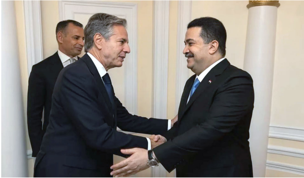
مصافحة : رئيس الوزراء ومصافح وزير الخارجية الأمريكي خلال زيارته بغداد

إلى الحفظة على أمن سوريا في مستهل جولة الأخير (بليكنك دعا إلى انتقال شامل دعاً إلى مسؤولية وتخليتها بخيارها الشعب السوري)، وأشار إلى أن الولايات المتحدة تأسل ضمان أمن سوريا قاعدة للإرهاب وعدم تشكيلها تهديداً لجيرانها). وقال بليكنك قبيل مغادرته الأردن متوجهاً إلى تركيا إنه عندما يتعلق الأمر بالعديد من الجهات الفاعلة التي لديها مصالح حقيقية في سوريا، فمن المهم فعلاً في هذا الوقت أن نحاول جميعاً التأكد من أننا لا ننظر أي مؤاعرات إسرائيلية، وأضاف إن (إسرائيل تحاول ضمان أن العملية العسكرية التي تخلى عنها الجيش الإسرائيلي لن تقع في أيدي إرهابيين ومتطرفين إلى ذلك)، ورأى أن (تركيا لديها مصلحة حقيقية واضحة في منع التصعيد في سوريا)، وشدد على أن (دور مقاتلي قوات سوريا الديمقراطية بقيادة الأكراد حيوي لمنع عودة ظهور داعش في سوريا بعد الإطاحة بالأسد).