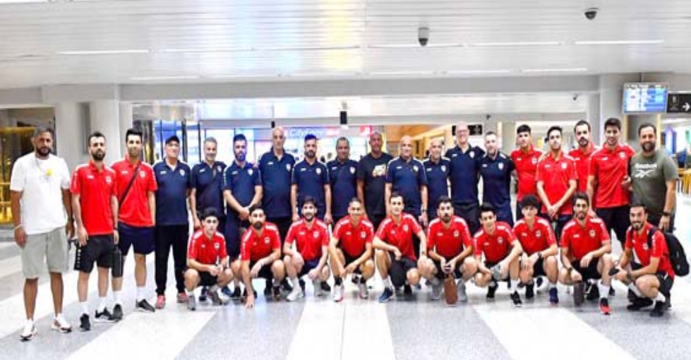
معسكر منتخب الصالات يسكن في لبنان استعداداً للمستحققات القادمة

بغداد- الزمان استقبل وزير الشباب والرياضة أحمد المبرقع وفد مجلس الشورى السعودي ورئيس لجنة الصداقة العراقية إبراهيم القنصان للبحث سبل التعاون الشبابي والرياضي بين البلدين الشقيقين.