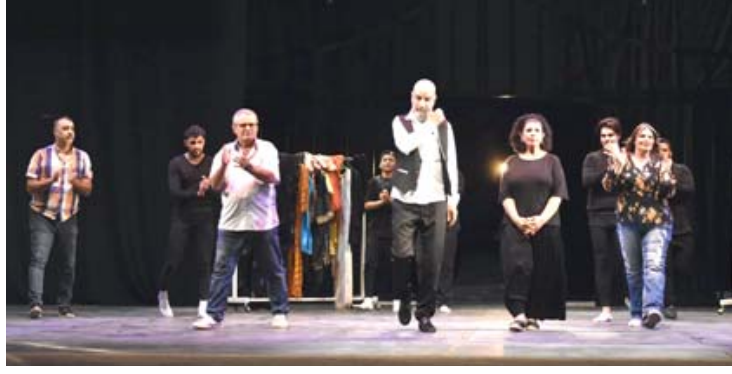
مسرحية: لقطات من مسرحية (عزرائيل) على خشبة الرشيد