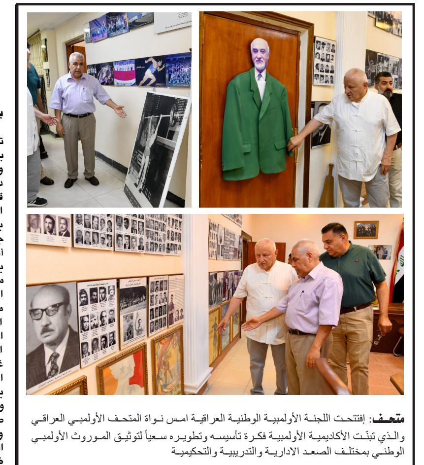
متحف: إفتحت اللجنة الوطنية العراقية امس نواة المتحف الأومبي العراقي والذي تبنّت الأكاديمية الأومبية فكرة تأسيسه وتطويره سعياً لتوثيق الموروث الأومبي الوطني بمختلف الصعد الادارية والتدريبية والتحكيمية

بغداد - ابتهاج العربي تسببت قوة الكوارث الطبيعية بمقتل الآف الضحايا في ليبيا والمغرب في أعقاب إعصار دانيال وزلزال مدمر بلغت قوته أكثر من 7 درجات، فيما استبعد خبراء صعوبة التنبؤ بالزلازل. وقال الأكاديمي في جامعة مونبلييه فيليب فيرنان (من الناحية العلمية، يعتبر التنبؤ بهذه الزلازل مستحيلًا)، وأضاف (لا يمكن التنبؤ بأي شيء، وأن محاولاتهم تقتصر على تقدير التكرار بالاستناد إلى قوة الزلازل المختلفة)، وأشار إلى انه (يمكن أن يكون السلوك غير متنبأ به بسبب العوامل المعقدة). وتابع ان (الزلازل قد يحدث خلال فترة قصيرة، وبعدها يمكن أن يمر وقت طويل من دون وقوع أي زلازل، وهذا يوضح تعقيد الظواهر الجيولوجية). وارتفع عدد ضحايا زلزال المغرب إلى 2681 قتيلًا. وتمسكت السلطات من دفن 2530 شخصاً منهم، بينما بلغ عدد الجرحى 25 ألفاً و 621. وقضت آلاف الأسر المغربية ليلة رابعة في العراء بعد الزلزال الذي ضرب البلاد الجمعة الماضية. وانضمت فرق طوارئ من خارج المغرب إلى جهود الإنقاذ، الذي يواصل البحث عن ناجين محتملين من الزلازل. وقالت مساعدا طارئة من أربع دول، هي بريطانيا وإسبانيا وقطر والإمارات). وظهرت صور التقطها سكان المنطقة المنكوبة في ليبيا، سيولاً ومباني منهارة وأحياء بأكملها غارقة تحت المياه. وأعلنت ليبيا الحداد ثلاثة أيام، بعد سقوط مئات القتلى، بسبب الإعصار، الذي ضرب المناطق شمالي وشرقي البلاد، مصحوباً بأمطار غزيرة، مما أدى إلى تدمير