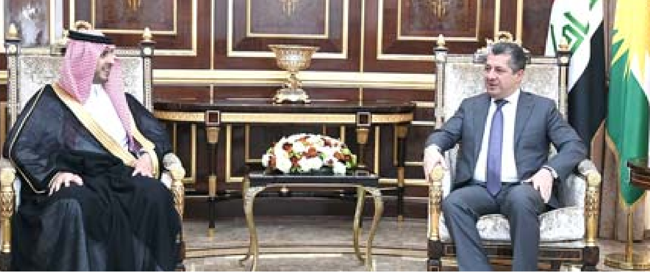
لقاء - رئيس حكومة إقليم بلتقي وفد سعودي

القانون، الذي يعزز البرلمان مناقشته. وقال في بيان (كما عهدنا الشعب بالوقوف إلى صفه وحماسه من الإجراءات والإرهاب، وبناء المجتمع والوطن بالسلام والتعايش. نعلن الجلسات المقبلة لغرض القراءة الأولى)، وتابع أن القانون ما زال بحاجة إلى مزيد من الوقت لغرض تشريعه، ومضى إلى القول أن اللجنة ستقوم بمراقبة ما يضاف من نصوص القانون من أجل ضمان عدم مخالفته للدستور والقوانين (النافذة)، فيما رفض رئيس تحالف فتح جهادي العامري، لأي تعديلات مشبوهة على