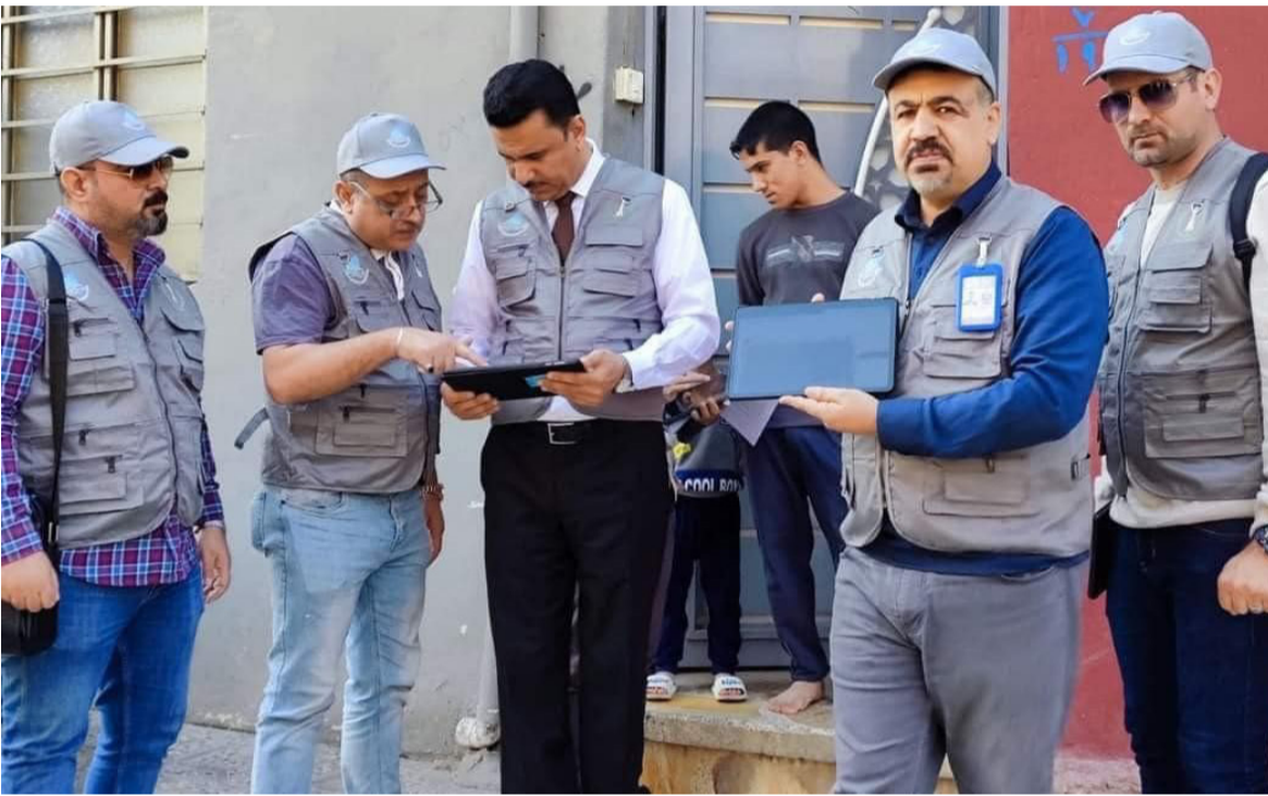
تعداد : فرق وزارة التخطيط تشرع بإجراءات التعداد العام في بغداد والمحافظات

اعتصمت أحدث الوسائل التكنولوجية لإجراء التعداد بشكل علمي وإلكتروني دقيق، لنؤسس لمعايير رقمية رصينة لتصبح هذه العملية أداة علمية حديثة في التخطيط، وأضاف أن (التعداد سيكون حصر الزاوية في استكمال أولويات البرنامج الحكومي ويعكس استعدادنا لتتخذ الخطى الترميمية التي تخدم الحزبية أو الخارجية، وأشار السوداني في تدوينة على منصة