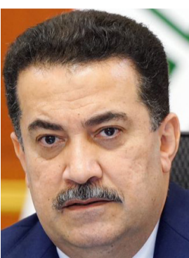
محمد شياع السوداني

بغداد - الزمان كشفت مصادر، عن استعداد رئيس الوزراء محمد شياع السوداني، لإجراء تغييرات في المناصب العليا بالحكومة، من بينها إقالة أمين بغداد بعد إخفاقه في الإدارة وعدم قدرته على تحسين الواقع الخدمي في أقدم عاصمة العالم. وقالت مصادر مطلعة لـ (الزمان) إن (السوداني) يعزّم إجراء تعديل وزاري في حكومته وعلى رأس القائمة سيكون أمين بغداد، نظراً للشكاوى المتزايدة من المواطنين والمختصين بشأن تدهور الخدمات في بغداد، العاصمة التي تعاني من العديد من الأزمات اليومية، من بينها تراكم النفايات وانقطاع الكهرباء وتردي شبكة الطرق والمجاري، فضلاً عن الفصل في تحسين البيئة الحضرية والحد من الزحام المروري، وأضاف إن (السوداني) يرى أن الإدارة الحالية لأمانة بغداد قد أخفقت في تقديم حلول جذرية لهذه المشاكل المزمنة، وأن الوقت قد حان لاتخاذ قرارات حاسمة لتغيير الواقع، وذلك من خلال استبدال القيادات غير القادرة على تحقيق الإصلاحات المطلوبة، وتوقعوا (شمول التغييرات المرتقبة، تعيين مسؤولين جدد يتمتعون بالكفاءة والقدرة على اتخاذ خطوات سريعة وفعالة لتحسين الخدمات، ولإسيما في المجالات الحيوية مثل التخطيط والنفط والنقل والتخطيط العمراني).