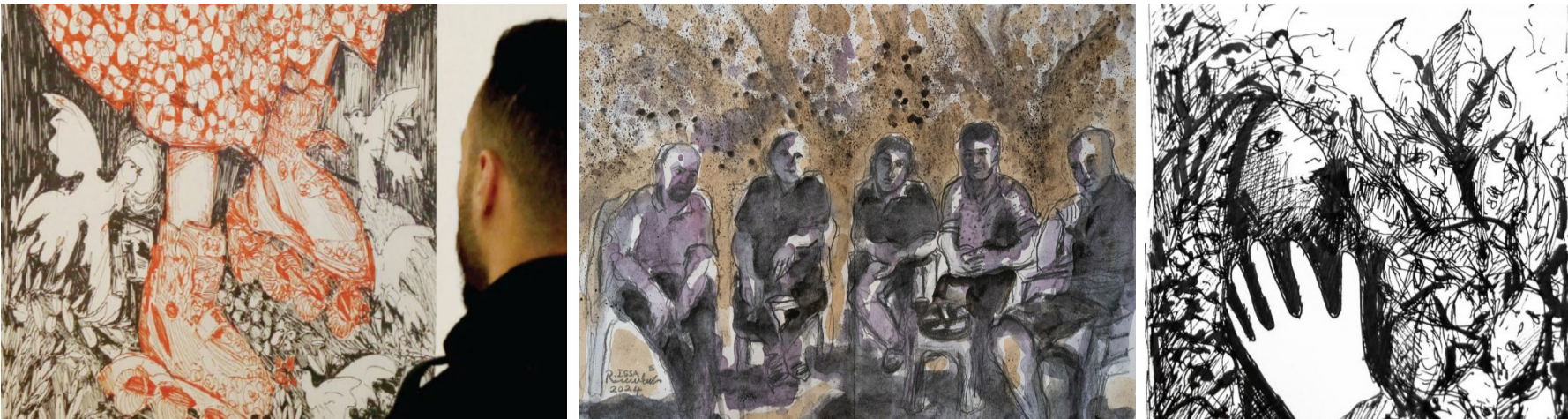
معرض: لوحات من معرض (تحت النار) في عمان