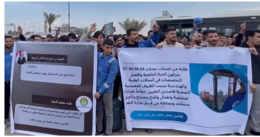
تظاهرة : خريجو معهد النفط في تظاهرة للمطالبة بالتعيين

بغداد - قصي منذر معرضين عن (استيائهم من عدم تنفيذ الوعود التي قدمت لهم خلال لقاءات مع المسؤولين، بما في ذلك لقاء رئيس الوزراء محمد شياع السوداني)، وأضافوا (نحن شريحة قد جرى تهميشها خلفاً لحق التعيين وعدم مراعاتنا في ذلك)، وأشار إلى أنهم (يتطلعون لما يفرجهم بعد التخرج من المعاهد الفنية)، وأوضح الخريجون أنهم (واجهوا معوقات عدة، وتم طرح وعود ولكنها لم تتحقق مما دفعتنا الحاجة إلى الخروج بتظاهرات وللجوء إلى الاعتصام إيماناً منا بتحقيق هذا المطلب وهو حق