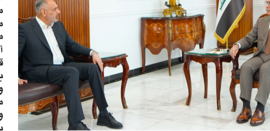
استقبال : رئيس مجلس القضاء الأعلى يستقبل محافظ بابل

جريمة الإضرار العمد بالمال العام، وأشار إلى أن (القرارات صدرت وفقاً لأحكام المادة 340 من قانون العقوبات، وبدلالة مواد الإشتراك 47 و 49 منه)، وتابع عن (المدة صرفت أثناء فترة إدارتها للمصرف قروضاً لشراء سيارات باسماء أشخاص دون علمهم وموافقتهم، بناءً على كفالات مزورة). واستطرد بالقول إن (المحكمة، بعد اطلاعها على الأدلة والإلتامات المتعلقة بقوصات التحقيق الإداري، وأقوال الممثل القانوني لخصم الرشيد الذي طلب الشكوى ضد المتهم، جريمة إضرارها العمد بالمال العام، وجندتها كافية