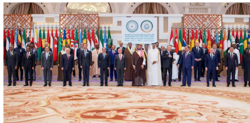
قمة : زعماء الدول العربية والإسلامية المشاركة في قمة الرياض

بغداد - ابتهاج العربي أكد فادي الشمري، مستشار رئيس الوزراء للشؤون السياسية، إن العراق ومن خلال مشاركته في القمة العربية والإسلامية الطارئة التي عقدت في الرياض، جدد موقفه الثابت في دعم القضية الفلسطينية والقضايا العربية العادلة، ويدعو إلى تكثيف الجهود الإغاثية لدعم الشعبين الفلسطيني والعراقي، كما يسعى إلى حشد المساعدات الإنسانية العاجلة والنخفيف من معاناتهم جراء العدوان، كما يسعى إلى حشد الدعم الدولي لتعزيز صمود الشعبين واللبانين وضمان حقوقهم الإنسانية. وسجل العراق، تحفظه على مفردات حل الدولتين في القرار الصادر عن القمة العربية والإسلامية، وجاء في نص البيان الختامي للقمة (قيام العراق بتسجيل تحفظه على مفردات حل الدولتين أيما وردت في القرار الصادر، التزاماً بالقوانين الوطنية العراقية). وأكد رئيس الوزراء محمد السوداني أن العراق يجدد بقوة طرح مبادرته نحو إنشاء صندوق عربي وإسلامي لإعمار غزة ولبنان، بيان تلقته (الزمن) من (السوداني)، شارك في القمة المشتركة التي استضافتها المملكة العربية السعودية، وشارعاً استمرار العدوان الصهيوني على الأراضي الفلسطينية واللبانين، وتطورات الأوضاع الراهنة في المنطقة، وأشار السوداني خلال كلمته إلى أن (الصراع لم يبتلع في 7 تشرين الأول 2023 كما يصوره البعض، في تغافل متعمد من الإحتلال والتهجير واغتصاب الأرض والتجاوز على الشرائع الدولية وحقوق