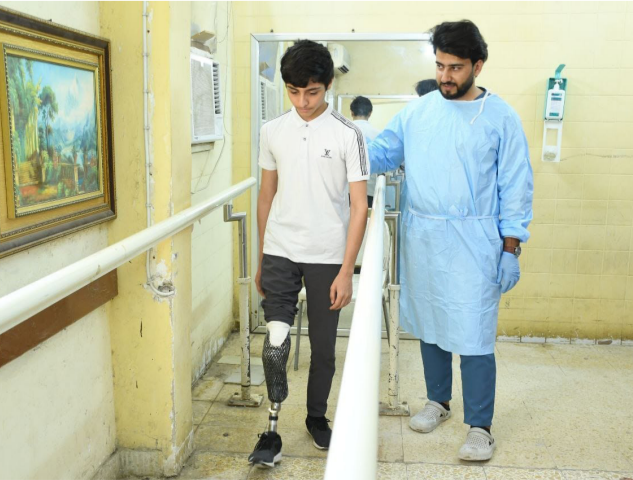
تدريب: مساعد طبي يدرب شاباً على طرف صناعي