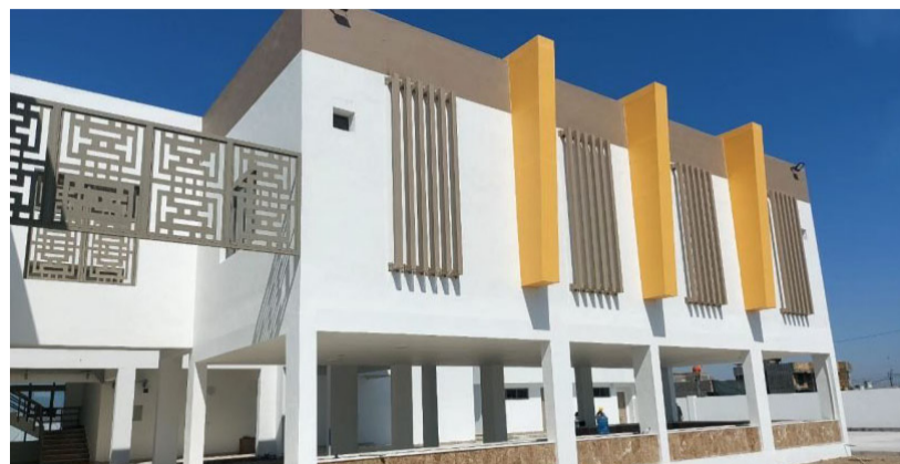
افتتاح مدرسة جديدة تم افتتاحها في كربلاء

بعد المسافة)، بحسب تعبيرهم، (الإعدادي)، مشيرين إلى أن (إدارة متوسطة السدرة لازالت ترفض بقاء الطالبات بهذه البناية على الرغم من أن دوامهن مغاير لدوام المدرسة)، وأوضحوا أن (المدرسة التي يراد نقل الفتيات لها بعيدة عن مركز المحافظة.