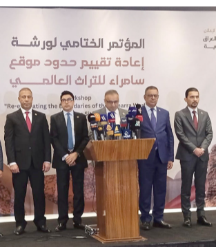
مؤتمر: فريق ثقافي في مؤتمر صحفي

وتقع المشاريع المهمة بالمنطقة العازلة وهي ضرورية لاستكمال المشاريع الموقفة، وجميع الآثار محمية وتخضع لمراقبة دقيقة من شرطة المحافظة والإدرات المحلية لإزالة أية تجاوزات عليها، و تم مناقشة أهم المواضيع الحيوية بما في ذلك تحليل الوضع الراهن لمدينة سامراء وتحديد التحديات التي تواجهها، واستعراض المعايير الدولية المنبغية على تقييم مواقع التراث العالمي، والتركيز على أهمية التنسيق بين المؤسسات المحلية والوطنية وبين العنصرية المتدامة لقضاء سامراء والوحدات الإدارية التابعة