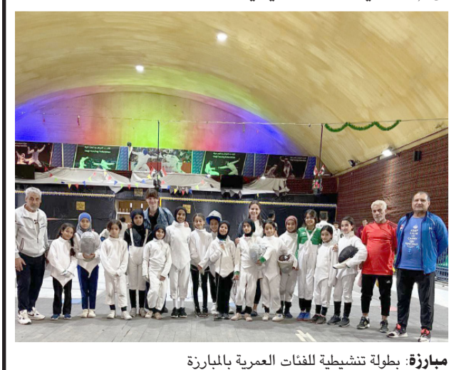
مبارزة: بطولة تنشطية لفئات العمرية بالمبارزة

بغداد-الزمان في إطار مهامه الرياضية، وبدعم من اللجنة الأولمبية الوطنية العراقية، نظم الإتحاد العراقي للمبارزة والخماسي الحديث تصفيات تنشطية، بمشاركة كبيرة من اللاعبين واللاعبات من مختلف الفئات العمرية، وإستمرت ليوم واحد، وتضمنت البرنامج المنافسات على الأسلحة الثلاثة سلاح الشيش والسيف العربي وسيف المبارزة، بهدف تطوير مهارات اللاعبين، وتوسيع قاعدة المشاركة. وأقيمت التصفيات بالتعاون مع أكاديمية بغداد والمركز التدريبي لرياضة المبارزة، حيث أشاد الإتحاد بالمشاركة الفاعلة التي ساهمت في نجاح الفعاليات. وأكد الإتحاد العراقي للمبارزة أن التصفيات التنشطية