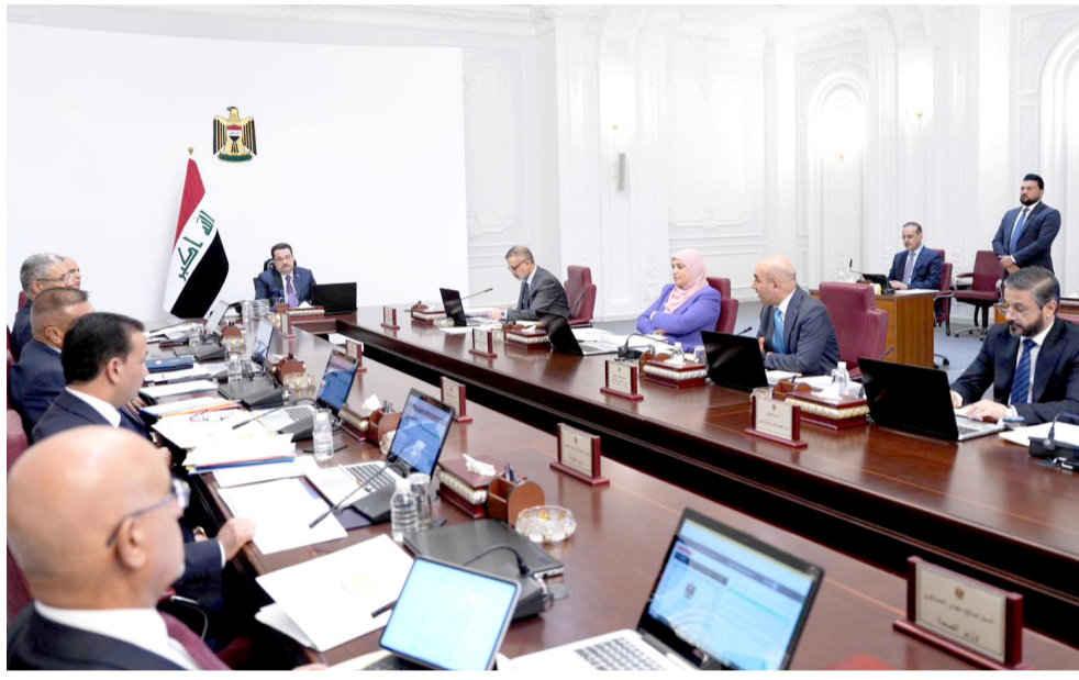
جلسة: رئيس الوزراء محمد شياع السوداني يترأس الجلسة الأخيرة للمجلس

3 تكون من اختصاص وزارتي التخطيط الاتحادية، حسب الاتفاق المشترك، حيث يتم تنظيم سجل خاص بهذه المناطق بضمن نتائج مقاطعة البيانات، وتحفظ الوزارة بسنخه هذا السجل، وكذلك الالتزام بتنفيذ جداول إحصائية حول أعداد المرشحين والوافدين والنازحين في المناطق المتنازع عليها والمحافظات الأخرى وحسب المستمسكات الرسمية، ولفت البيان إلى ان (على وزارة المالية تعويض حكومة الإقليم من النفقات السيادية عن كلف الإنتاج والنقل، عن كميات النفط المنتجة في الإقليم التي يتم استلامها من قبل شركة تسويق النفطسومو، أو وزارة النفط الاتحادية، ويتم احتساب الكلف التخمينية العادلة للإنتاج والنقل لكل حقل على حدة، من جهة استشارية فنية دولية متخصصة، تحدها الوزارة الاتحادية بالاتفاق مع وزارة الثروات الطبيعية في الإقليم خلال 60 يوماً من فإخذ هذا القانون، وفي حالة عدم الاتفاق خلال المدّة المذكورة، يحدد مجلس الوزراء الاتحادي الجهة الاستشارية المشارة (اليها).