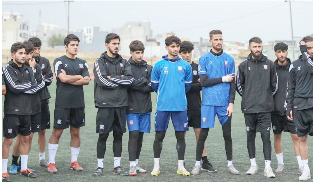
تدريبات: فريق زاخو يجري تدريباته الاخيرة قبل مواجهة اربيل

الدرجة الأولى تنتقل اليوم الخميس الجولة الاولى لدوري فرق الدرجة الاولى لكرة القدم بإقامة عشر مواجهات تقام في بغداد