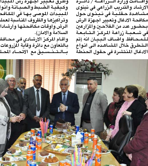
تدريب : الزراعة تكرم الوكيل الفني

واقامت وزارة الزراعة / دائرة الارشاد والتدريب الزراعي في نيوى مشاهدة حقلية في نيوى حول مكافحة ادغال وتعير أجهزة الرش بحضور عدد من الفلاحين والمزارعين في شعبة زراعة المركز التابعة للمحافظة و اضاف البيان انه تم التطرق خلال المشاهدة إلى انواع الادغال المنتشرة في حقول الحنطة