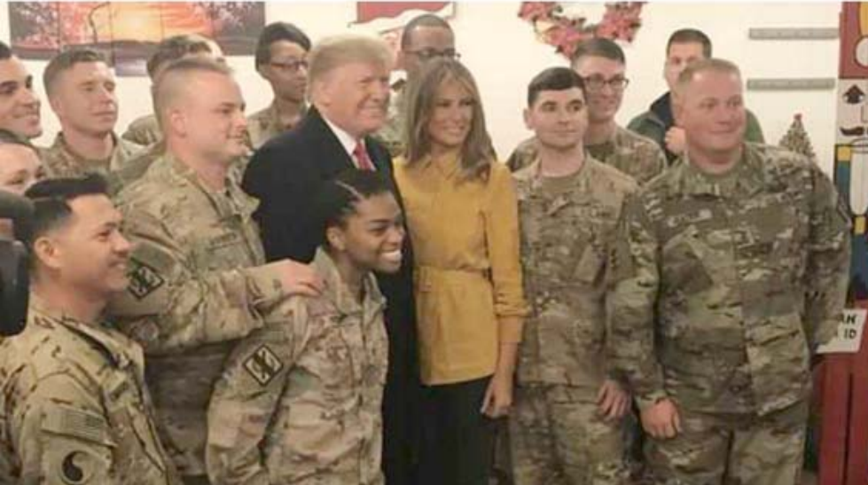
جنود ، ترامب وزوجته بين جنود قاعدة عين الأسد

بغداد - قصي منذر رأى خبير في الشأن السياسي وجود رددود أفعال متضاربة بشأن زيارة الرئيس الأمريكي دونالد ترامب غير المعلنة إلى العراق بسبب تقاسم التبعية السياسية بين أمريكا وإيران وغياب منسلة السيادة في التصريحات ومسألة تكرار خرق السيادة الوطنية. وقال رئيس المجموعة العراقية للدراسات الاستراتيجية وفاق الهاشمي لـ (الزمان) أمس ان (ردود أفعال السياسيين بشأن زيارة ترامب إلى قاعدة عين الأسد بمحافظة الأنبار ولقاء قواته العسكرية لساعات تأتي في ظل انقسام المشهد السياسي بين تبعية إيرانية وامريكية)وأضاف ان (هناك اجماع بان الزيارة تعد خرقا للاعراف الدبلوماسية وتجاوز السيادة الوطنية للبلاد والنقض يحاول التصعيد لجبهة ما والاخر يحاول التخفيف ويعطي الحق لترامب بالتجاوز على العراق)واوضح الهاشمي انه (يجب ان تكون هناك اتفاقا بوضع المصلحة العراقية قبل كل شيء ومن يتجاوز على العراق لا يسمح له وبالتالي نستطيع بناء علاقة جديدة والتي تعد غير موجودة حاليا في ظل دولة المؤسسات وتعدد الولايات للخارج وغياب المصلحة الوطنية وربما يستمر هذا الامر في ظل التعديلات لعل أخرى).يوضح:كشف سياسي حول انشقاق الوضع لزيارة ترامب الاخيرة لتصفية حسابات مع الولايات المتحدة وآخرون ركبو الموجة. ونقلت تقارير عن السياسي قوله ان (المواقف من زيارة ترمب إلى