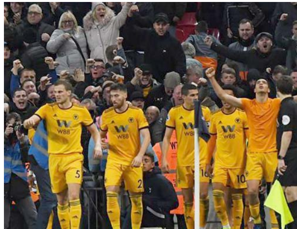
رياضيون صينيون تحت العقوبات الجنائية

ملموسة لمكافحة هذه الآفة. ولم تشا إدارة الشؤون الرياضية في الصين تأكيد تقارير الوكالة الرسمية عندما حاولت وكالة فرانس برس الاتصال بها. وتطلعت سمعة الصين في المحافل الرياضية الدولية في العقد الأخير حيث تم تجريد بعض رياضيين من ميدالياتهم الذهبية في الألعاب الأولمبية في بكين عام 2008 لتبوء تناولهن منشطات بعد إعادة تحليل فحوصات الكشف عن المنشطات، وفي كانون الثاني/يناير من العام الحالي، عاقبت الصين العديد من رياضيين لتبوء تناولهم منشطات ممن بينهم متزاح على الجليد واوقفتها عامين عن ممارسة أي نشاط رياضي وابعدهت عن المنتخب الوطني المشارك في دورة الألعاب