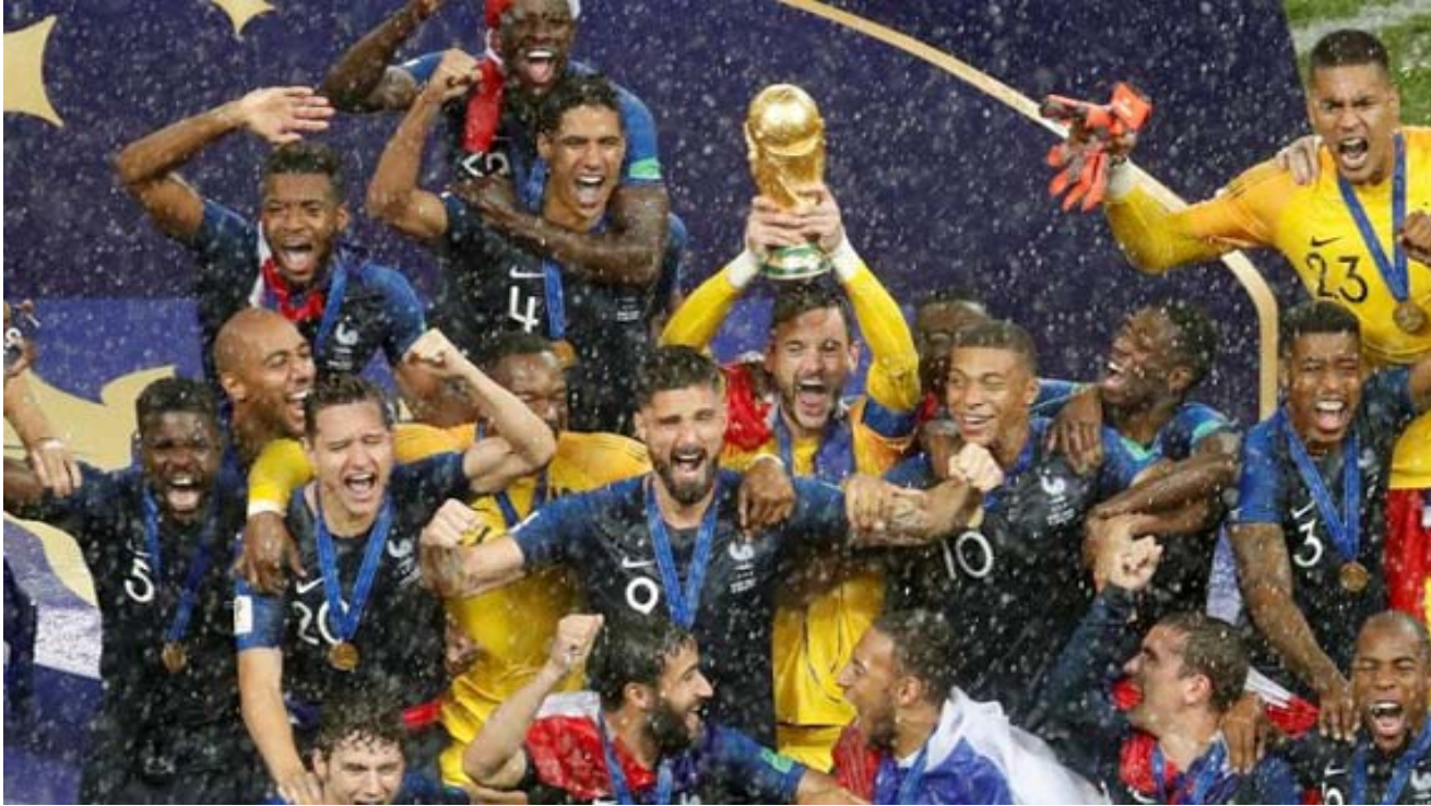
أحداث كبيرة: شهد عام 2018 العديد من الأحداث الرياضية الكبرى أبرزها فوز فرنسا بالمونديال