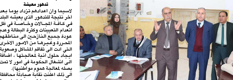
زيارة وفد دولي خلال زيارة ديالى