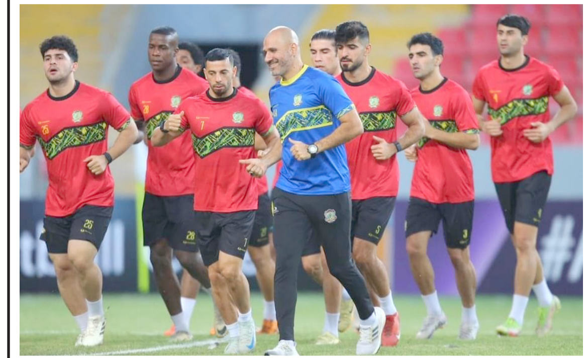
إبطال اسيا : جرت أمس على ملعب كربلاء الدولي مواجهة بين فريق الشرطة وفريق باحثو الأوزكي ضمن منافسات دوري أبطال اسيا. نتيجة اللقاء، على الموقع الإلكتروني لجريدة (الزمان).