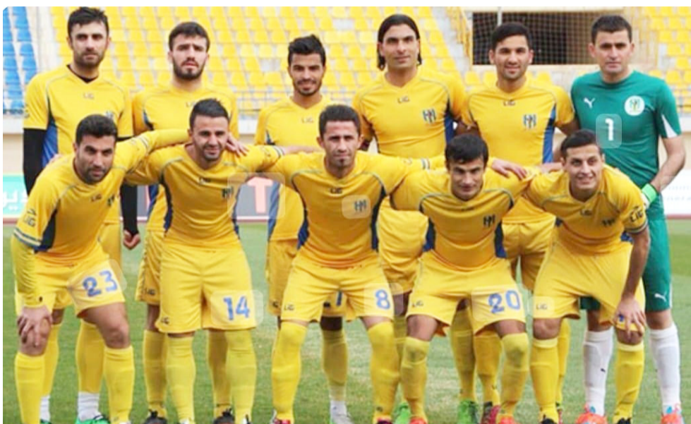
استعداد: فريق دهوك يستعد لمواجهة أهلي صنعاء، في دوري أبطال الخليج

ملعب سوق الشيوخ في الناصرية على تقديم مباراة قوية والخروج بكل الفوائد على حساب الكاظمية وصيف الدرجة الأولى المنتزع إلى مشاركة مهمة بعد التخضير لها ويلتقي مصافى الجنوب ضيفة الرمادي وكلاهما يامل في حسم الاختبار الأول كما يجب وتدوين كامل النقاط في سجل النتائج ويكون فريق الحسين قد تعلم الدرس من مشاركة الموسم الماضي المعقدة والبقاء بصعوبة عندما يبدأ المنافسة في تحدي العهد الذي يريد أن يحقق أهداف العودة إلى دوري المحترفين عندما يعيد الكرة المحترفة هذه المرة ويعني النفس في موسم يساعدهم للعودة إلى دوري المحترفين عندما يفتتح مشواره في لقاء غير سهل مع ضيفة البحر الذي يريد إيقاف خطوط المضيف عن العمل والعودة بالعلامات كاملة ويخرج ميساب برغبة الفوز الشيء المهم المطلوب تقديمه لأخصاره على حساب ضيفة الاتصالات الآخر الذي يكون جهز نفسه للجولة.