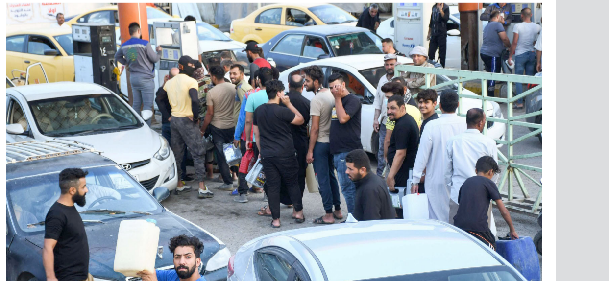
وقود، ازحام على محطة وقود في كربلاء

بغداد - ندى شوكت كربلاء - محمد فاضل ظاهر طالب اصحاب المولدات الاهلية في كربلاء، حكومتهم، بتوفير مادة الكاز، لتجهيز المواطنين بالكهرباء، وذلك خلال وقفة احتجاجية امام مبنى المحافظة، لمعالجة النقص الحاد بالكاز، مهددين بإبطاء مولداتهم في حال استمرار أزمة الوقود.