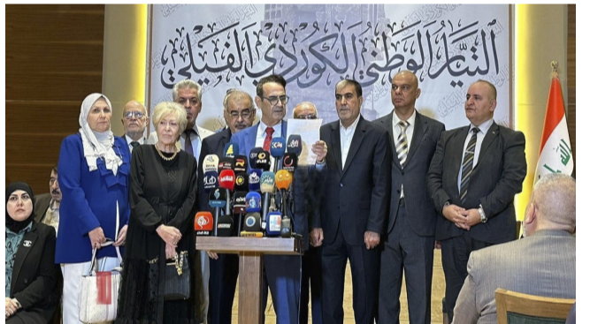
بيان:نواب التيار الوطني للكردي الغيلي خلال تأسيس التيار

بغداد - الزمان يقدم التيار الكردي الأصيل، مؤتمره التأسيسي الأول في بغداد يوم السبت المقبل. وجاء في دعوة الانعقاد تحت شعار من أجل تدويل جريمة قتل الكرد الأصيلين لتفتتها (الزمان) اسم ان (هذه المؤتمر يأتي في إطار جهود التيار لتسليط الضوء على الانتهاكات التي تعرض لها الأكراد الأصيليون، ومطالبة المجتمع الدولي بالتحرك ضد هذه الجرائم). وأضاف ان المؤتمر سيشتمول مجموعة من المواضيع، بما في ذلك البحث عن البيات تدويل قضية الأكراد الأصيلين، وسبل دعم حقوقهم وتزويد الوعي بشأن هذه القضايا على الصعيدين المحلي والدولي.