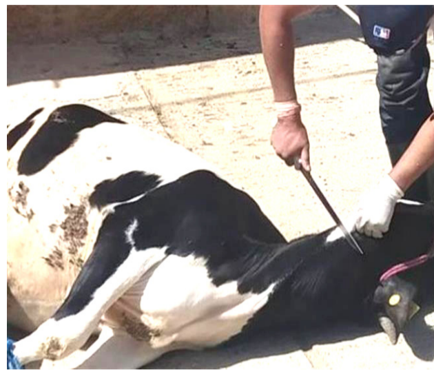
ذبح، تصاب بذبج عملاً

بيئة واطباء انه (على الرغم من التحذيرات الصارمة التي تطلقها الجهات الحكومية للحد من خطورة الموقف على الصحة والبيئة، الا ان الممارسات الخاطئة للذبح حذر خبراء بيئة، من تزايد ظاهرة الذبح العشوائي في المحال والشارع، مؤكداً ان هذه الظاهرة خطيرة، وتمس حياة المواطنين، وذكر خبراء