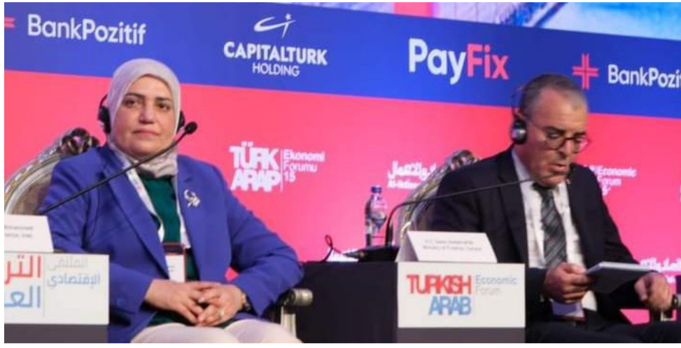
مشاركة وزيرة المالية في المنتدى الاقتصادي العربي التركي في دورته الخامسة عشرة

خبير: استقرار نسب التضخم يعكس نجاح السياسة النقدية