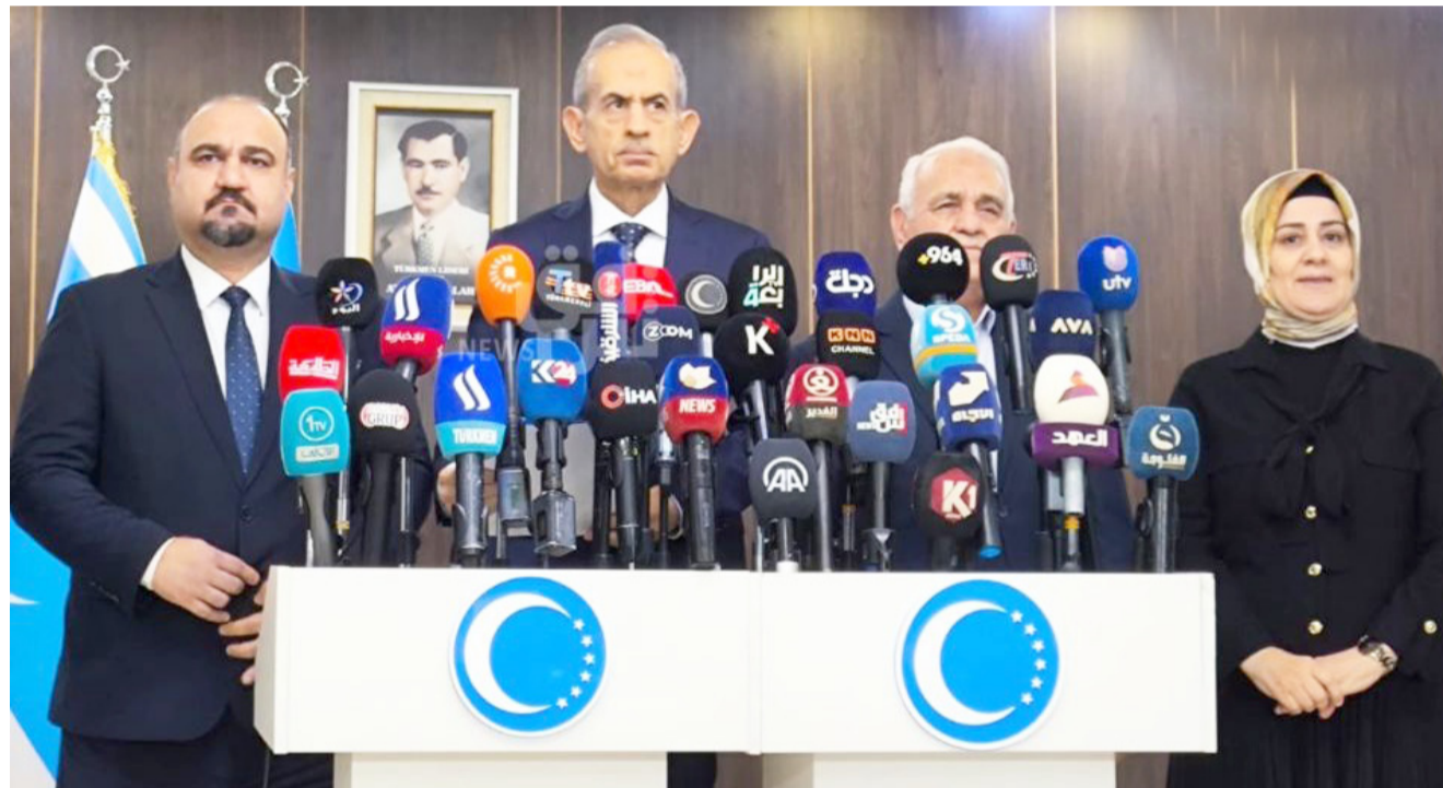
مؤتمر: قيادة المكون التركماني خلال مؤتمر صحفي

ان الوضع الأمني في كركوك جيد، ويقدم كل الشكر للأجهزة الأمنية في جهاز الأمن الوطني والخبرات والاستخبارات وقيادة العمليات المشتركة)، وأضاف ان (هؤلاء لديهم تنسيق عال مع الأجهزة الأمنية في الاقليم من اجل القضاء على مجاميع داعش، وتم خلال 30 يوماً توجيه ضربات مهمة للتتظيم، وقتل عدد منهم والوقوف